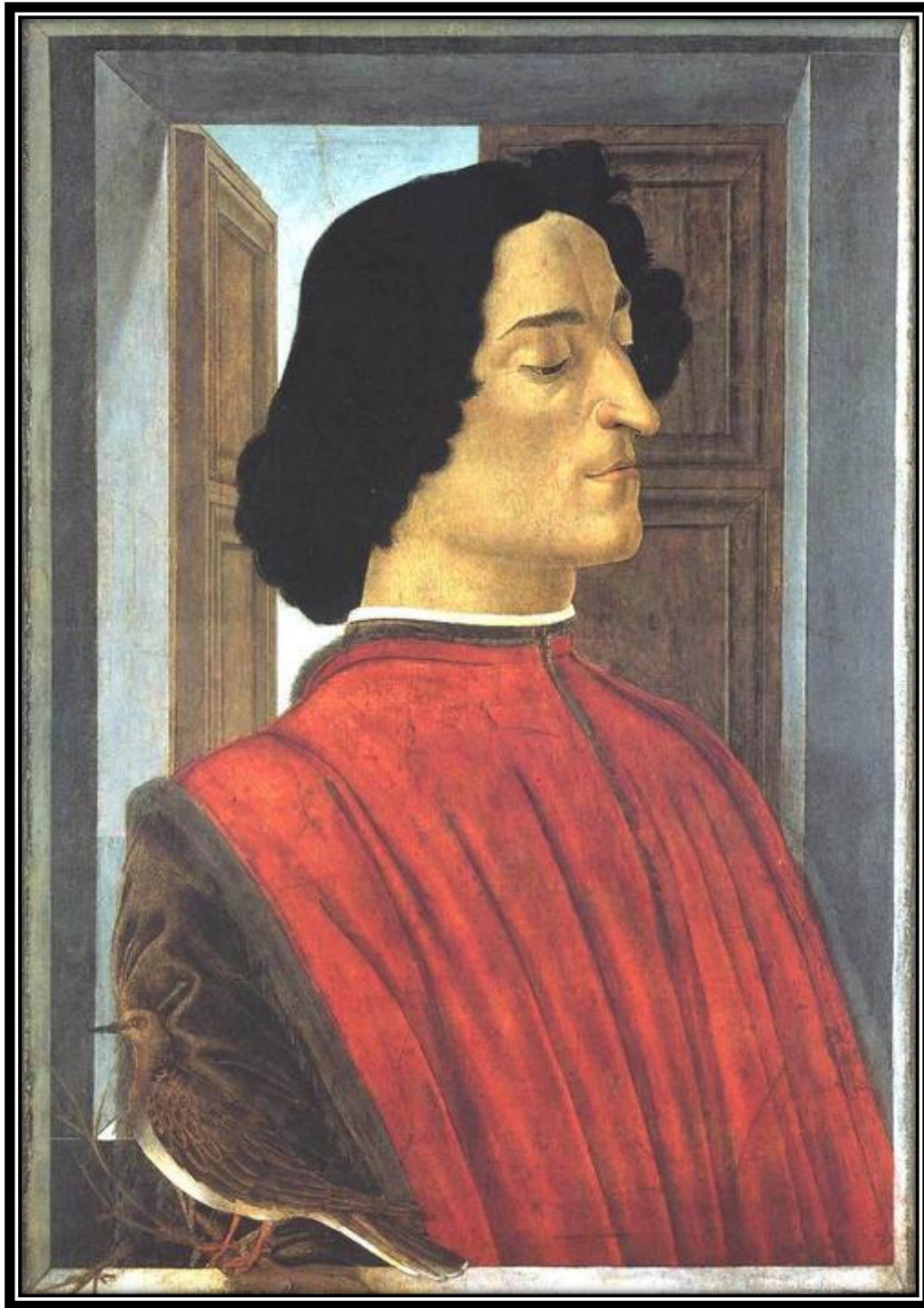
Figura 3: Sandro Botticelli, Ritratto di Giuliano de' Medici , 1478 - 1480. 90