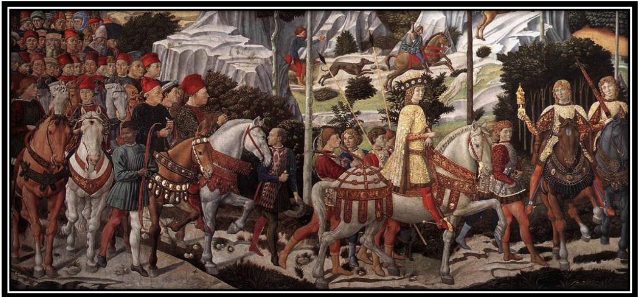
Figura 1: Benozzo Gozzoli, Il corteo dei Re Magi , 1459. 13

In modo da validare adeguatamente e capire la complessità psicologica e l'interdisciplinarietà di Lorenzo e Giuliano de' Medici, le quali hanno dato frutto ai loro ricchi contributi culturali a Firenze, bisogna in primo luogo essere a conoscenza dei fattori che hanno aperto la strada allo sviluppo intellettuale dei due personaggi, ovvero la base culturale che hanno ricevuto in famiglia, l'educazione, senza omettere le caratteristiche del periodo nel quale sono vissuti.