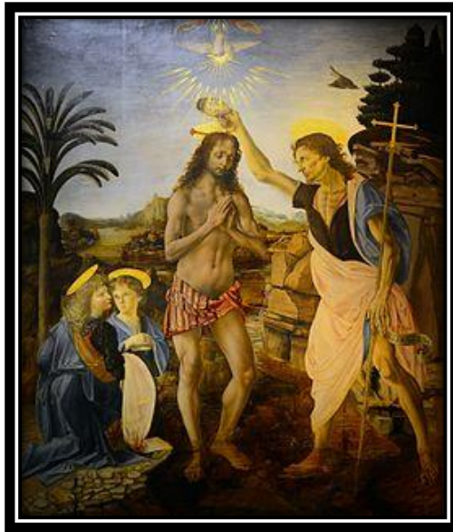
Figura 7: Andrea Verrocchio e Leonardo da Vinci, Battesimo di Cristo , 1472 - 1475.