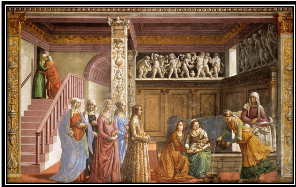
Figura 6: Domenico Ghirlandaio, Nascita della Vergine , 1486 - 1490.