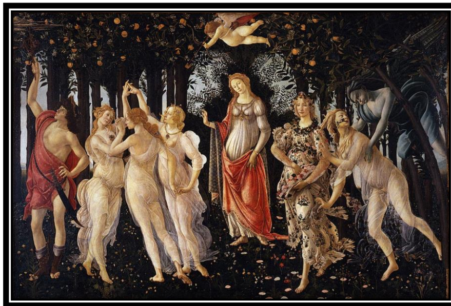
Figura 5: Sandro Botticelli, Primavera , 1477 - 1482.