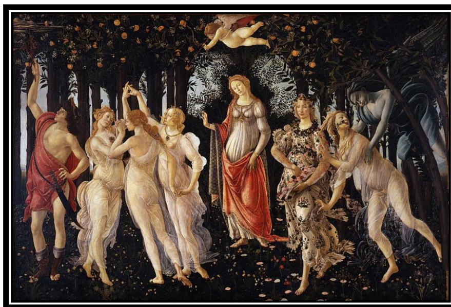
Figura 5: Sandro Botticelli, Primavera , 1477 - 1482.