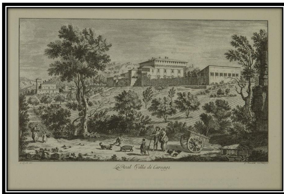
Figura 8: L'Accademia Platonica presso la Villa di Ficino, Careggi.