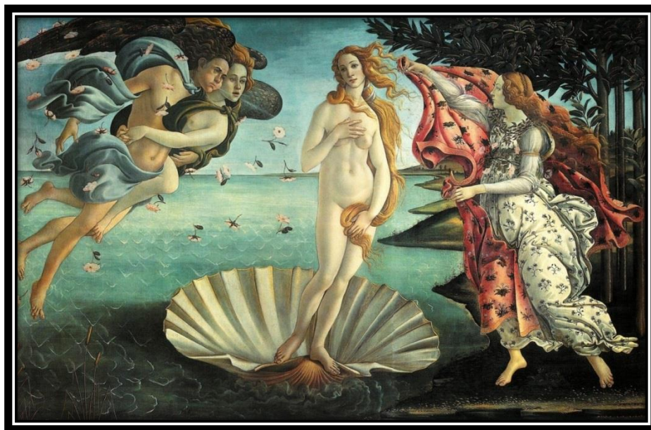
Figura 4: Sandro Botticelli, La nascita di Venere , 1482 - 1485.

gioia per la bellezza, la sua cultura classica e la sua ricerca dell'inottenibile. 103 Inoltre, nessuna delle opere di Botticelli eseguite per Lorenzo e Giuliano de' Medici è sopravvissuta, 104 il che rende le sue opere testimoni indispensabili del ruolo dei fratelli Medici nella cultura fiorentina.