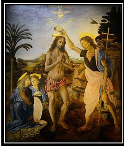
Figura 7: Andrea Verrocchio e Leonardo da Vinci, Battesimo di Cristo , 1472 - 1475.