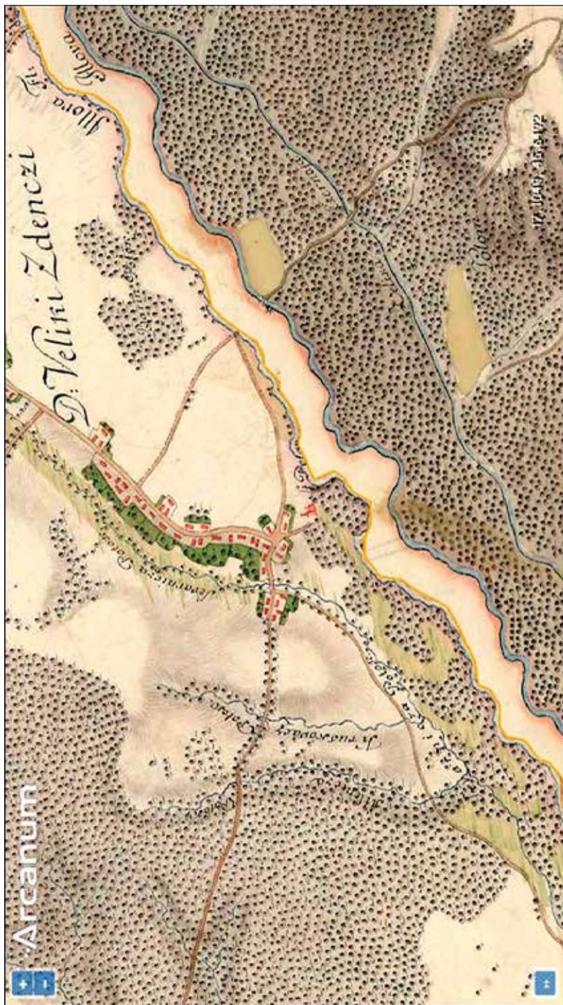
Slika 1. Veliki Zdenci s crkvom sv. Petra na jozefinskoj vojnoj karti