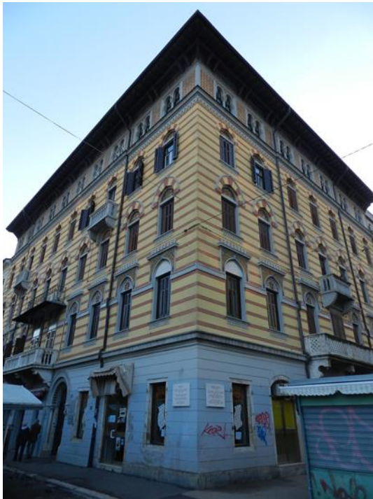
Fotografija 1: Turska kuća, Rijeka, 1906.