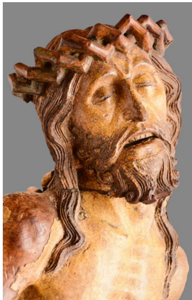
12. Leonardo Thanner, Krist , Museo del Territorio, San Daniele del Friuli, detalj

Leonardo Thanner, Christ , Museo del Territorio, San Daniele del Friuli, detail