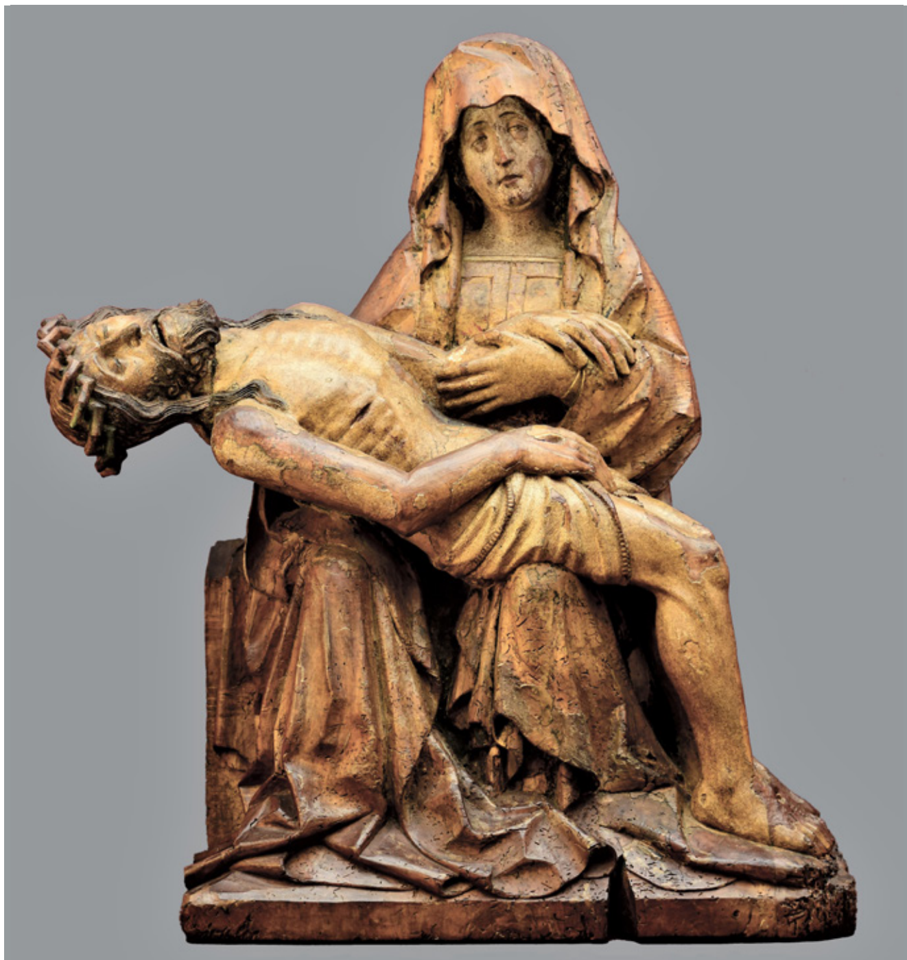
1. Leonardo Thanner, Pietà , Pomorski i povijesni muzej Hrvatskog primorja Rijeka, Rijeka

Leonardo Thanner, Pietà , Maritime and Historical Museum of the Croatian Littoral, Rijeka