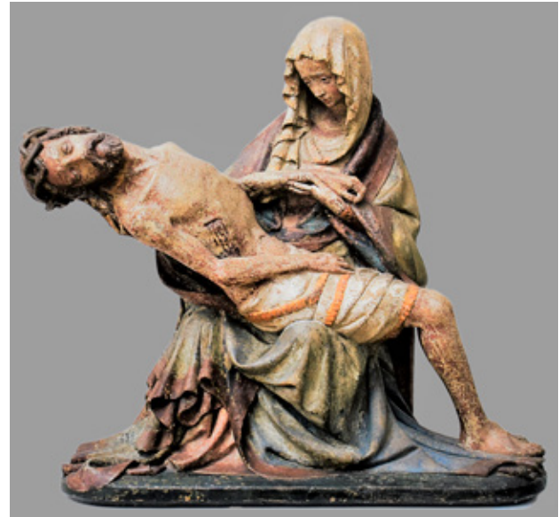
4. Pietà , Diözesanmuseum, Freising (izvor: LUDMILA KVAPILOVA /bilj. 37/, 172)

Pietà , Muzeum Narodowe w Warszawie, Warsaw