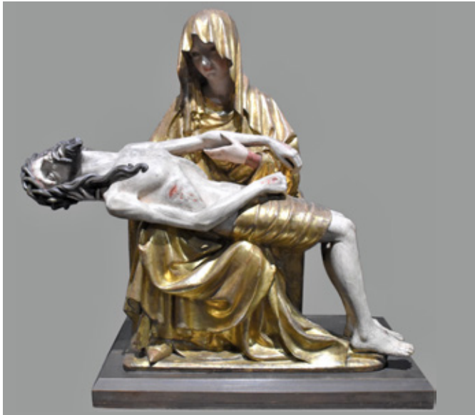
3. Pietà , Muzeum Narodowe w Warszawie, Varšava

Pietà , Muzeum Narodowe w Warszawie, Warsaw