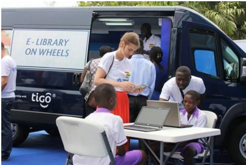
Slika 13. Pokretna knjižnica u Gani. 51