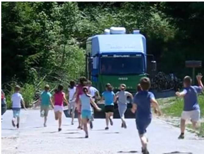
Slika 7. Djeca se vesele bibliobusu 36

Županijski bibliobus, uz moto Knjiga svima! Knjigom do svih! , obuhvaća područje u 12 općina i gradova tj. 33 naselja na 44 stajališta. 35