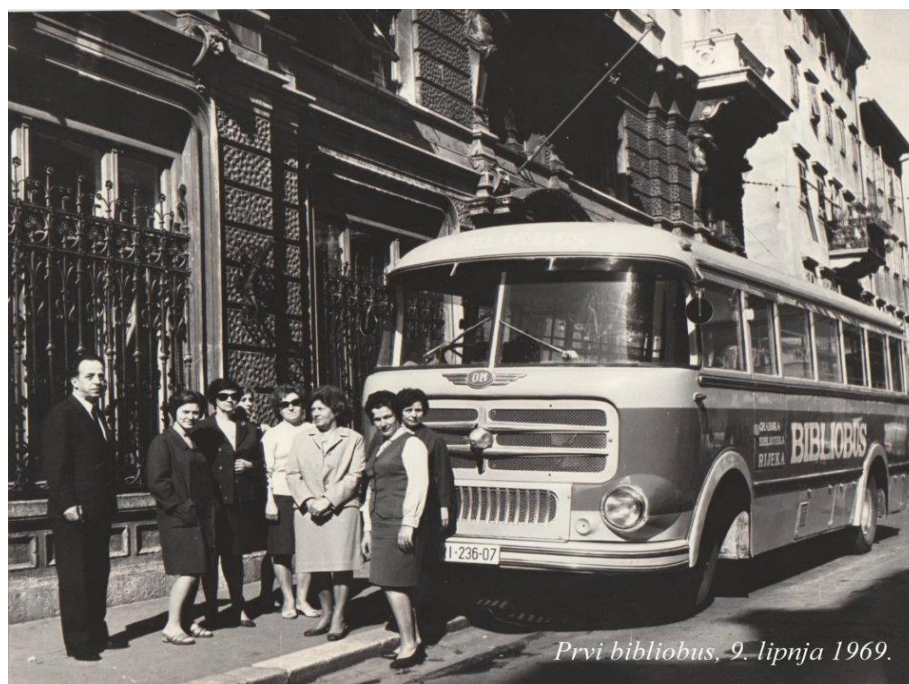
Slika 2. Bibliobus u Rijeci, 1969. 19

knjižnica smještenih u vozilu. 17 Zanimljivo je što se u riječkoj knjižnici, o potrebi uvođenja bibliobusne službe, govorilo godinu ranije, 1963., ali je zbog nedostatnih sredstava ista počela s radom tek šest godina kasnije. Godine 1969. svečano je promoviran bibliobus Gradske knjižnice Rijeka. Zapravo se radilo o autobusu preuređenom za pružanje knjižničnih usluga kao "prva pokretna knjižnica takve vrste u Hrvatskoj i Jugoslaviji..." 18