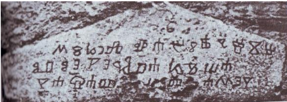
Slika 2. Preslika kamenoga natpisa na kući župana Mihela Fabijančića (preuzeto iz Vlahov 2015: 23).

Na kući koja je nekada pripadala županu Mihelu Fabijančiću nalazi se kameni natpis koji je poprilično dobro sačuvan i koji svjedoči o vlasniku kuće (Vlahov 2015: 23).