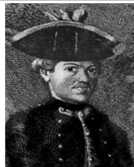
Slika 1. M. A. Reljković

Hrvatski književnik, vojnik, oficir i prosvjetitelj, Matija Antun Reljković, rodio se u Svinjaru (Davoru na Savi) 1732. godine. Završio je franjevačku školu u Cerniku, a nastavio školovanje u Ugarskoj. Bio je vojnik Gradiške, a kasnije Brodske regimente. Važan utjecaj na njegovo stvaralaštvo imao je Sedmogodišnji rat u Prusiji, u kojem je sudjelovao od 1756.-1763. godine. Bio je ratni zarobljenik u Frankfurtu, a kasnije je, kao vojni časnik, službovao u slavonskim mjestima. Službovao je u