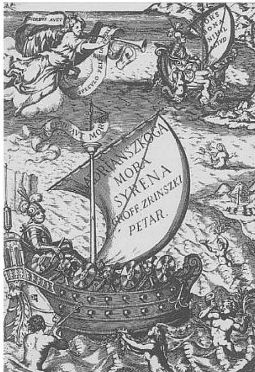
Slika 2. Naslovnica djela Adrijanskoga mora sirena