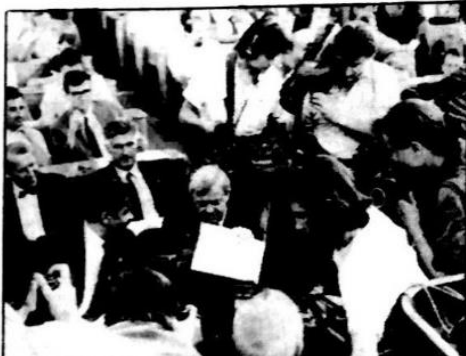
Sa sinoćnje svečane sjednice Skupštine Republike Slovenije – Milan Kučan i Ciril Zlobec na meti fotoreportera

„Samo ukoliko su Slovenci slobodni kao ljudi i kao narod, mogu dati svoj stvaralački doprinos i preuzeti svoj dio odgovornosti za demokraciju i mir u ovom dijelu svijeta“, rekao je Kučan. Prema njegovom mišljenju, nametnuto uređenje i nametnuti odnosi među narodima mogu voditi samo u ne-