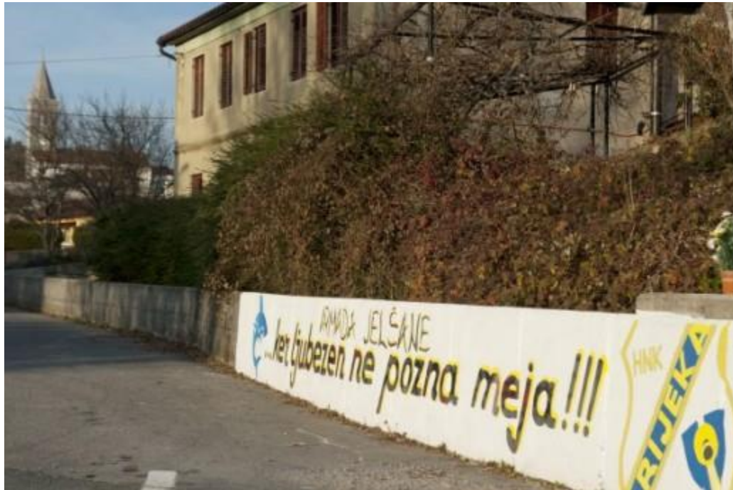
Slika 1: Grafit u Jelšanama : „Ker ljubezan ne pozna meja“

teško naći posao, odlazili su za poslom, firme koje su imale mogućnosti dale su im stanove. (A. M. 2007). 155