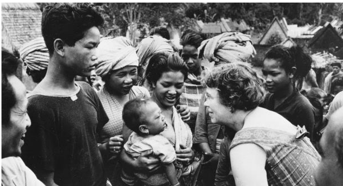
Margaret Mead na izletu, na otoku Bali.