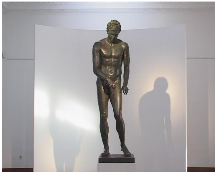
Slika 10. Hrvatski Apoksiomen

antička kuhinja, antički kulturni putovi. Gradonačelnik smatra kako je borba za povratak Apoksiomena na Lošinj doprinos sustavnom usmjeravanju Lošinja ka važnom položaju u hrvatskom kulturnom turizmu. 59 Zanimljivo je i što se sve jednom atrakcijom može osmisliti. Tako je osmišljena ponuda na temu Apoksiomena i antike s namjerom upoznavanja s kulturnom baštinom i antičkim naslijeđima Hrvatske i otoka Lošinja. Održavaju se brojne edukacije, događanja, radionice, i sve je na temu Apoksiomena i antike. 60