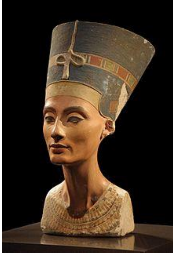
Slika 6. Bista kraljice Nefertiti u Neues muzeju u Berlinu