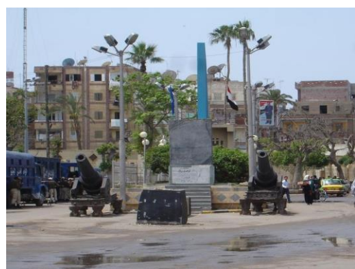
Slika 5. Kopija Rosetta ploče u Rashidu