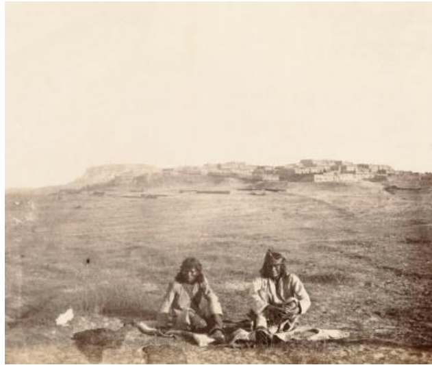
Slika 3. Zuni ljudi i grad Pueblo

prema Zuni ljudima, njihovoj tradiciji, vjerovanju. Zuni odlučuju. A kada se tako nešto omogući, kada se ne ide na neprijateljsku liniju, onda se događa i suradnja.