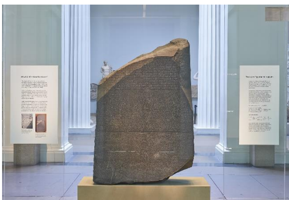
Slika 4. Rosetta kamen u Britanskom muzeju