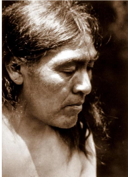
Slika 2. Ishi