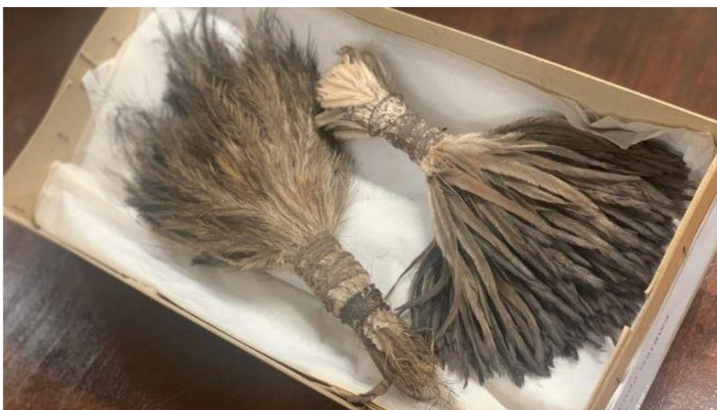
Slika 7. Predmet načinjen od emu perja, a nosio se oko struka kao pojas ili je služio kao ukras na glavi

druge strane, koji drže te predmete, suosjećajni sa zajednicama i ljudima koji te predmete traže nazad. To je jedan od ključnih uvjeta za repatriacijom. Često zapravo proces repatriacije i sam čin repatriacije ovisi o onome tko te predmete i drži, jer ako se netko iz muzeja bori za njihovo vraćanje i ako taj netko ima veliki utjecaj na ostale u muzeju veća je i šansa za željeni ishod, no ako nema nekoga tko je imalo zainteresiran za repatriaciju i za to koji značaj ti predmeti imaju za izvornu zajednicu, teško da će se išta i dogoditi, a predmeti će skupljati prašinu u skladištu, a rijetko će kada biti i prikazani javnosti, barem u slučaju Aboridžina Australije. Mora se razvijati svijest oko važnosti predmeta za izvornu zajednicu, ali i suosjećanje sa ljudima koji su prošli mnogo zala tokom povijesti. Važno je da muzeji komuniciraju sa zajednicama čije predmete drže, da ih se ne odbija čim je zahtjev poslan, te da otvoreno razgovaraju i slušaju što im te zajednice žele reći, a ne samo zauzimati obrambeni stav bez da se sa razumijevanjem sasluša ono što domoroci imaju za reći. Još mogu shvatiti onaj skriveni, sebični razlog zašto muzeji žele zadržati vrijedne artefakte (novac) ali nikako ne mogu razumjeti što muzejima znači držati predmete koji nisu nikada došli na javnu izložbu, već stoje negdje u skladištu, zaboravljeni, ali ne i od domorodačkih zajednica. Nadam se da će ovakvi primjeri, kao što je Manchester muzej, u budućnosti biti sve češći.