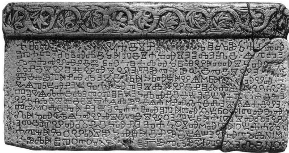
Slika 9. Bašćanska ploča

je dio teksta u kojem govori o nezadovoljstvu Jurandvoraca, a smatrao je kako je nemir namjerno „ubačen“ među stanovništvom. Kazao je kako je čuvanje Bašćanske ploče u Jurandvoru zapravo bilo štetno i samo je ubrzalo njeno propadanje. No, Jurandvorci su bili oštri u kritikama oko toga što se važna Bašćanska ploča daje Zagrebu, te su čak, kako sam ranije navela, neovlašteno uzeli originalnu ploču i ukopali je u pod, a plan je bio da ju zabetoniraju, međutim prije nego se to dogodilo vlasti su ušle u trag krađi. Osim što su Jurandvorci smatrali da im se oduzima njihova baština, isto tako su se bojali da će broj turista opadati, no prema tvrdnji Dragutina Kniewalda mještani su ipak uvidjeli da se to ne događa (Kniewald, 1934).