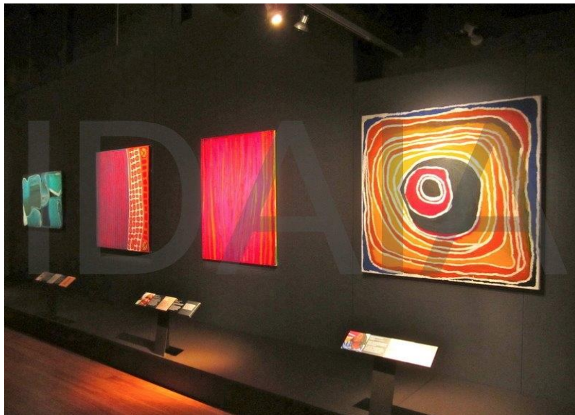
Slika 8. Izložba „ Yiwarra Kuju: The Canning Stock Route “

zajednica i muzeja, i dolazi do konflikta. Naravno da je repatrijacija važna za izvorne zajednice, međutim ako dođe do suradnje i ako muzej doista želi prikazati tu zajednicu ili narod onakvom kakvom ona zaista jest, i ako se domoroci sa time slažu, tu dolazi do napretka. Treba biti obziran prema izvornim zajednicama, možda neke od njih neće htjeti podijeliti sve sa javnošću, ali mnogo zajednica zapravo želi da ih se čuje i da mi njih vidimo u svijetlu u kojem oni sebe vide. Te izvorne zajednice ne žele biti pogrešno reprezentirane od muzeja, jer se često ne istražuje povijest dovoljno „duboko“ kako bi se stvorila njihova cjelokupna slika, nego se samo postavljaju razni artefakti sa kratkim opisom i bez opširnog konteksta. Ono što te zajednice traže nije uvijek repatrijacija, već ono što žele jest da ih se sasluša i da one „napišu“ povijest u muzeju u kojem se njihova povijest već nepotpuna drži. Dapače, mnogo bi zajednica i htjelo da se u muzejima može učiti o njima, ali ono što učimo o tim zajednicama mora biti ispričano sa njihove strane. Kroz suradnju sa zajednicama stvara se kompleksna slika njihove povijesti, jer nije povijest jednodimenzionalna već je ona skup raznih odnosa, veza i događaja koje će samo znati oni o kojima ta povijest jest.