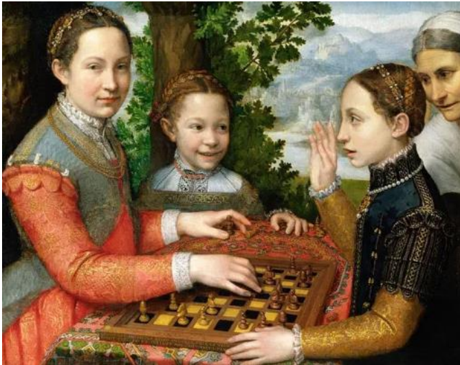
Slika 6. Sofonisba Anguissola, Partija šaha , 1555, 72 x 97 cm, Nacionalni muzej, Poznan

slikajući portrete kraljevske obitelji. Bila je dio dvora, a kao pripadnica istog ima stalni izvor primanja što joj omogućuje financijsku neovisnost. Emancipacija je vidljiva i u promjeni dotadašnjeg načina prikaza žena. Najjasniji primjer koji podupire ovu tvrdnju jest slika Partija šaha (vidi Slika 6 ). Na slici Sofonisba prikazuje vlastite sestre kako pristupaju umnoj igri, odnosno šahu 27 , a ne prikazuje ih uz tradicionalne „ženske“ stvari poput molitvenika, kućnih ljubimaca ili pak šivanja.