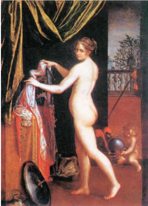
Slika 8. Lavinia Fontana, Minerva se oblači , 1613., Galerija Borghese, Rim

Zaključuje se kako je društvo ipak prepoznalo koliko je Lavinia vješta u prikazu tijela, stoga su pretpostavili da isto nije moglo biti učinjeno bez prethodnog promatranja nage žene zanemarujući činjenicu kako je ona sama upravo žena.