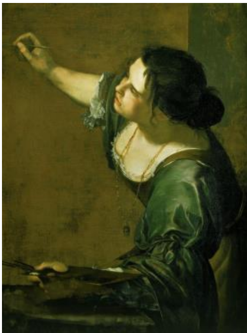
Slika 10. Artemisia Gentileschi, Autoportret kao alegorija slikarstva, 1639., 96.5 x 73.7 cm, Royal collection, London