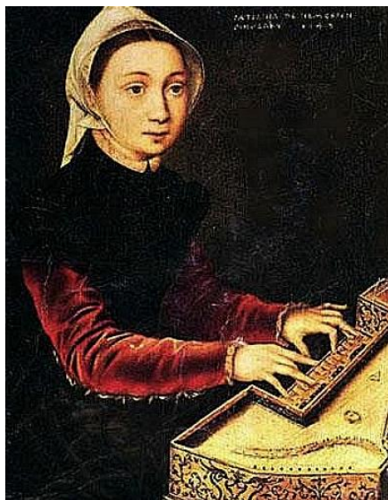
Slika 4. Caterina van Hemessen, Djevojka svira virginal, 1548., 30.5 x 24 cm, Wallraf-Richartz-Museum

naznake prostora, osim u autoportretu i portretu sestre. Djevojka svira virginal (vidi Slika 4 ) portret je na kojem je prikazala svoju sestru kako svira.