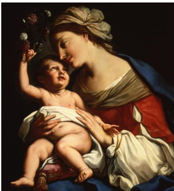
Slika 15. Elisabetta Sirani, Bogorodica s Djetetom , 1633., 86 x 70 cm, National Museum of Women in Arts, Washington D. C.

Društvu koje žene prikazuje kao inferiorni spol dokazuje kako umjetnost temelji na znanju koje je stekla čitajući, stoga se u njezinom opusu razaznaju prikazi povijesnih heroína. Prema tome, inspirirana Shakespeareovom dramom Julije Cezar , Sirani slika Portiu (vidi Slika 16 ) na kojoj prikazuje Portiu koja se simbolički ranjava u obrani od Rimskog Carstva. 45