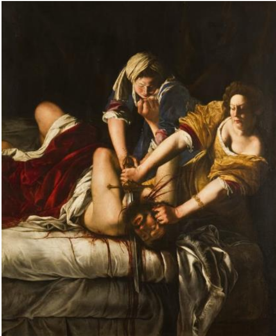
Artemisia Gentileschi, Judita ubija Holoferna , 1620., 146 x 108 cm, Galerija Uffizi, Firenca

Jedna od umjetnica kod koje se želja za emancipacijom snažno iščitava na djelima jest Artemisia Gentileschi (1593. – 1652.). Na teatralan i često nasilan način prikazuje motive i osobe na slikama što je vidljivo i na djelu Judita ubija Holoferna (vidi Slika 9 ). Scenu povezuje s vlastitim životom prikazujući ženu, odnosno Juditu koja je nadvladala nasilnika Holoferna.