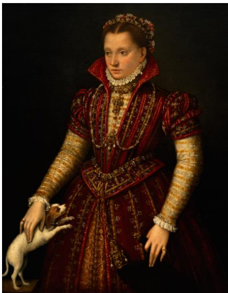
Slika 7. Lavinia Fontana, Portret plemkinje , 1580., 115 x 90 cm, National Museum of Women in the Arts, New York