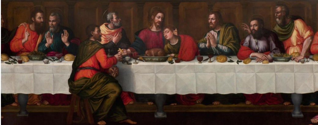
Slika 2. Plautilla Nelli, Posljednja večera , 1560., 7 x 2 m, Santa Maria Novella, Firenca

nemogućnosti učenja anatomije na drugim osobama, Nelli koristi skice i djela muških kolega. Štoviše, za slikanje Posljednje večere (vidi Slika 2 ) kao primjer koristi fresku iste teme umjetnika Leonarda da Vincija. Nelli u svom prikazu ipak odlazi korak dalje te prikazuje ikonografske elemente koji proizlaze iz njezinih shvaćanja i interesa. Prema tome, uz standardne prikaze kruha i vina, prikazuje i salatu, sol i janje. 20