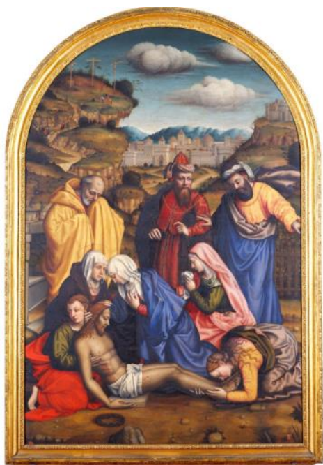
Slika 3. Plautilla Nelli, Oplakivanje Krista , 1550., 288 x 192 cm, Museo Nazionale di San Marco

Norme su dio života Plautille Nelli koja zbog života u samostanu ne nailazi na neodobravanje društva, no u prikazima je inovativna u tome što uvodi ikonografske elemente koji se ne prepoznaju na djelima njezinih muških kolega. Ostvarenom karijerom u pretežno muškoj klimi profesije pokazuje kako se ipak poštivanjem normi i manjim intervencijama na temelju vlastitih shvaćanja u društvu 16. stoljeća emancipira u uspješnu umjetnicu.