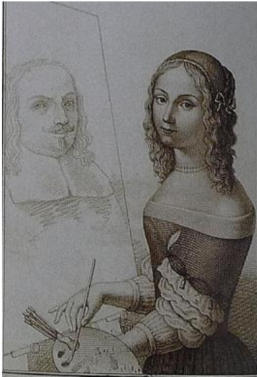
Slika 14. Luigi Martelli, 19. st. prema Elisabetta Sirani, Autoportret na kojem slika oca , Hercolani galerija, Bologna

gotovo 200 slika. 44 Na Autoportretu na kojem slika oca (vidi Slika 14 ) zamjećuju se kist, platno i paleta čime ukazuje na svoju profesiju i ulogu koju kao pojedinac zauzima u društvu.