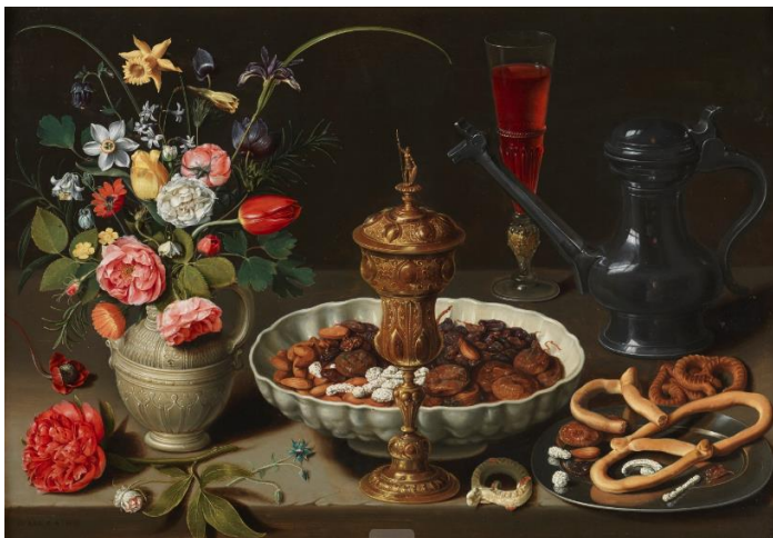
Slika 11. Clara Peeters, Mrtva priroda s cvijećem, kaležom, sušenim voćem, slatkim proizvodima, vinom i vrčem, 1611., 52 x 73 cm, Museo del Prado, Madrid

U razdoblju 17. stoljeća na području sjeverne Europe za žene umjetnice nije bilo uobičajeno slikanje autoportreta. Peeters pronalazi način kako će označiti da djelo pripada njoj, a samim time se istaknuti u društvu, odnosno stvoriti javnu osobu. Slučaj Clare Peeters karakterističan je u tome što je sudjelovala u kreiranju normi slikanja i ikonografije koja će se pojavljivati na slikama mrtve prirode. Tu je vidljiva i njezina želja za emancipacijom koja vodi stvaralaštvo u smjeru inovacija i primjene istih. Istome svjedoči i prikazivanje autoportreta kao dijela mrtve prirode što ukazuje kako koristi sliku kao medij kojim će se promovirati u društvu.