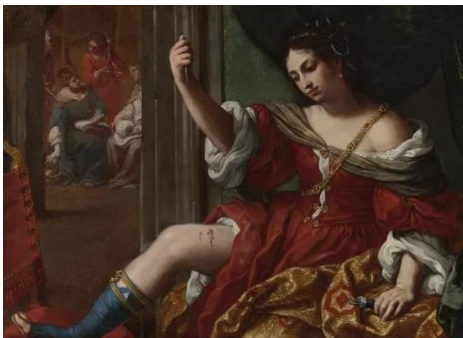
Slika 16. Elisabetta Sirani, Porcia , 1664., 101 x 138 cm, privatna kolekcija

Društvu koje žene prikazuje kao inferiorni spol dokazuje kako umjetnost temelji na znanju koje je stekla čitajući, stoga se u njezinom opusu razaznaju prikazi povijesnih heroína. Prema tome, inspirirana Shakespeareovom dramom Julije Cezar , Sirani slika Portiu (vidi Slika 16 ) na kojoj prikazuje Portiu koja se simbolički ranjava u obrani od Rimskog Carstva. 45