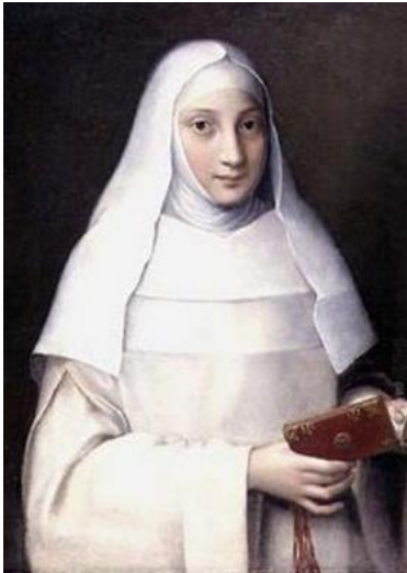
Slika 5. Sofonisba Anguissola, Portret časne sestre , 1551., 169 x 53 cm, Southampton City Art Gallery, Southampton

Sofonisba Anguissola (1535. – 1625.) kao i mnoge druge proslavljene umjetnice 16. i 17. stoljeća uživa očevu potporu. Rođena je u obitelji koja je poticala obrazovanje žena što je vidljivo u težnjama njezinog oca koji ju šalje umjetniku Bernardinu Campiju kako bi se izučila slikanju. 25 Prema tome, Campi Sofonisbu usmjerava aktualnom manirističkom stilu. Kasnije odlazi Bernardinu Gattiju koji razvija njezin interes za genre scene, potiče inovativni pristup portretima i vizualnom stvaranju priča. Kao najranije djelo zabilježen je Portret časne sestre (vidi Slika 5 ) koji nastaje u duhu lombardske tradicije što je vidljivo u interesu za fizionomiju. Pokazuje kako slijedi norme koje postavlja tadašnja umjetnička scena.