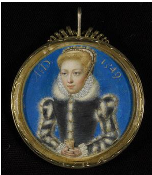
Slika 1. Levina Teerlinc, Portret djevojke , 1549., dijametar 4.8 cm, Victoria and Albert museum, London