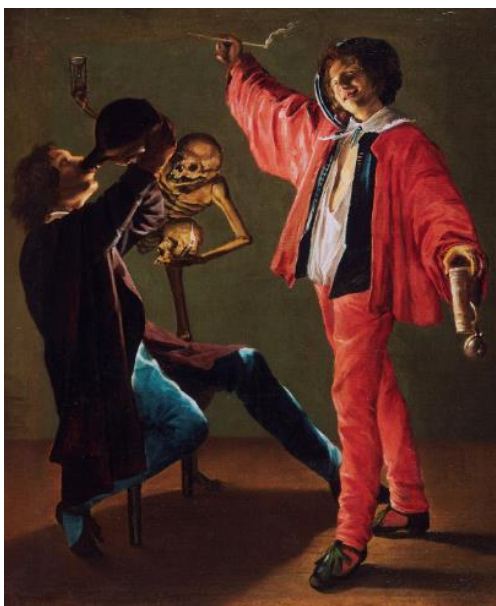
Slika 13. Judith Leyster, Posljednja kap , 1639., 89 x 73.7 cm, Philadelphia Museum of Art, Philadelphia

Zaključuje se kako Judith Leyster slijedi norme u načinu življenja i uvažavanjem slikarske tradicije, primjerice u vidu slikanja genre scena. Emancipacija bi se u njezinom slučaju mogla objasniti novinama koje uvodi na slike. Želi dokazati da je sposobna kao i njezini muški kolege, što joj uspijeva te izgrađuje uspješnu karijeru koja rezultira emancipacijom nje kao umjetnice i žene u društvu 17. stoljeća.