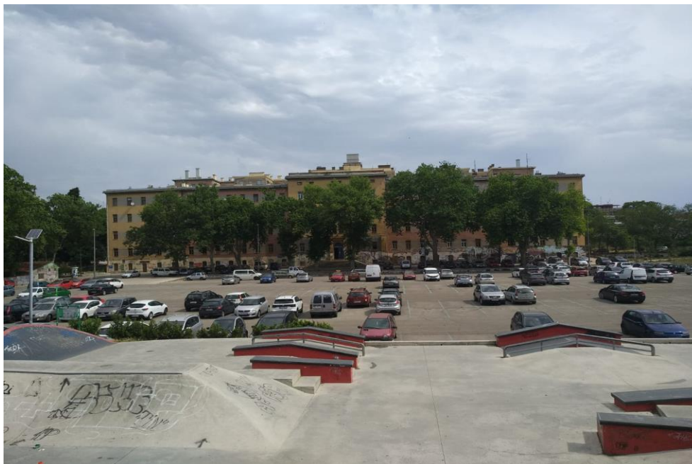
Slika 10. Skate park, parking i zgrada Društvenog centra Rojc, Fotografirala autorica, 2020.

zapuštene prostore na način koji će biti od koristi građanima, interes saveza udruga i udruga usmjeren je prema osiguravanju adekvatnih prostora za upotrebu i stabilnih uvjeta za realizaciju njihovih programa, a interes građana bi trebao biti zadovoljavanje svojih kulturnih, umjetničkih i društvenih potreba“. Tako je u slučaju Rojca, Grad Pula dao prostorni resurs i sredstva za upravljanje i gospodarenje prostorom, a Savez udruga će brinuti o održavanju zgrade, uspostavljanju izravnog kontakta sa zajednicom, koordinirati korištenje prostora i opreme i primjenjivati kriterije za dodjelu prostora. Uključivanjem korisnika u upravljanje osigurat će se veća razina angažmana te će zbog 'osjećaja vlasništva' odgovornije postupati s prostorom. S druge strane, smanjit će se operativni pritisak na gradsku upravu. Strateško upravljanje omogućit će stabilan razvoj i raznoliko financiranje kao naprimjer: „moći će se učinkovito organizirati uslužne djelatnosti kojima će se smanjiti troškovi programa i omogućiti dodatni prihodi za održavanje“ (Boljunčić Gracin et.al, 2016, 45). Projekt „Otvorena platforma Rojc“ bitno će doprinijeti prepoznatljivosti grada. Pula će tako institucionalizacijom partnerstva s civilnim sektorom biti prepoznata kao jedan od rijetkih gradova koji radi na osnaživanju intersektorske suradnje. Društveni centar Rojc imat će prepoznatljiv identitet kao mjesto okupljanja civilnih udruga koje promoviraju europske principe i vrijednosti.