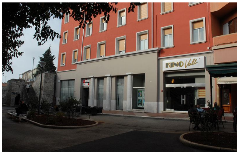
Slika 6. Zgrada „Kino Valli“