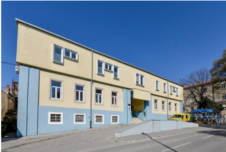
Slika 4. Zgrada „Dječjeg kreativnog centra Pula“ (bivši Pionirski dom)

godine, a do tada je Upravni odjel za kulturu osigurao privremene alternativne lokacije za sve korisnike.