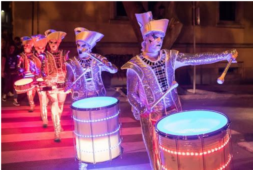
Slika 9. Performans svjetlosnih bubnjara, britanski Spark! Led Drummers, Fotogralirala autorica, 2017.

na 100000 kn godišnje, no zbog razno raznih zakona novac se preusmjerio na Turističku zajednicu od koje sada dobivamo novce i ostalu podršku. 70 posto Visualia festivala sponzorirano je iz gradskog proračuna, a ostatak financiramo sami iz vlastitih prihoda što je veoma teško jer nemamo dodatnih prihoda koje možemo ostvariti prilikom odvijanja samog festivala, npr. nemamo ulaznice, nemamo suvenire, ne prodajemo hranu ili piće kao na ostalim festivalima (Marko Bolković, razgovor, svibanj, 2020).