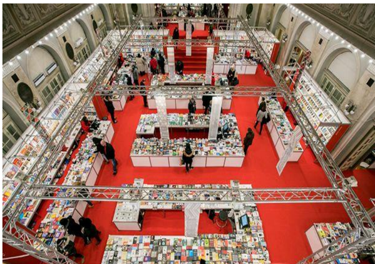
Slika 5. Dom hrvatskih branitelja za vrijeme trajanja „Sa(n)jam knjige“ u Puli, Manuel Angelini, 2017.

„Hand made fest“ na kojem razni umjetnici, kreativci, obrtnici, izlažu svoje rukotvorine i radove. Udruga Razvoj organizira ovaj festival ručnih izrada s ciljem očuvanja i isticanja vrijednosti ručno izrađenih proizvoda ili usluga. Specifičnost ovog festivala jest da izlagači osim promocije i prodaje svojih proizvoda, također na licu mjesta izrađuju unikatne stvari za posjetitelje gdje se ističe njihova volja i kreativnost.