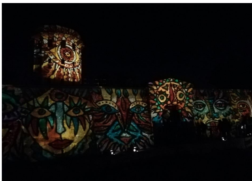
Slika 8. Svjetlosna instalacija na mletačkoj utvrđi Kaštel, Fotografirala autorica, 2018.

Kada je riječ o samom festivalu, načinu financiranja i značaju za kulturnu ponudu Pule, Bolković govori o sljedećem: