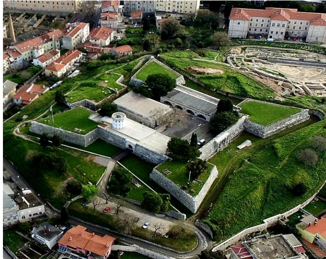
Slika 2. Mletačka utvrda Kaštel, Turistička zajednica grada Pule