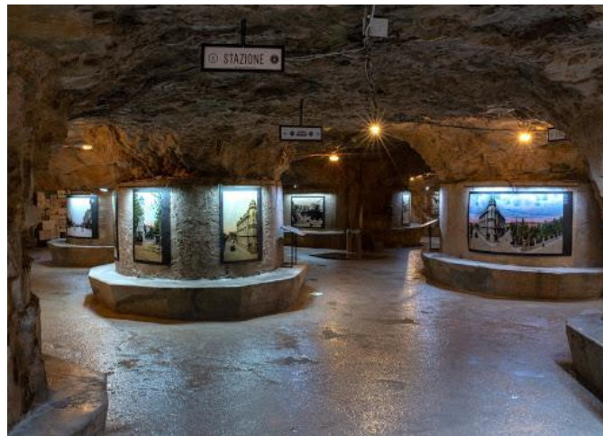
Slika 3. Izložba „Pulski električni tramvaj“ u tunelima Zerostrasse, Glas Istre, 2019.

Osim povijesnih, muzejskih atrakcija, u otvorenom prostoru unutar Kaštela tijekom ljeta održavaju se mnoge kulturne manifestacije, predstave i koncerti. Pod imenom „Ljeta na Kaštelu“ utvrda svake godine ugošćuje mnoge izvođače i glazbene grupe, pa su tako i u 2019. godini koncert održali glazbenici poput: Vanne, Queen Real Tribute benda, TBF-a i Hladnog piva. Svoje predstave na Kaštelu rado izvodi i ekipa iz Istarskog narodnog kazališta, a po prvi put lani je organiziran i Festival smijeha uz tri humoristične predstave: „Dekorater“, „Pod hitno na hitnu“ i „Pokopaj me nježno“ 18 .