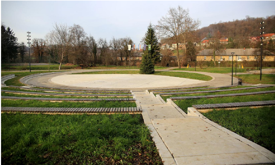
Slika 5. Amfiteatar u Dugoj Resi (URL 5)

koji se obilježava za Dan Grada pa do „Adventa na Mrežnici“, a tijekom zimskih mjeseca amfiteatar se pretvara u klizalište u kojem djeca bezbrižno uživaju tijekom zimskih mjeseca.