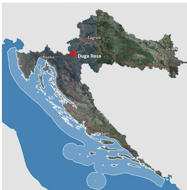
Slika 1. Duga Resa na karti Reublike Hrvatske (URL 1)

Duga Resa je smještena u zapadnom dijelu središnje Hrvatske, desetak kilometara jugozapadno od Karlovca te geografski pripada Karlovačkoj županiji 1 . Prostor Duge Rese obuhvaća 58 km 2 i u njemu prema podacima popisa stanovništva iz 2011. godine živi, uključujući i okolna naselja 2 , 11.180 stanovnika.