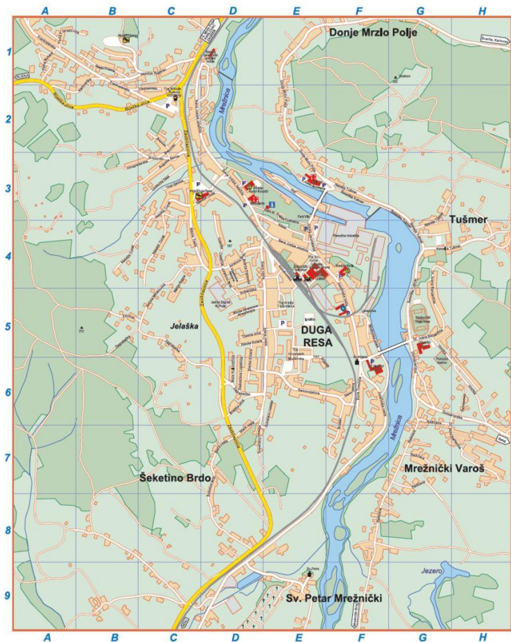
Slika 2. Plan grada Duge Rese i njezine okolice (URL 2)

Iako se ne zna koliko je Duga Resa stara, ovaj kraj sadrži arheološke nalaze naseljenosti još od prapovijesnoga doba. Naime, arheološkim iskopavanjima istočno od grada Duge Rese utvrđeno je da se ovdje živjelo u kasnom brončanom i početkom željeznoga doba, odnosno u posljednjim stoljećima 2. i počecima 1. tisućljeća prije Krista. Ono što se pouzdano može reći jest to da su ovo područje nastanjivali Rimljani što i potvrđuju tragovi 3 iz tih vremena, a pronađeni su na lokalitetu Sveti Petar, naselju nedaleko grada Duge Rese (Šišler 2004: 567).