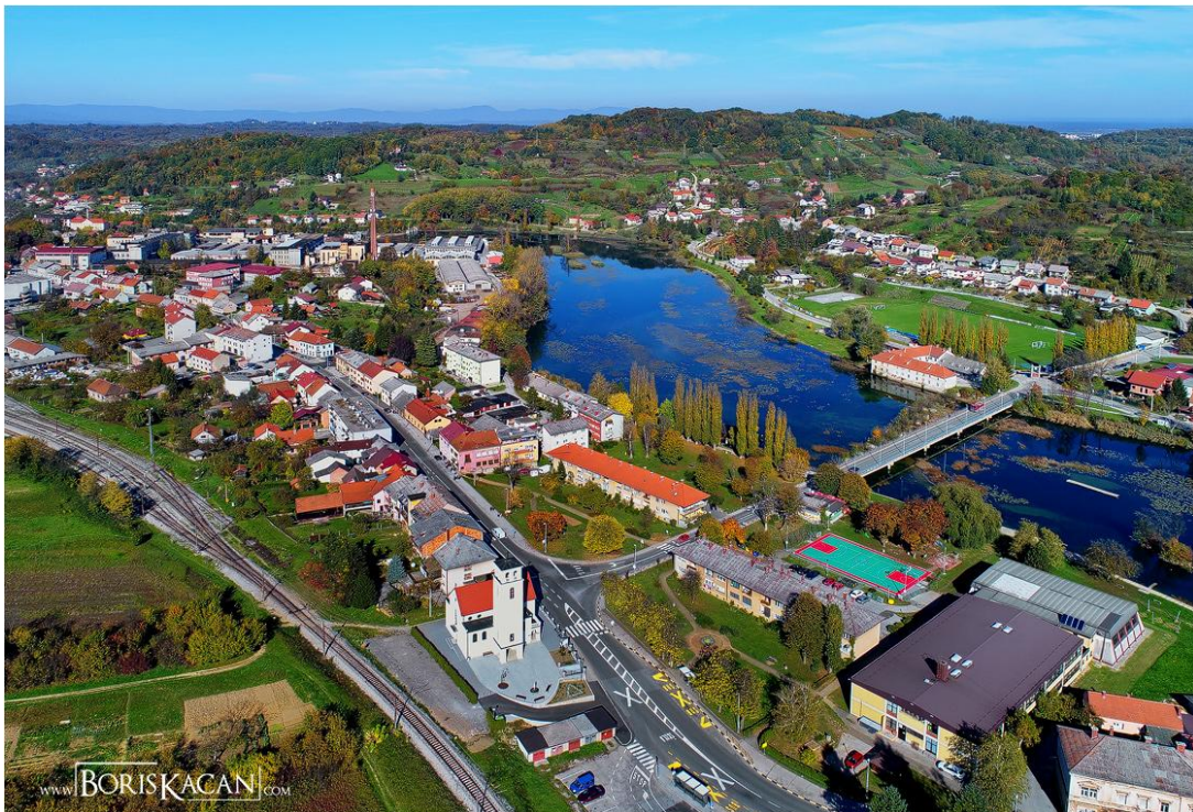
Slika 4. Dio Duge Rese fotografiran iz zraka (URL 4)

Nažalost, tijekom zadnjih tridesetak godina mještani Duge Rese svjedočili su drastičnom „izumiranju“ Pamučne industrije „Duga Resa“ te se danas neki njezini dijelovi nalaze u derutnom stanju, a stanovnicima ostaje samo prisjećanje na neka prošla vremena kada je tvornica radila punom parom i zapošljavala nekoliko tisuća radnika. Danas Duga Resa slovi kao miran gradić te je popularna turistička destinacija, naročito ljubiteljima prirode. Osim prekrasne rijeke Mrežnice, Duga Resa nudi mnoge druge mogućnosti uživanja u prirodi, poput planinarenja, raftinga, biciklističkih staza, šetnica.