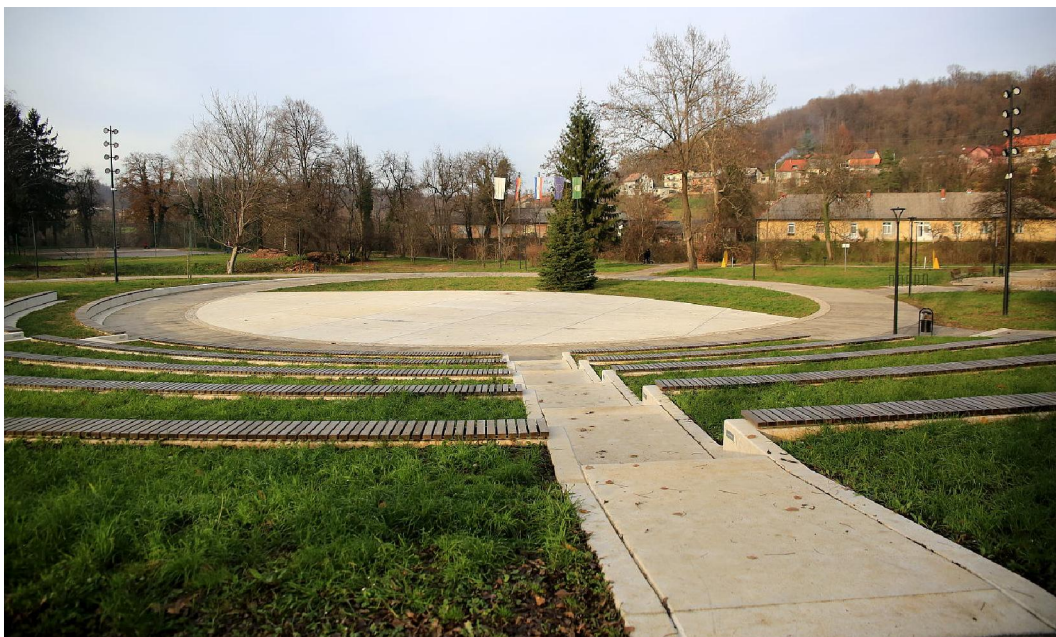
Slika 5. Amfiteatar u Dugoj Resi (URL 5)

koji se obilježava za Dan Grada pa do „Adventa na Mrežnici“, a tijekom zimskih mjeseca amfiteatar se pretvara u klizalište u kojem djeca bezbrižno uživaju tijekom zimskih mjeseca.