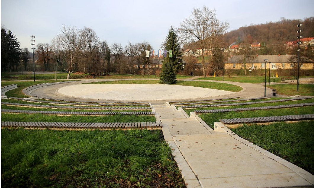
Slika 5. Amfiteatar u Dugoj Resi (URL 5)

koji se obilježava za Dan Grada pa do „Adventa na Mrežnici“, a tijekom zimskih mjeseca amfiteatar se pretvara u klizalište u kojem djeca bezbrižno uživaju tijekom zimskih mjeseca.