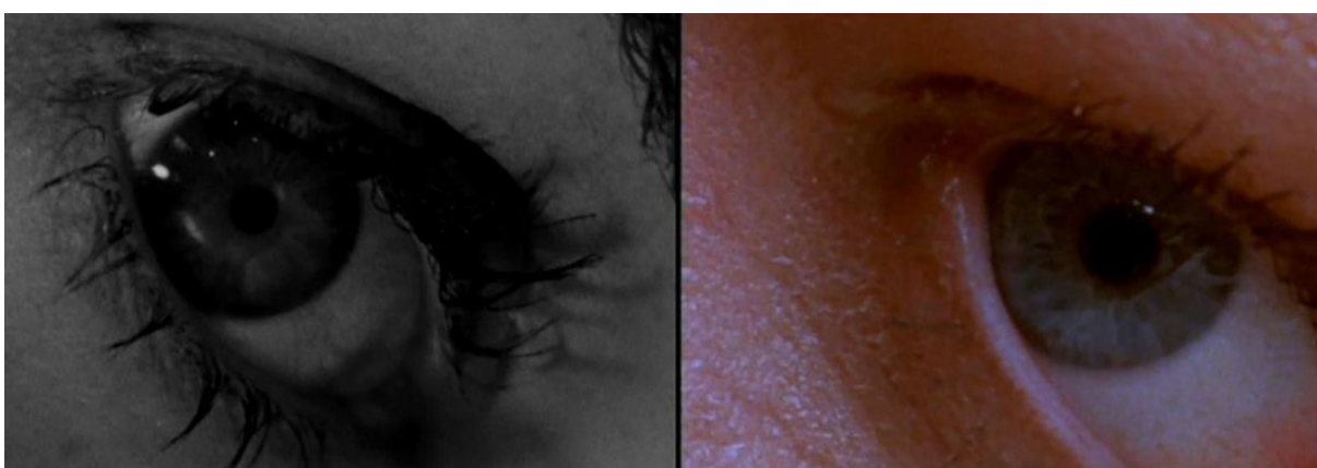
Slika 10. Kadar iz Psycho (1960.) / kadar iz Psycho (1998.)