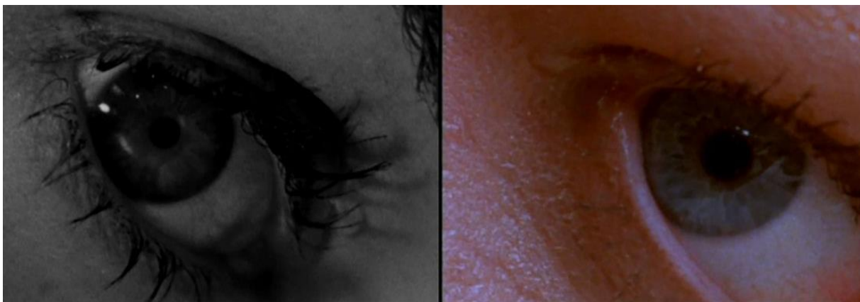
Slika 10. Kadar iz Psycho (1960.) / kadar iz Psycho (1998.)