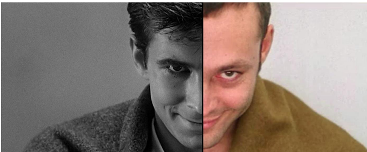
Slika 9. Anthony Perkins kao Norman Bates (1960.)