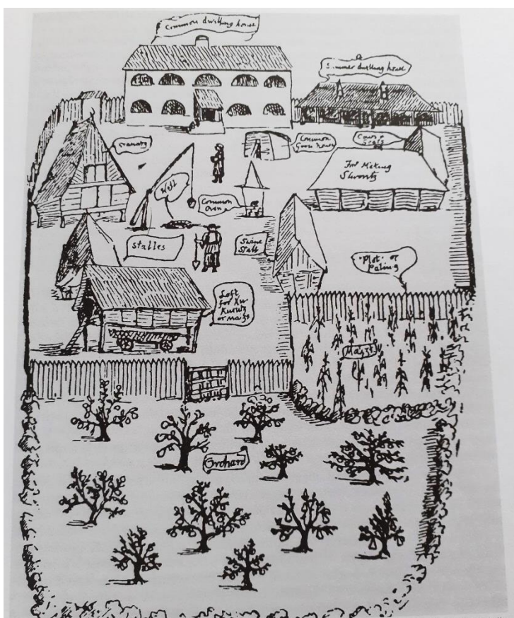
Slika 2. Gospodarstvo jedne kućne zadruge prema nacrtu A. J. Evansa (1875.) 38

Kućna zadruga je zajednica članova jedne porodice koji obitavaju u jednoj kući pod istim prezimenom. Članove zadruge čine starješina sa svojim starim roditeljima, suprugom, djecom, tj. sinovima te njihovim ženama i potomcima. 37