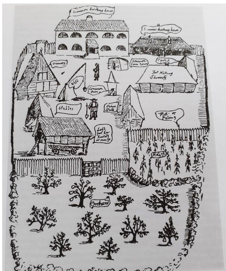
Slika 2. Gospodarstvo jedne kućne zadruge prema nacrtu A. J. Evansa (1875.) 38

Kućna zadruga je zajednica članova jedne porodice koji obitavaju u jednoj kući pod istim prezimenom. Članove zadruge čine starješina sa svojim starim roditeljima, suprugom, djecom, tj. sinovima te njihovim ženama i potomcima. 37