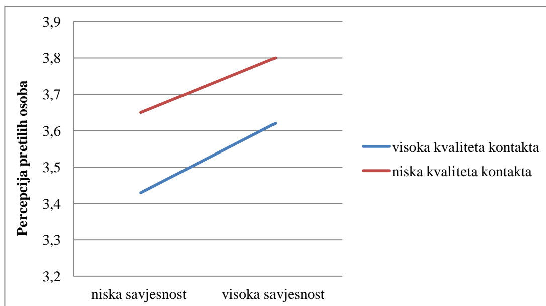
Slika 2. Interakcija savjesnosti i procjene kvalitete kontakta na percepciju pretilih osoba

Na Slici 2. prikazana je interakcija između savjesnosti i procjene kvalitete kontakta na percepciju pretilih osoba.