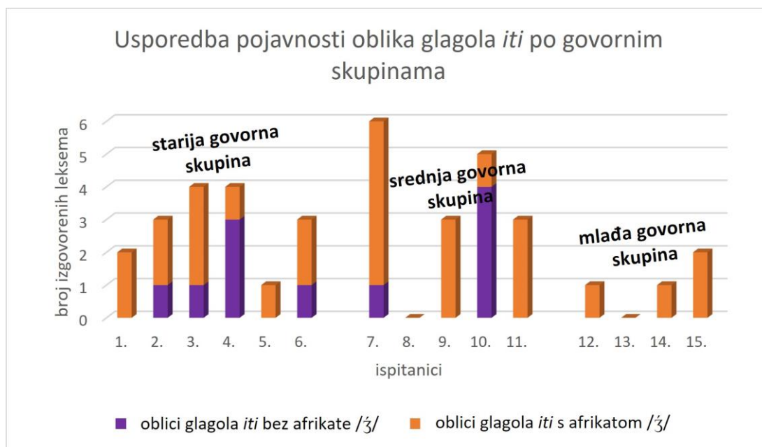
Grafikon 1. Usporedba pojavnosti oblika glagola *iti po govornim skupinama

Iz grafikona se može iščitati kako su oblici glagola iti bez afrikate /ʒ/ čuvaju u starijoj i srednjoj govornoj skupini iako je i ova značajka sklona gubljenju. Iako je potvrđena u mlađoj govornoj skupini, govornici je ovjeravaju u manjoj mjeri nego u ostalim dvjema skupinama.