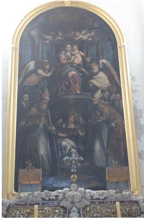
Slika 12. Bogorodica s Djetetom, sv. Gaudencijem i sv. Nikolom s donatorima, Andrea Vicentino, druga polovica 16. st., župna crkva Uznesenja Blažene Djevice Marije, Osor, Cres

Oltarna pala nalazi se na glavnom oltaru u exkatedrali Uznesenja Blažene Djevice Marije u Osoru. Palu je oslikao Andrea Vicentino u drugoj polovici 16. stoljeća. 66