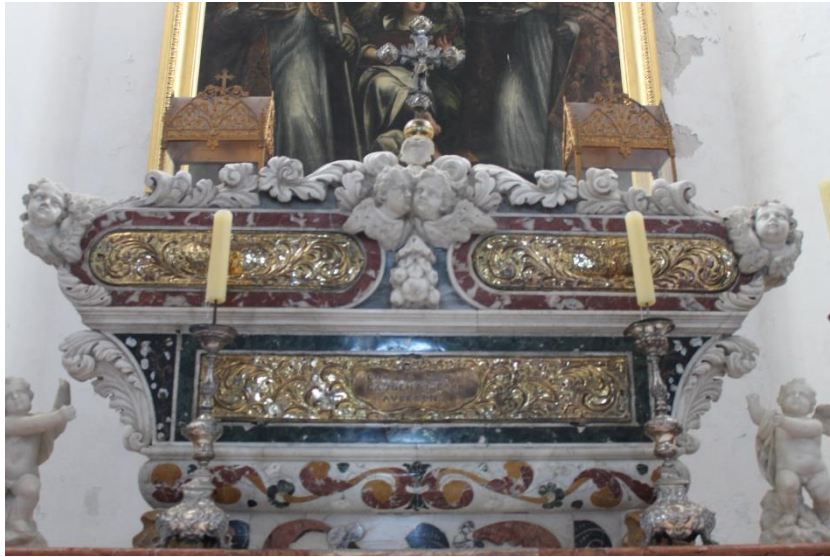
Foto 2. Sarkofag sv. Gaudencija, župna crkva Uznesenja Blažene Djevice Marije, Osor, Cres

Tijelo sv. Gaudencija čuva se u mramornom sarkofagu na glavnome oltaru u exkatedralnoj crkvi Uznesenja Blažene Djevice Marije u Osoru. Mramorni kovčeg dao je sagraditi biskup Šimun Gaudencije 1713. godine.