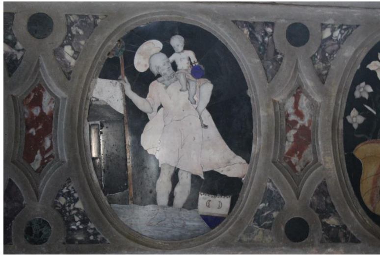
Slika 20. Sv. Kristofor, druga polovica 17. st., župna crkva Uznesenja Blažene Djevice Marije, Rab

Na antependiju glavnog oltara rapske exkatedrale, u višebojnim mramornim intarzijama, nalazi se prikaz sv. Kristofora iz druge polovice 17. stoljeća. 79