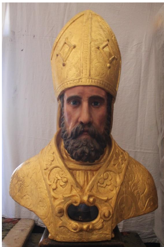
Slika 1. Relikvijar sv. Kvirina, Katedrala Uznesenja Blažene Djevice Marije, Krk

Relikvijar sv. Kvirina čuva se u Krčkoj katedrali. Temeljem arhivskih podataka datira se najkasnije u 1625. godinu kada ih u vizitacijskom zapisniku navodi zadarski nadbiskup Ottaviano Garzadori. Relikvijar prvi spominje Piero Pazzi 1994. godine, smatrajući da je riječ o radu dubrovačkih radionica i datirajući ga u 16. stoljeće.