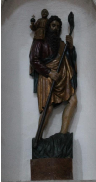
Slika 21. Kip sv. Kristofora, Petar de Riboldis, 15. st., župna crkva Uznesenja Blažene Djevice Marije, Rab

Drveni kip sv. Kristofora nalazi se na prvom oltaru južnoga broda u exkatedrali u Rabu. Doima se kao reljef jer je od početka bilo zamišljeno da bude postavljen u nišu. Pripisuje se Petru de Riboldisu i datira se u četvrto desetljeće 15. stoljeća.