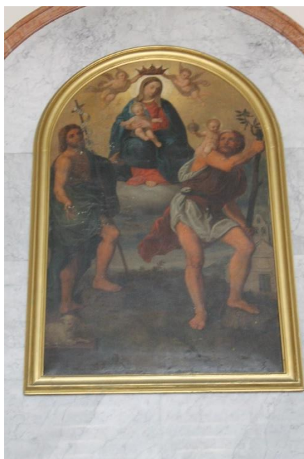
Slika 30. Bogorodica s Djetetom, sv. Kristoforom i sv. Ivanom Krstiteljem, župna crkva sv. Ivana Krstitelja, Lopar, Rab

Oltarna pala smještena je na glavnom oltaru u župnoj crkvi sv. Ivana Krstitelja u Loparu na Rabu. Na pali je prikazana Bogorodica s Djetetom, sv. Kristoforom i sv. Ivanom Krstiteljem.