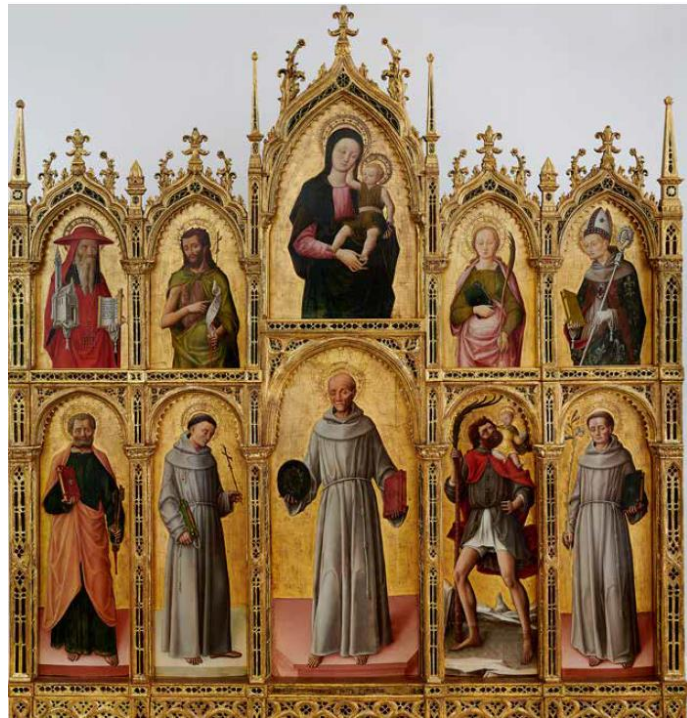
Slika 28. Poliptih sv. Bernardina, Antonio i Bartolomeo Vivarini, 1458., crkva sv. Bernardina, Kampor, Rab

Poliptih sv. Bernardina nalazi se u crkvi sv. Bernardina u Kamporu na otoku Rabu. Izradili su ga Antonio i Bartolomeo Vivarini 1458. godine.