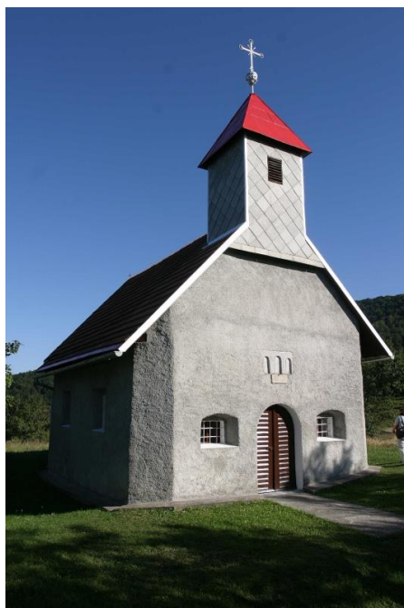
Slika 32. Crkva sv. Josipa, Stari Lazi