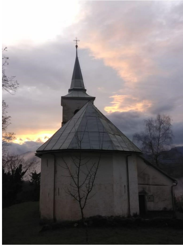
Slika 13. Crkva sv. Petra i Pavla, Podstene