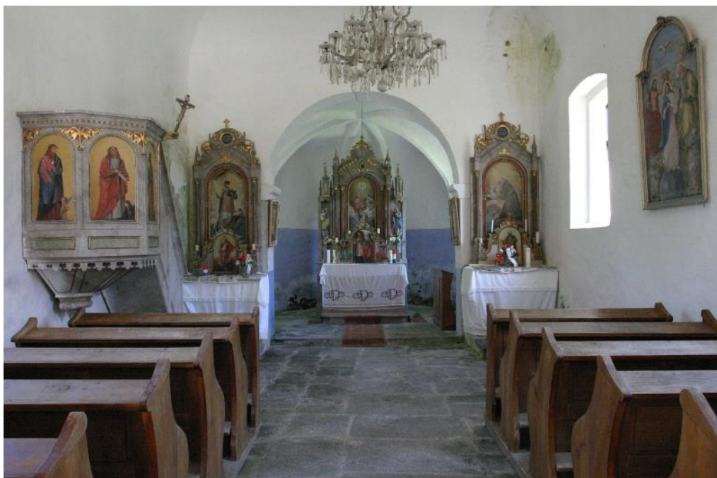
Slika 20. Unutrašnjost crkve sv. Duha