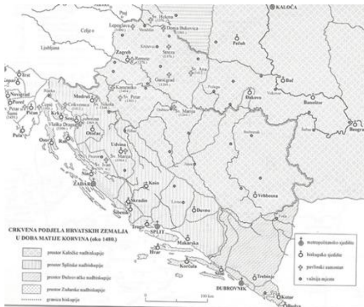
Slika 3. Crkvena podjela hrvatskih zemalja u drugoj polovici 15. stoljeća