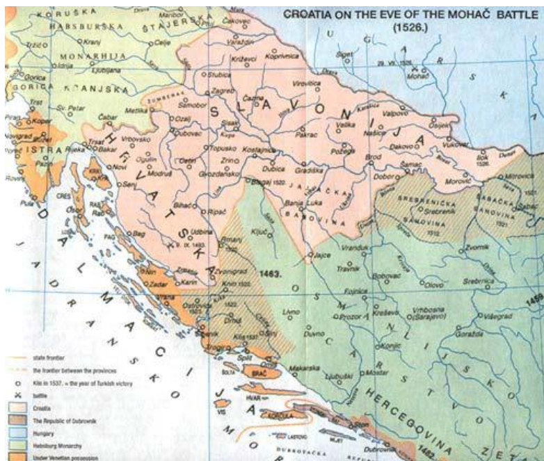
Slika 1. Hrvatske zemlje uoči bitke na Mohačkom polju