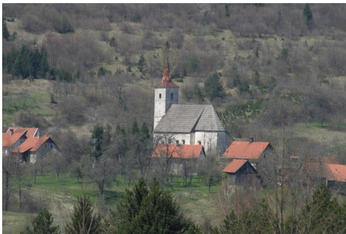
Slika 12. Crkva sv. Marije Škapularske, Moravička Sela