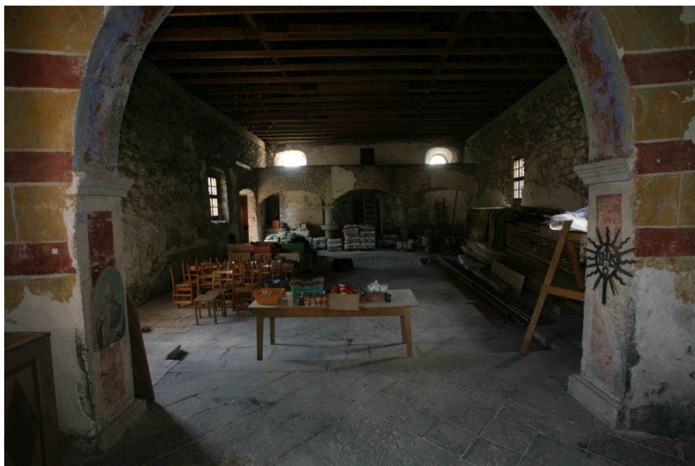
Slika 11. Unutrašnjost crkve sv. Marije Škapularske