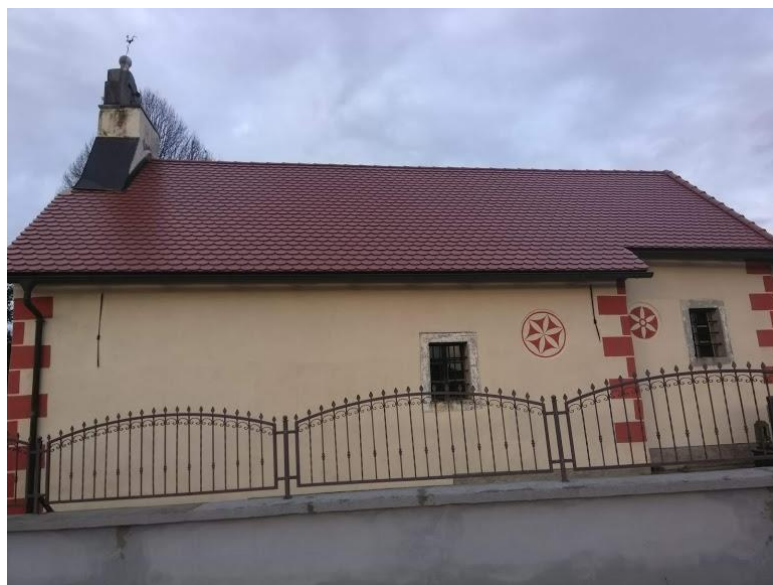
Slika 25. Crkva sv. Roka, stanje