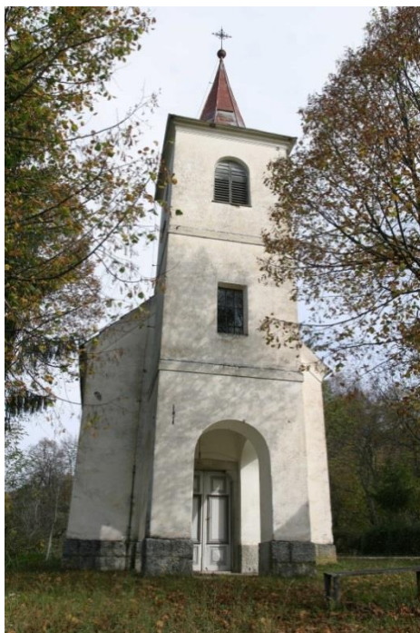
Slika 31. Crkva Srca Isusova, Velike Drage