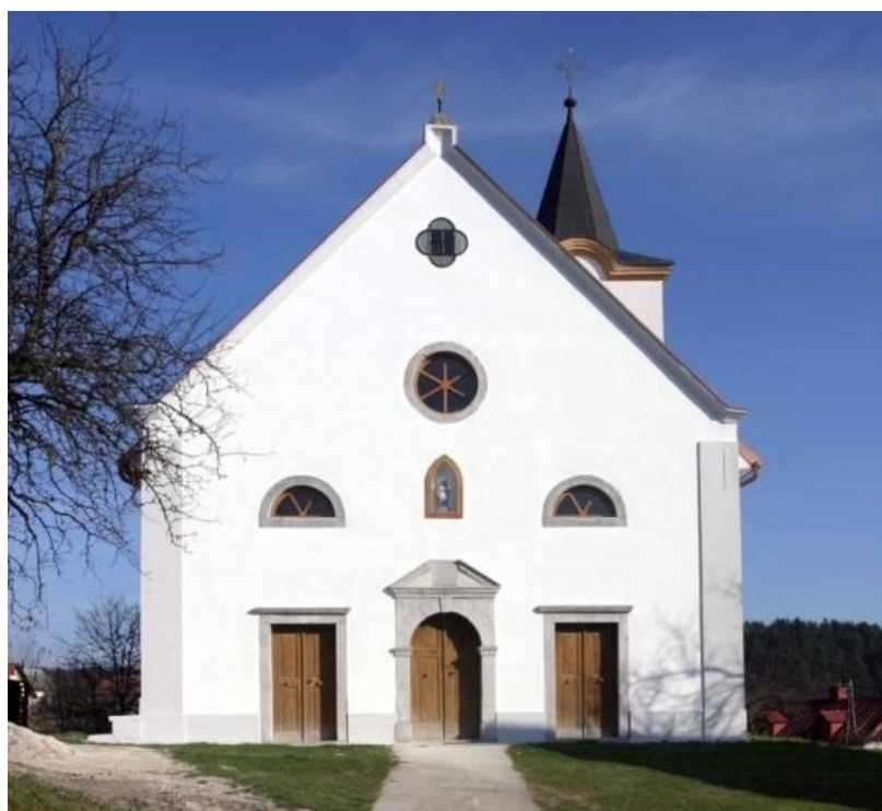
Slika 6. Pročelje crkve sv. Nikole, Brod Moravice