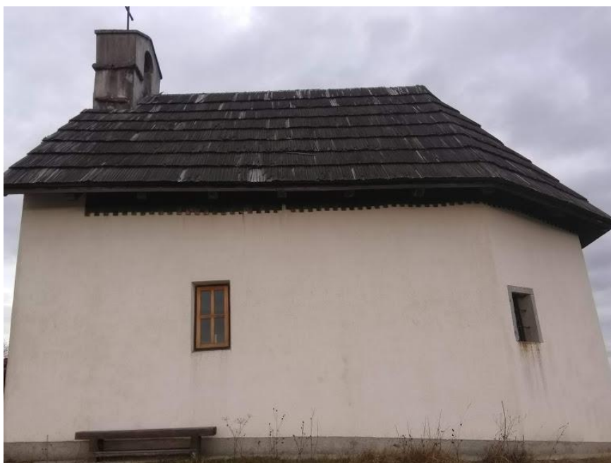
Slika 28. Crkva sv. Andrije, bočna strana