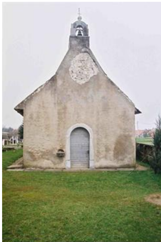
Slika 22. Crkva sv. Roka, Brod Moravice, pročelje