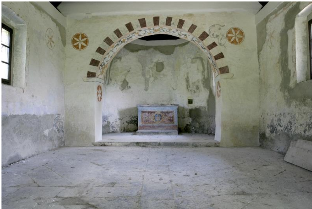
Slika 18. Unutrašnjost crkve sv. Mihovila