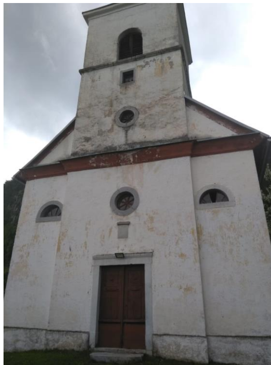
Slika 14. Pročelje crkve sv. Petra i Pavla, Podstene