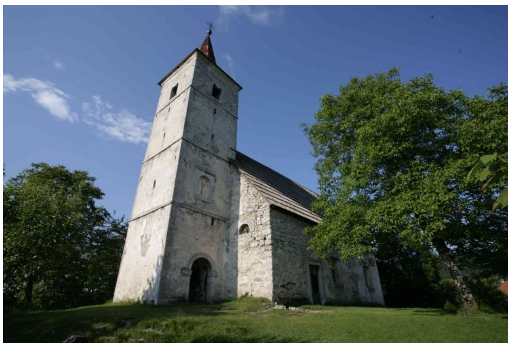
Slika 10. Crkva sv. Marije Škapularske, Moravička Sela