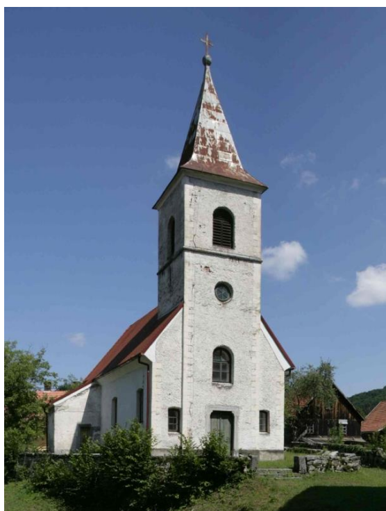
Slika 19. Crkva sv. Duha u Malim Dragama