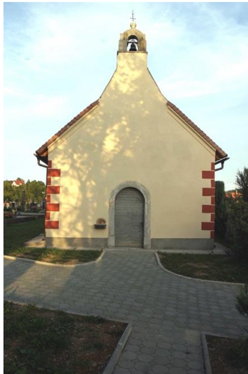
Slika 24. Crkva sv. Roka, Brod Moravice; stanje nakon konzervatorskog zahvata