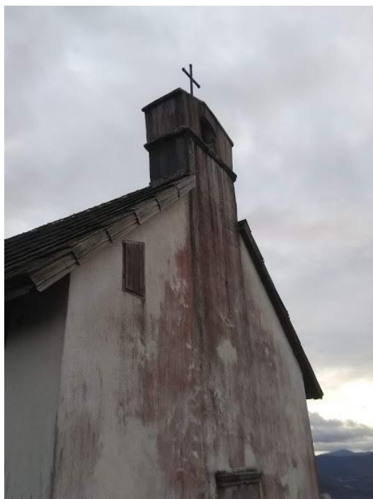
Slika 27. Crkva sv. Andrije