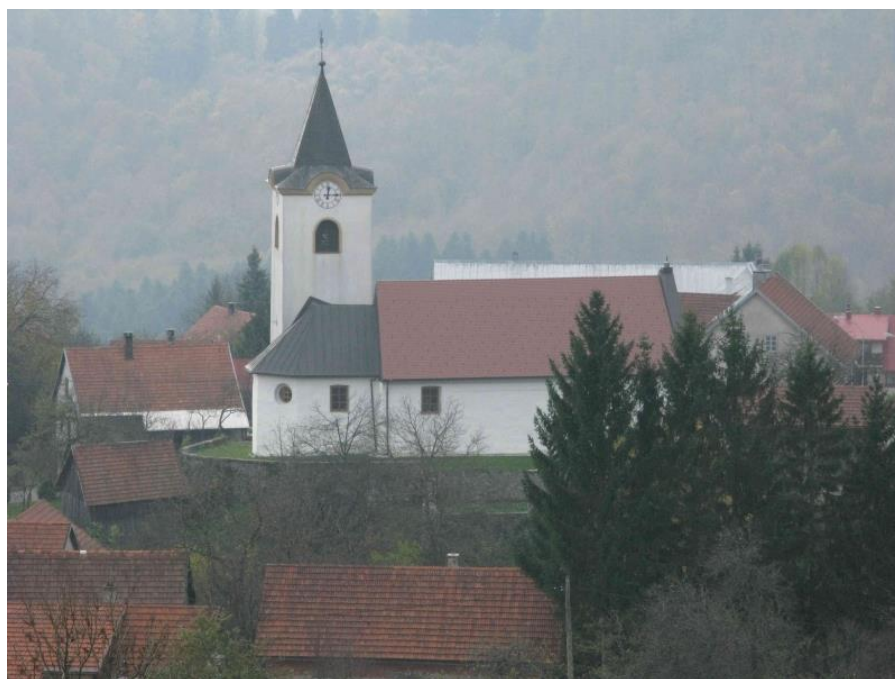
Slika 5. Crkva sv. Nikole, Brod Moravice