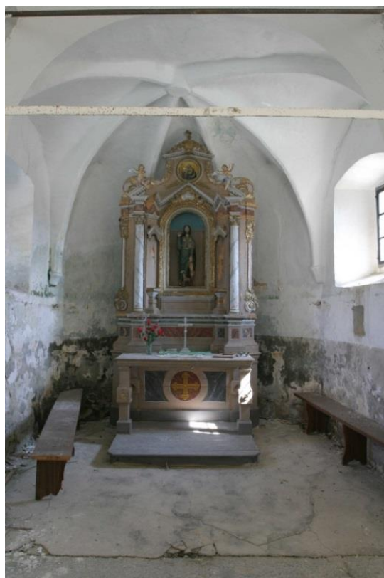
Slika 26. Unutrašnjost crkve sv. Roka