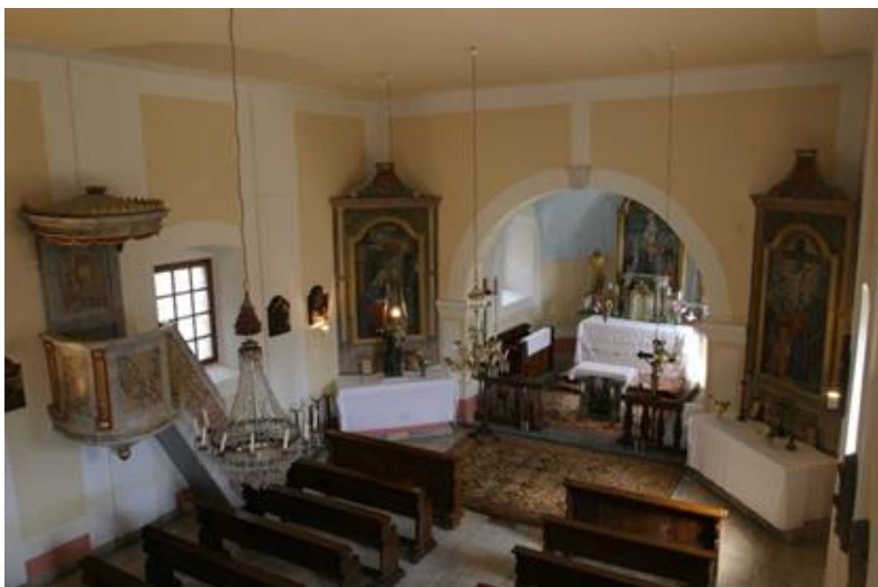
Slika 16. Unutrašnjost crkve sv. Križa