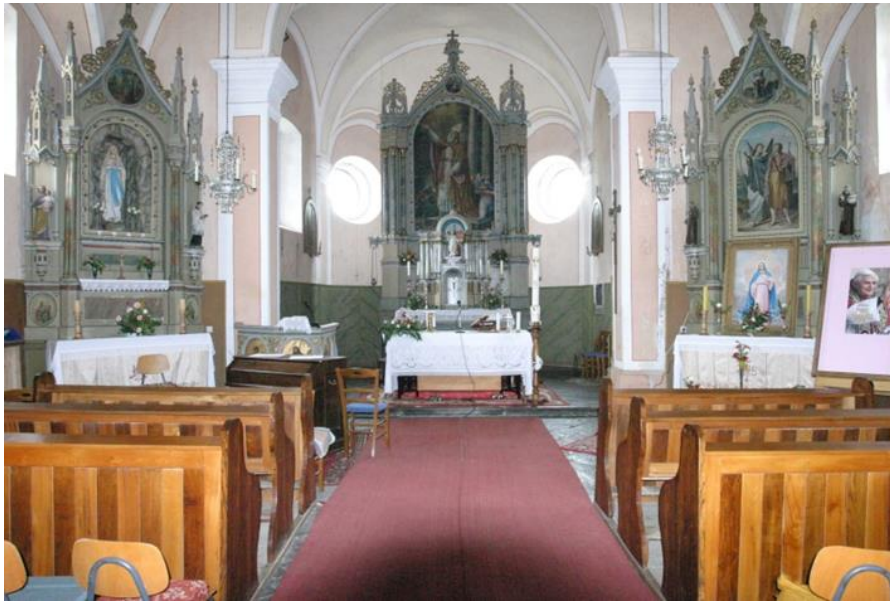
7. Unutrašnjost crkve sv. Nikole