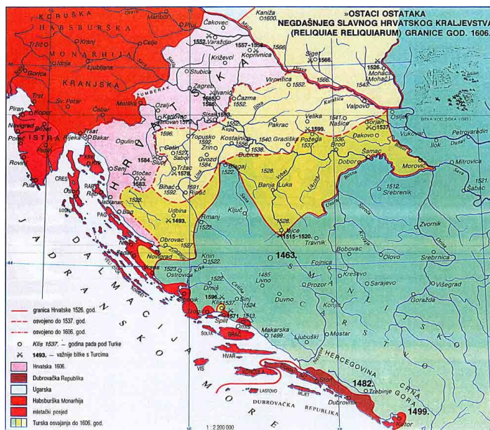
Slika 2. Prikaz razjedinjenih hrvatskih zemalja početkom 17. stoljeća ( Preuzeto iz: GRUPA AUTORA, Hrvatski povijesni zemljovidi, Zagreb, 1998.)