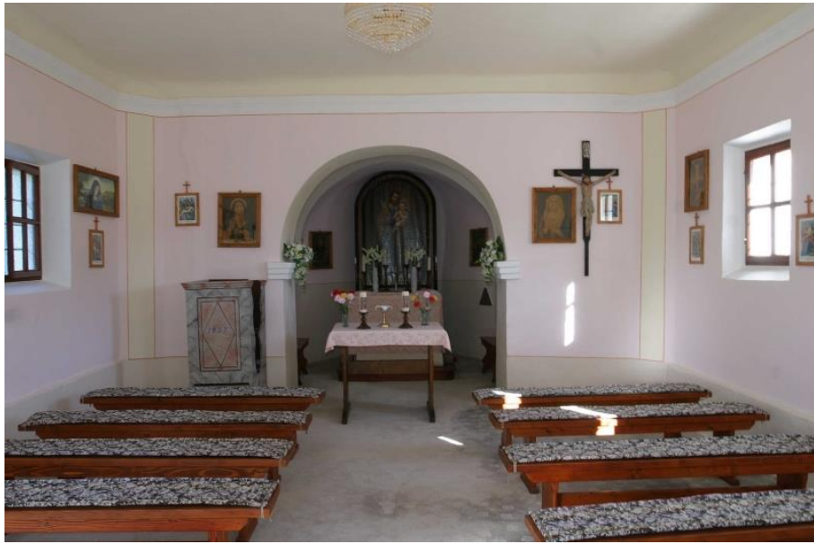
Slika 33. Unutrašnjost crkve sv. Josipa