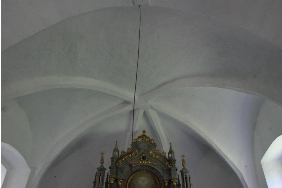
Slika 21. Svod u svetištu crkve sv. Duha