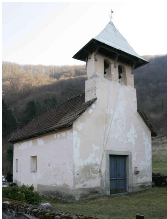
Slika 29. Crkva sv. Lucije, Goršeti