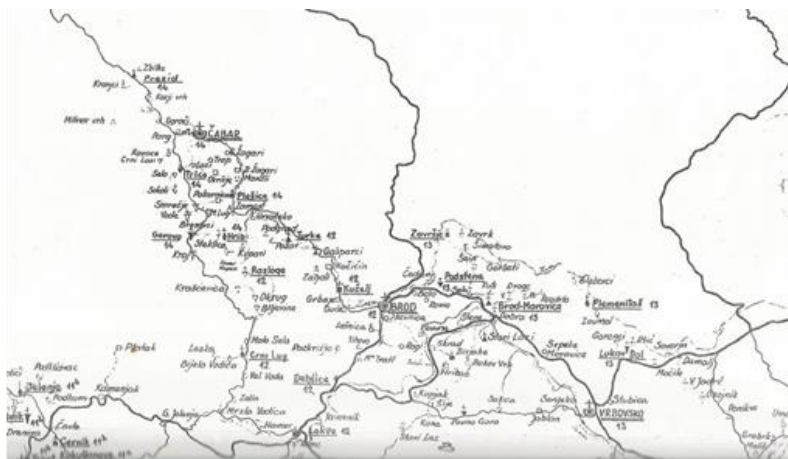
4. Karta s prikazom župa na području Gorskog kotara iz 1965.