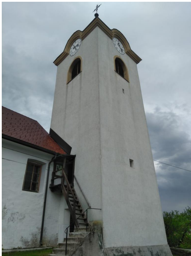
Slika 8. Zvonik (nekadašnji toranj) crkve sv. Nikole