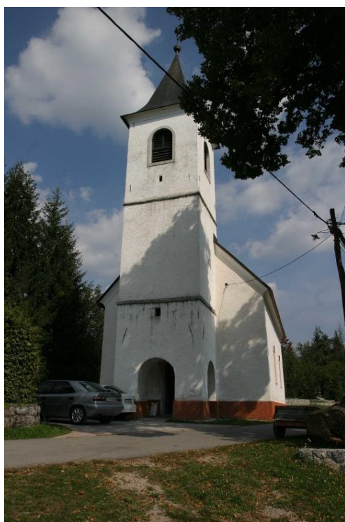
Slika 15. Crkva sv. Križa, Šimatovo