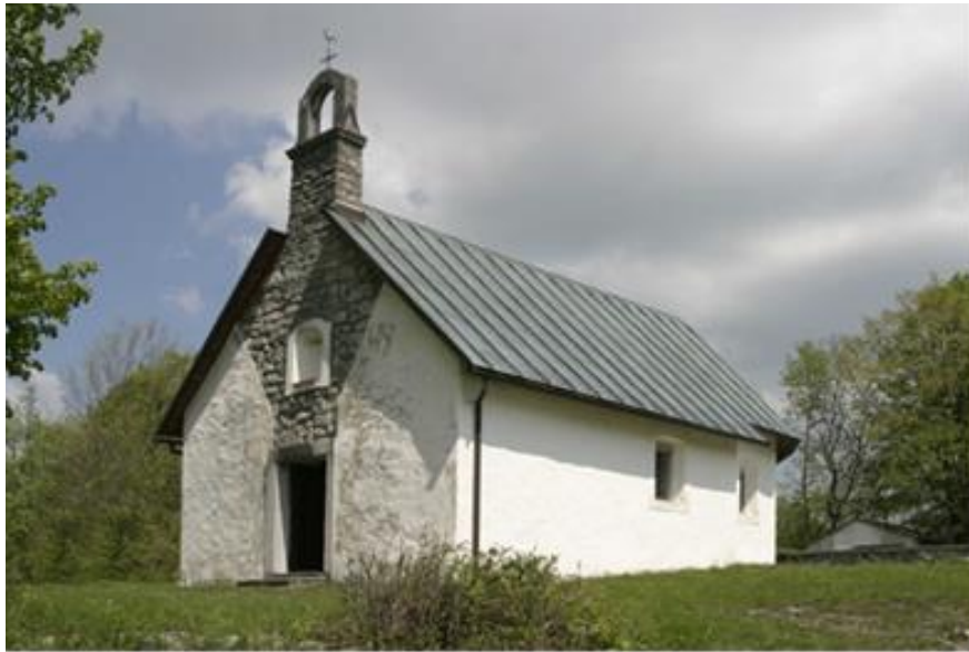
Slika 17. Crkva sv. Mihovila, Šimatovo