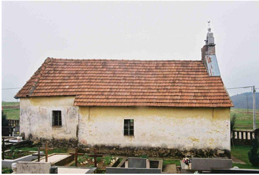
Slika 23. Crkva sv. Roka, Brod Moravice