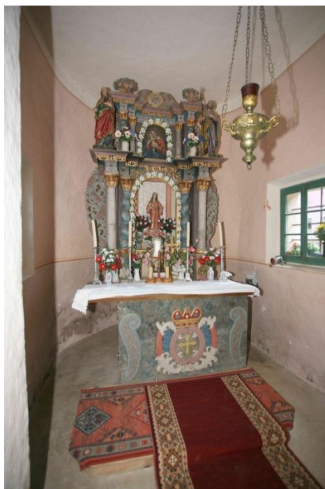
Slika 30. Unutrašnjost crkve sv. Lucije