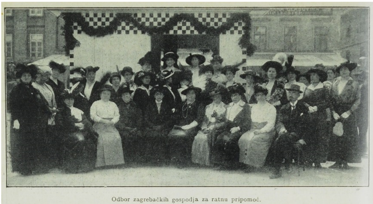
Slika 4: Odbor zagrebačkih gospodja za ratnu pripomoć, Ilustrovani list , br. 20. 1915. 169

nezbrinutu djecu, zatim na području socijalne skrbi i organiziranja također pomoć usmjerena ženama pa tako imamo primjerice dnevnu skrb za siromašnu djecu zaposlenih radnica i bolesnih majki. 163 Jačanjem građanske klase u drugoj polovici 19. stoljeća, žene iz bogatijih obitelji unajmljuju pomoć u vođenju kućanstva što im ostavlja vremena za dokolicu koju ispunjavaju druženjem i izlaskom u javnost, najprije u svojim salonima kao polujavnim prostorom, a zatim u područjima karitativne djelatnosti i kulturnog (nacionalnog) rada. 164 Prvo gospojinsko društvo, Frauen-Verein , osnovano je u Zagrebu 1855. godine, a bavilo se pomaganjem siromašnoj djeci. 165 Krajem 19. stoljeća osnivaju se gospojinska društva i u Osijeku, Karlovcu, Požegi, Vinkovcima, Bjelovaru i Slavenskom brodu. 166 Ova su društva organizirala čajanke, plesove, tombole i druge gdje su se prikupljali dobrotvorni prilozima te se ta pomoć kasnije dijelila siromašnima. 167 Osim pripadnica viših slojeva, u rad društava se uključuju i učiteljice. 168