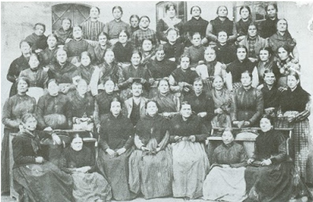
Slika 8: Rovinjske tabacchine (radnice u Tvornici duhana). 358

jednom bečkom radničkom listu kako u tvornici duhana vlada veliko nezadovoljstvo s novim upraviteljem iz razloga „da postupa vrlo strogo sa radnicama, da ih često i za malenkost kazni i da je prošloga decembra odustio iznenada 200 radnicah“, a radnice se za to namjeravaju potužiti i glavnom ravnateljstvu tvornica duhana u Beču. 357 Ova pritužba osim što govori o lošim uvjetima rada u tvornici duhana, daje nam uvid i u to da su radnice stekle hrabrost požaliti se i tražiti svoja prava.