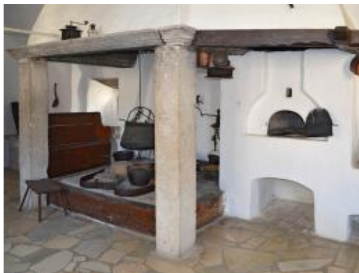
Slika 5: Ognjište kuhinje kaštela u Pazinu, Postav Etnografskog muzeja Istre. 244

Žene gradskih sredina su kao i žene u ruralnim sredinama bile u podređenom položaju s obzirom na muža te su osjetile egzistencijalnu nesigurnost, jednako sluškinje i nezaposlene žene srednjeg staleža koje su statusno i egzistencijalno bile u nezgodnom položaju u slučaju smrti svog hranitelja (supruga). 245 Čak i žene koje su radile u gradskim sredinama, ovisile su o svom suprugu jer njihove plaće nisu bile dovoljne za pokriti osnovne egzistencijalne potrebe, a s druge strane žene srednjih staleža su zbog nezaposlenosti isto tako bile podređene jer je muškarac bio jedini hranitelj obitelji te vlasnik svih materijalnih sredstava. Veliki broj društava najčešće kao elemente društvene hijerarhije uzima spolne i dobne razlike pri čemu se na hrvatskom selu višim položajem vrednuju muškarci uz također više vrednovanje oženjenih muškaraca i udanih žena te stariji članovi obitelji. 246 Posebno se u ruralnim sredinama poštovala stroga unutar obiteljska tradicionalna patrijarhalna hijerarhija pri čemu je položaj udane žene (snahe) u obitelji bio podređen gotovo svim članovima obitelji. 247 Odnosi unutar obitelji bili su isprepleteni, a bračni odnosi su se unutar toga „utapali“ u masi rodbinskih odnosa. U imućnijim seoskim obiteljima uz tradicionalnu patrijarhalnu hijerarhiju postojala je i stvarna unutarnja hijerarhija prema kojoj su snahe, ženska djeca i sluškinje čvrsto podređene