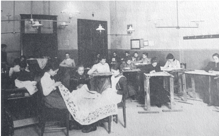
Slika 2: Tečaj vezanja u Ženskoj stručnoj školi u Zagrebu krajem 19. stoljeća 108

ženski licej koji je u osnovi bio sličan gimnazijama koje su polazili dječaci. 105 Otvaranjem ovih dviju škola smatralo se u javnosti da je ostvarena reforma koja je riješila pitanje ženskog obrazovanja i to tako da je Ženski licej zadovoljavao potrebe više građanske klase, a Stručna škola je zadovoljavala potrebe polaznica iz slojeva sitnog građanstva koje su se mogle na taj način obrazovati i za neke obrtničke djelatnosti. 106 Ove su dvije škole napravile iskorak u obrazovanju djevojaka koje se više ne smještaju samo u sferu domaćinstva, već ih i jedna i druga škola pripremaju i za samostalnost te sudjelovanje u javnoj sferi života. 107