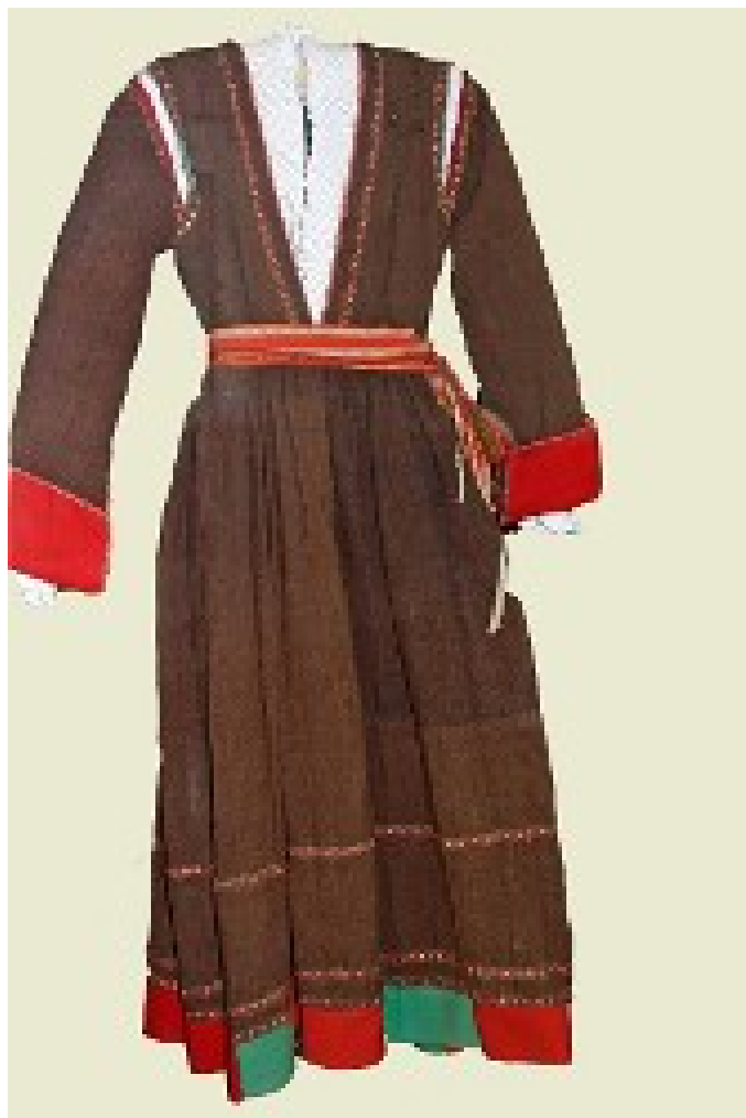
Slika 6: Modrna na radost iz južne Istre od smeđeg nestupanog sukna, u struku opasana pojasom. Nosile su je mlade djevojke i žene. 269