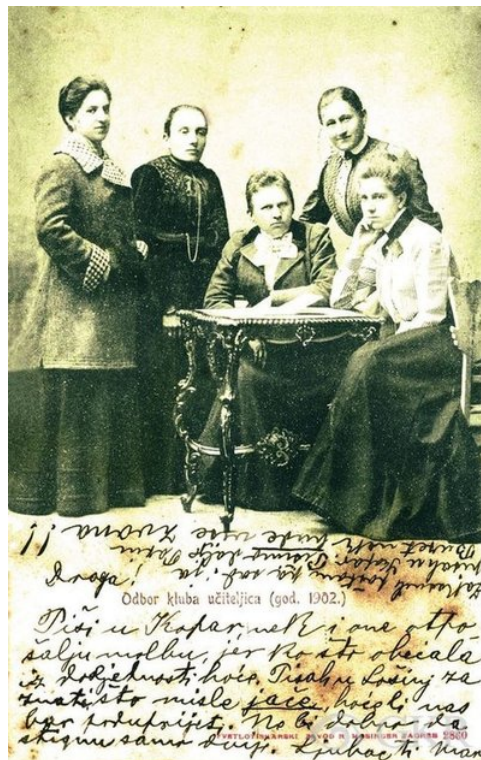
Slika 3: Odbor kluba učiteljica, 1902. godina 161

su udruženja djelovala s ciljem postizanja ekonomskog prosperiteta svojih članica u vremenu kada je žena lišena niza osobnih i građanskih prava od prava glasa, preko ograničenja prava vezanih uz nasljeđivanje i raspolaganje imovinom, preko neravnopravnog položaja unutar obitelji do nemogućnosti slobodnog sudjelovanja u radnoj i profesionalnoj sferi. 159 Među najstarijim ženskim profesionalnim udruženjima javljaju se Gospojinska udruga za naobrazbu ženskinja (1900.) i Klub zagrebačkih učiteljica (1902). 160