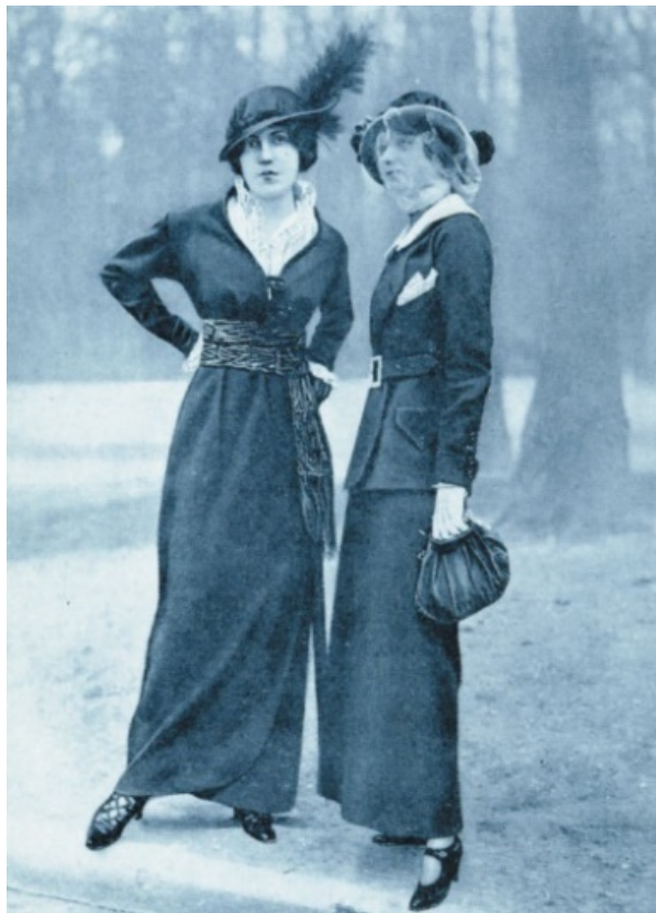
Slika 1: Zagrepčanke u reformiranoj odjeći, 1913. 42

najrecentniji su modni trendovi bili osobito zastupljeni među Zagrepčankama pa su tako osamdesetih godina bili često zastupljeni engleski kostimi sa dugim suknjama bež ili sive boje te kragnice visoko uzdignute. 39 Početkom 20. stoljeća u vrijeme jačanja borbe za ravnopravnost žena, prvo glasa i zapošljavanje, dolazi i do promjene modnog ukusa i nastaju prve naznake suvremenog odijevanja u skladu sa zahtjevima za pojednostavljivanjem i praktičnošću. 40 Početkom 20. stoljeća žene su sve više počele prihvaćati i odjevne predmete koje su inače nosili muškarci pa su se tako u Zagrebu od 1911. mogle kupiti i ženske hlače. 41