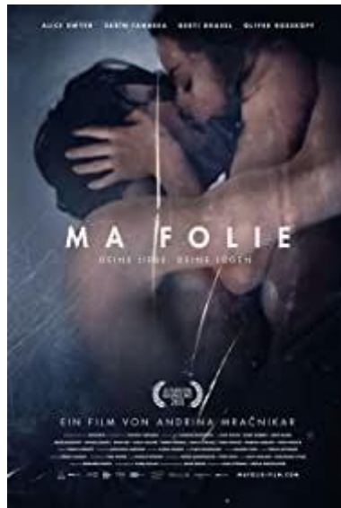
Slika 1. Službeni plakat filma iz 2015. godine.

Ma Folie ('Moje ludilo' 3 ) je devedesetominutni francusko-austrijski triler koji je 2016. godine režirala slovenska i austrijska redateljica Andrina Mračnikar. U kinima se službeno počeo prikazivati 21. srpnja 2016. godine. Iako se isprva čini kako se radi o još jednom romantičnom i ljubavnom filmu, svojom strukturom i neobičnim zapletima Ma Folie prelazi uobičajene granice ljubavnih filmova.