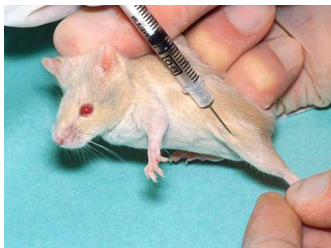
Fotografija 2. Pokusni miš

Kao prvo, činjenica da se pokusi provode upravo na ne-ljudskim životinjama, a ne na kamenju, pokazuje da između ljudi i ne-ljudskih životinja postoji ogromna sličnost zahvaljujući kojoj se pokusi i smatraju adekvatnima. Dakle, „oni ne mogu nijekati patnju životinja stoga što trebaju istaknuti sličnost između ljudi i drugih životinja kako bi mogli utvrditi da njihovi eksperimenti mogu imati nekakvo značenje za ljudske svrhe. Eksperimentator koji prisiljava štakore da biraju između smrti od gladi i električnih šokova da bi vidio da li se kod njih razvijaju čirevi (što se i događa), to čini zato što štakor ima veoma sličan živčani sustav onom koji imaju ljudska bića, te veoma vjerojatno osjeća električni šok na sličan način.“ 53 Osim toga, kao što Singer primjećuje, „mnogi eksperimenti nanose žestoku bol bez i najmanjih izgleda da će biti nekih značajnijih koristi za ljudska bića ili za bilo koje druge životinje.“ 54