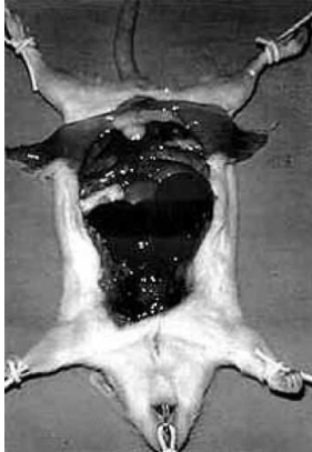
Fotografija 3. Seciranje miša

Osim toga, iako eksperimentatori često naglašavaju da istraživanja provode sa posebno uzgojenim ne-ljudskim životinjama (što zapravo ni na koji način ne umanjuje njihovo nedjelo), „mnoge od tih životinja, kao primjerice žabe, gliste, rakovi i ribe, love se u prirodi. Takvim postupcima njihova se prebivališta pustoše, što predstavlja prijetnju za čitav ekosustav.“ 58