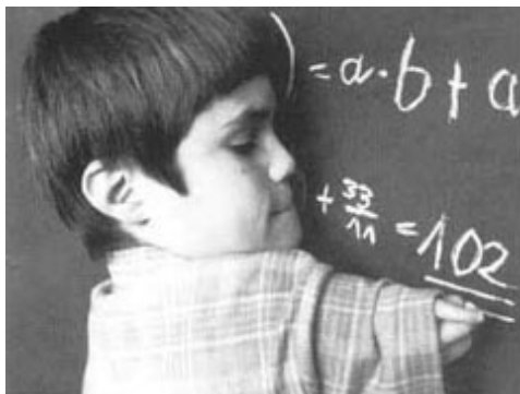
Fotografija 4. Dijete s posljedicama Talidomida

Između 1957. i 1961. godine se trudnicama propisivao lijek pod nazivom Talidomid za ublažavanje jutarnjih mučnina, a čije se uvođenje u ljudsku upotrebu temeljilo na prethodno provedenim eksperimentima na više životinjskih vrsta. Iako se tvrdilo da je lijek potpuno siguran, u tom je razdoblju rođeno više od 10000 djece s deformiranim rukama i nogama, a neki i bez njih. U novorođenčadi životinjskih vrsti nije bilo takvih posljedica, tek je u dodatnim istraživanjima provedenim na mnogo ne-ljudskih životinja pronađena pasmina zeca na Novom Zelandu čija je mladunčad rođena s određenim deformacijama. Važno je naglasiti da, čak i da su u početku otkrivene deformacije na novorođenčadi ovih zečeva, lijek bi vrlo vjerojatno svejedno ušao u upotrebu budući da na većini ne-ljudskih životinjskih vrsta nije bilo nikakvih vidljivih posljedica.