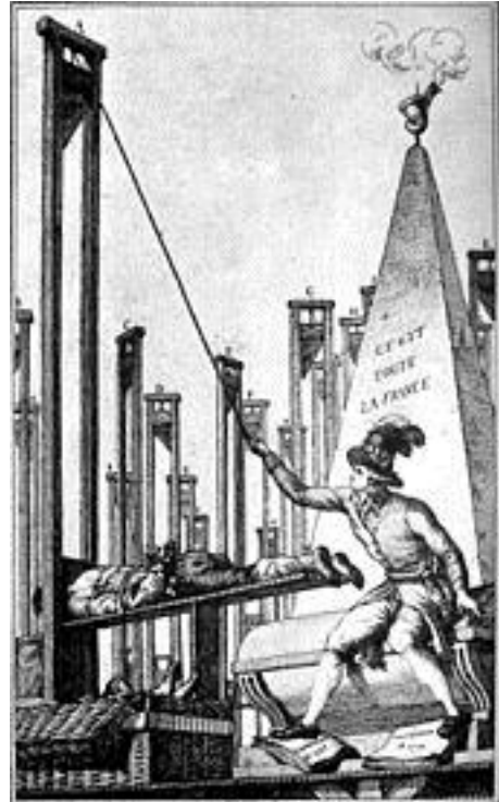
Karikatura koja prikazuje Robespiera koji sam giljotinira krvnika nakon što je giljotinirao sve ostale.

Za Robespiera je od tada pa nadalje teror bilo potreban, pohvalan i neizbježan. Smatrao je da Republika može biti spašena samo građanskim vrlinama, a njegov je teror bio