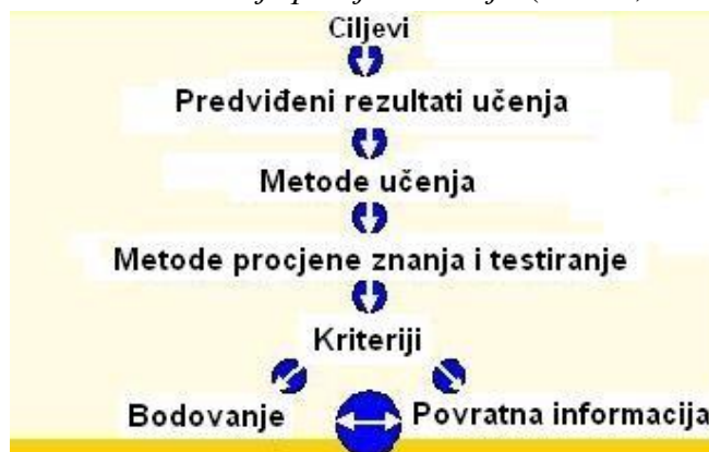
Slika 1. Usklađivanje procjene znanja (Brown, 2007a)

U nastavnom procesu važno je da su postavljeni jasni ciljevi i ishodi učenja koje će usmjeravati učenike i nastavnike u učenju, odnosno, poučavanju. Također, metode učenja i metode procjene znanja moraju biti usklađene sa željenim ishodima učenja, a pritom je važno jasno postavljanje kriterija koji će omogućiti dosljednost u bodovanju. Vrlo je važno istaknuti da nastavnici nisu u mogućnosti pružiti podršku i pomoć učenicima za ostvarivanje određenih ishoda učenja ukoliko ne postoji povezanost između „povratnih informacija, kriterija i oblika procjene znanja“ (Brown, 2007a).