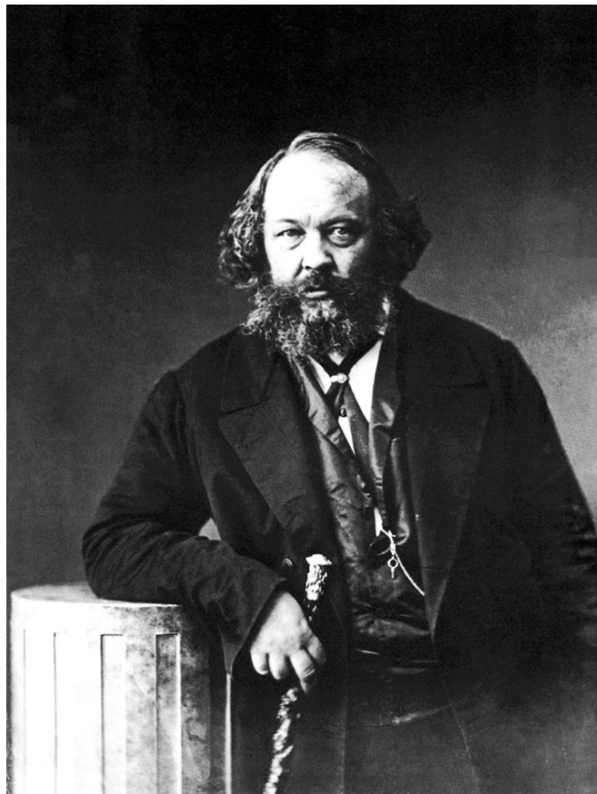
Slika 4: Mihail Bakunjin (1814.-1876.), ruski revolucionar i začetnik kolektivističkog anarhizma

kroz nagradne vaučere koji bi se mogli koristiti u komunalnim tržnicama gdje su vrijednosti unaprijed demokratski dogovorene. Na taj način se eliminira koncept slobodnog tržišta kakav postoji u prethodno spomenutom mutualizmu. Kolektivizam se može bez oklijevanja uvrstiti u socijalni anarhizam, a s druge strane mutualizam je znao aktivirati daleko više asocijacija s njegovom suprotnošću, tj. individualističkim anarhizmom.