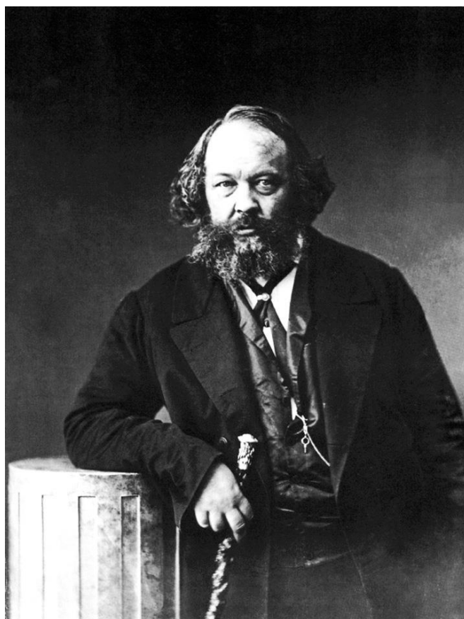
Slika 4: Mihail Bakunjin (1814.-1876.), ruski revolucionar i začetnik kolektivističkog anarhizma

kroz nagradne vaučere koji bi se mogli koristiti u komunalnim tržnicama gdje su vrijednosti unaprijed demokratski dogovorene. Na taj način se eliminira koncept slobodnog tržišta kakav postoji u prethodno spomenutom mutualizmu. Kolektivizam se može bez oklijevanja uvrstiti u socijalni anarhizam, a s druge strane mutualizam je znao aktivirati daleko više asocijacija s njegovom suprotnošću, tj. individualističkim anarhizmom.