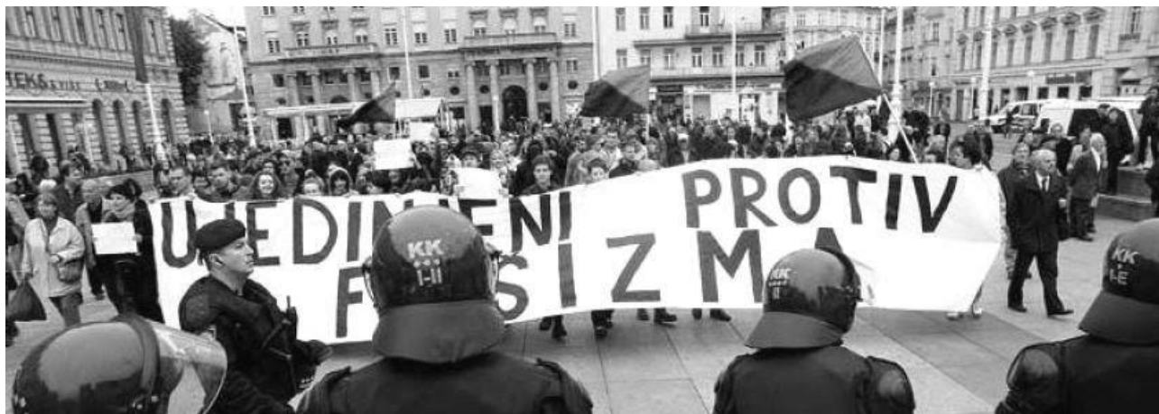
Slika 3 Zagreb, 14. travnja 2012. – Ujedinjeni protiv fašizma

slobodarskog profila izaći će iz stranke. 80 81 Jedna od najnovijih inicijativa koja privlači simpatizere slobodarskih ideja jest Libertarijanska ljevica, a nastala je krajem 2010-ih i sačinjava ponajviše mladu generaciju koja je navikla na digitalizaciju svakodnevnog života te doživljavaju ovakav suvremeni životni stil i funkcioniranje kao nešto sasvim normalno i prirodno, ali ujedno se ne libe baviti uličnim akcijama. 82