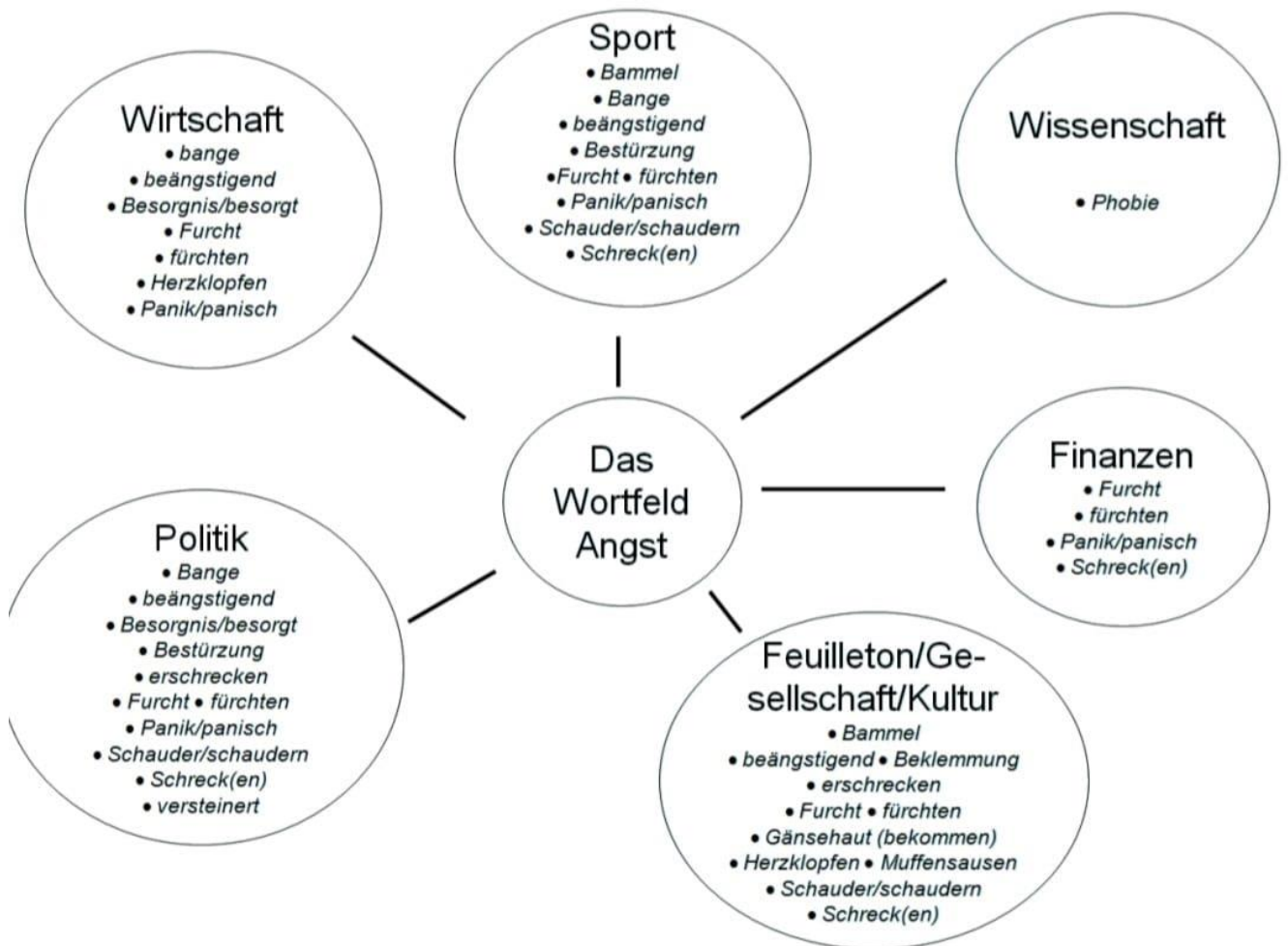
Schema 2: (Henn-Memmesheimer, 2012: 27): Grafik 1: Sprechen über Emotionen und Gefühle: neurobiologisch und alltagsprachlich - Das Beispiel Angst

Die Definition des Oberbegriffs hängt von der Kultur ab, der sie angehören, dem Bereich, in dem sie arbeiten und ihren Interessen. Unser Gehirn funktioniert, indem es Konzepte verbindet, die sich auf unsere Umgebung beziehen, in der wir uns befinden. Deswegen sind seltenere Wörter unterschiedlich auf die einzelnen Ressorts verteilt. (vgl. Henn-Memmesheimer, 2012: 26-27) Das folgende Schema zeigt, wie man unterschiedliche Ressorts mit unterschiedlichen Bereichen verbindet: