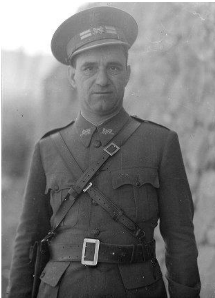
Vladimir Čopić u Španjolskom građanskom ratu 1937. Godine ( https://kulturasjecanjasgr.wordpress.com/ostalo/ )