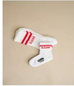
MALI AJVAR €6,00