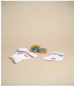
MALI YUGO SLAV €6,00