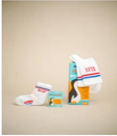
MALI SLAV €6,00