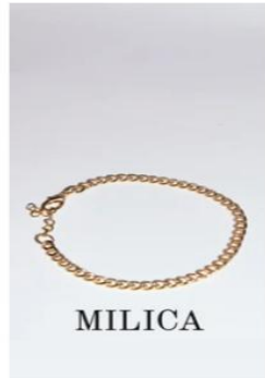
MILICA €10,00 — Sold Out