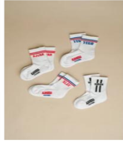
MALI SLAVSOCKS €20,00