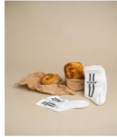
MALI BUREK €6,00