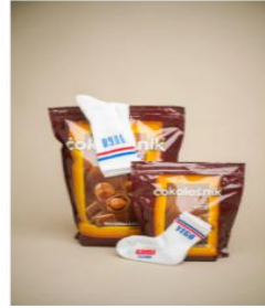
MALI YUGO €6,00