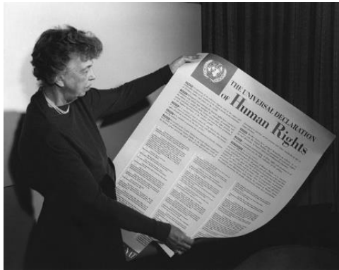
Slika 2. Eleanor Roosevelt i Opća deklaracija o ljudskim pravima (1949.)

U razdoblju drugoga vala feminizma američki predsjednik J.F. Kennedy osnovao je Predsjedničku komisiju o statusu žena , organizaciju koja se bavila pitanjima ravnopravnosti, (ne)jednakih prilika za zapošljavanje, obrazovanje i sigurnost žena, pritom se boreći za ukidanje zakona kojima su se diskriminirala ženska prava. Iz svega navedenoga, razvidno je da su ženska prava u drugom valu feminizma postala pitanja nacionalnog interesa i da su raniji feministički pokreti urodili plodom. Predsjednik Kennedy imenovao je Eleanor Roosevelt predsjednicom komisije za ljudska prava. Roosevelt je bila prva predsjednica Povjerenstva Ujedinjenih naroda za ljudska prava , a uvelike je utjecala na nastanak Opće deklaracije o ljudskim pravima . 11 Prema Deklaraciji , svaka je osoba od rođenja slobodna i ima pravo uživati u jednakim pravima u skladu s dostojanstvom (Deklaracija o ljudskim pravima 1948: članak 1).