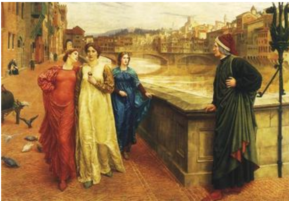
Fig.3. H. Holiday, Dante e Beatrice , 1883, Liverpool, National Museums of Liverpool, Walker Art Gallery.