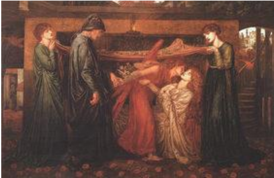
Fig.4. D. G. Rossetti, Il sogno di Dante , 1871, conservato presso la Walker Art Gallery, Liverpool, Inghilterra.