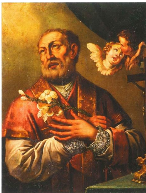
36. Nepoznati slikar Sv. Filip Neri oko 1779. godine ulje na platnu, 71 x 55 cm zid bočnog broda župne crkve sv. Jurja i Eufemije, Rovinj