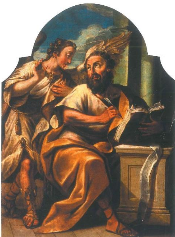
37. Nepoznati slikar Sv. Matej Evanđelist oko 1779. godine ulje na platnu, 77 x 57 cm zid bočnog broda župne crkve sv. Jurja i Eufemije, Rovinj