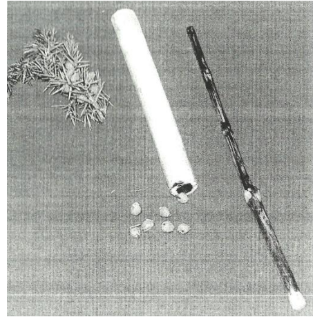
Slika 1. Puškalice (Margetić, 2005).

Ipak, prilikom igre nije bilo podjele na djevojčice i dječake, mlađe i starije, već su djeca bila međusobno povezana, bez individualnih izdvajanja (Margetić, 2009). Budući da igračkara na selu nije bilo, djeca su ih najčešće izrađivala sama. Vjerojatno najpoznatija od njih je tzv. krpenjača, lopta načinjena od krpa s kojom su dječaci igrali nogomet. Osim nogometa, česte su bile igre lovice ili pljočkanje, a djeca su znala izraditi švike (zviždaljke),