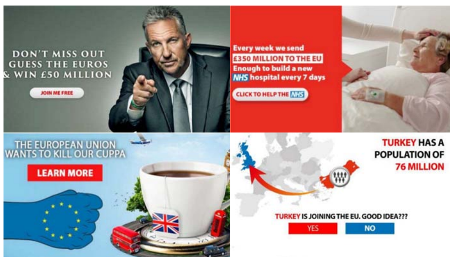
Slika 5. Neki od oglasa koji su obilježili kampanju VoteLeave na društvenoj mreži Facebook.

milijuna funti na tjedan i da bi taj iznos bilo daleko bolje utrošiti na sustav nacionalnog zdravstva (NHS); velik se dio oglasa odnosio na britanske vrijednosti poput ispijanja čaja i zaštite životinja, sugerirajući da ostanak u EU-u te vrijednosti dovodi u pitanje; dio je oglašavanja bio posvećen zastrašivanju Britanaca mogućim članskim širenjem EU-a na Tursku, Albaniju, Makedoniju, Crnu Goru i Srbiju. pri čemu je jedan od oglasa sugerirao opasnost od prelijevanja ukupnog stanovništva Turske na britanske otoke; pojedini su se oglasi referirali, afirmativno ili negativno, na izjave poznatih političara, ponekad s upitnom kontekstualizacijom (primjerice, naslanjanjem na izjave Jeremyja Corbyna iz ranijeg razdoblja) i dr.