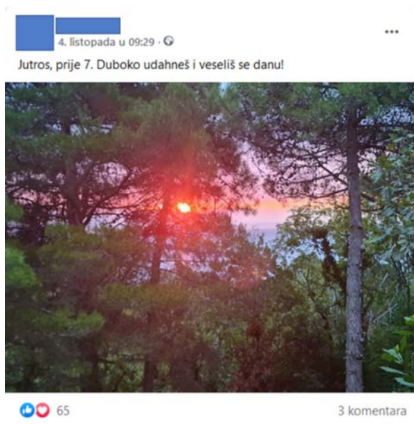
Slika 1. Izvor: Facebook (privatno)

Evo primjera jedne takve poruke, preuzete s društvene mreže Facebook: