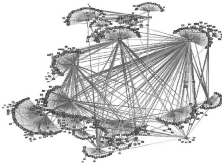
Slika 4. Slika iz knjige Jana A.G.M. van Dijka The Network Society. Social Aspects of New Media (2006: 32) prikazuje povezivanje manjih sfera socijalne stvarnosti u dinamičke mrežne procese.

mim medijem te njime omogućenim načelima kodiranja i autoidentificiranja (primjerice uporabom lozinki), izopćavanja, dopuštenih razina pristupa i sl. Potonjim se aktualiziraju mogućnosti selekcije i ekskluzije neželjenih pristupnika komunikacijskom procesu ili dijelovima toga procesa. Naposljetku, mrežno ustrojavanje komunikacije aktualizira i pitanja sigurnosti odnosno vulnerabilnosti digitalnoga medija, pa stoga već i samo sudjelovanje u procesu komuniciranja povlači i pitanja izloženosti i zaštite privatnih podataka te identiteta korisnika. Sve to daje novu težinu i pitanjima povjerenja i nepovjerenja te aktualizira i problematiku mnogobrojnih psiholoških i socijalnih preduvjeta učinkovita komuniciranja u eri novih medija.