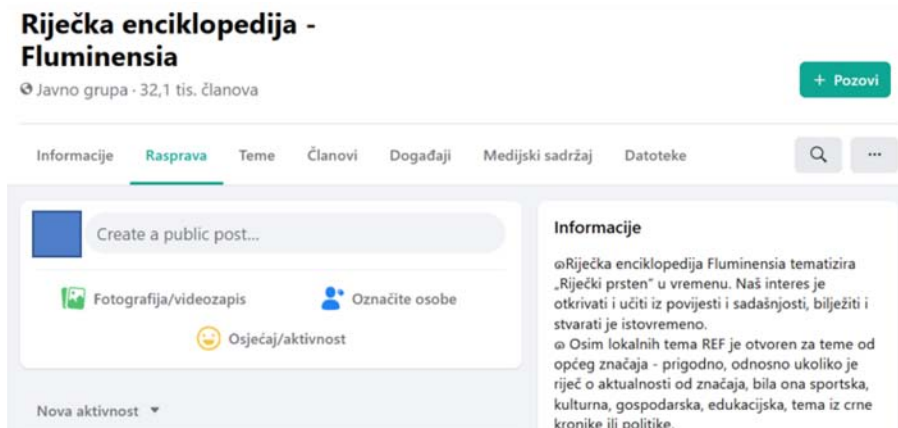
Slika 3. Facebook grupa Riječka enciklopedija – Fluminensia (REF)

Organizira se oko tema povezanih s gradom Rijekom i područjem riječkoga prstena, a fokus joj je na prošlosti i sadašnjosti toga područja. Članovi grupe su većinom osobe koje obitavaju na tome području, no u grupi participiraju i članovi koji s mnogih drugih osnova – obiteljskih, poslovnih, profesionalnih i inih – nalaze interes u riječkim temama. Zbog tenzija nastalih uglavnom po ideološkoj osnovi u danome trenutku dio je članova iz ove grupe istupio, što je rezultiralo nastankom nove grupe slična imena i slične koncepcije: Nova riječka enciklopedija – Fluminensia (NREF). Nova je grupa regulirana kao privatna mreža, što znači da samo članovi imaju pristup njezinu sadržaju, dok je ranija grupa bila i ostala regulirana kao javna, što znači da su sadržaji vidljivi svima na mreži.