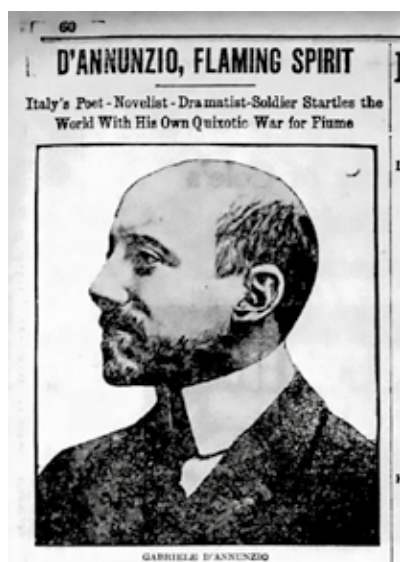
Prilog 4: The Boston Globe , “D'Annunzio, Flaming Spirit,” 21. rujna 1919., str. 60

D'Annunzijevo riječki eksperiment također je bio zanimljiv čitateljima u Sjedinjenim Američkim Državama, budući da su brojni članci objavljeni u svim glavnim novinama, a zatim ponovno tiskani u stotinama lokalnih novina diljem zemlje. S obzirom na to da strani čitatelji nisu bili toliko emocionalno vezani za potencijalne teritorijalne promjene ili unutarnje političke rasprave, članci u američkom tisku često su se fokusirali na lik samog D'Annunzija, često objavljujući dramatične fotografije ili izvještavajući o njegovim brojnim ljubavnicama. Talijansko-američke zajednice s nestrpljenjem su pratile vijesti o D'Annunziju. Čak su bile i domaćini raznih događaja koji su pokazali njihovu potporu njegovom hrabrom osvajanju Rijeke.