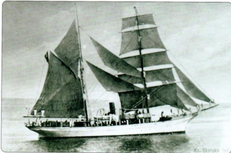
Slika 4.: Školski brod „Vila Velebita“

Izvor: Milić B.: Bakar - drevni grad na valovima stoljeća, Tisak Zambelli, Rijeka, 2003., str. 124.