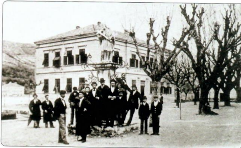
Slika 2.: Razglednica na kojoj se nalazi nekolicina učenika Nautičke škole u Bakru pokraj kipa Sv. Ivana Nepomuka