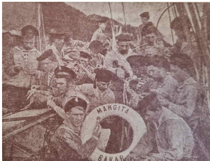
Slika 3.: Nautičari na školskom brodu „Margita“

Kršnjavija zapravo isprika za veliki gubitak Rijeke, gašenje hrvatske gimnazije. 113 Jahta je 22. travnja 1894. preimenovana u „Margita“ u čast supruge bana Khuena Hedervaryja. „Margita“ je bila željezni brod - jedrenjak tipa „logger“ sagrađen 1880. godine u Birkenheadu (Engleska). Bila je dugačka 31 m te je imala pomoćni parni stroj s 35 KS. „Margita“ je školi dodijeljena u naučne i znanstvene svrhe.