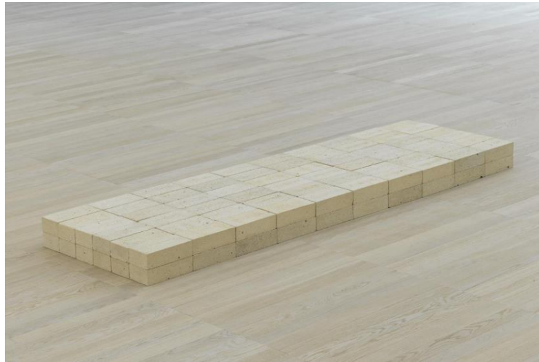
Slika 9. Carl Andre, Equivalent VIII , 1966. Tate, London

učiniti, onda to nije umjetnost”. 66 Ono što je posebno bitno kod ovih primjera je što ove negativne emocije prema filozofskim i meta oblicima umjetnosti ne dolaze od laika, već iz svijeta umjetnosti. Incidenti u kojima su poznata djela nepredmetne umjetnosti oštećena u činovima mržnje češće će biti djelo osobe koja poznaje umjetnost nego neupoznatog puka. Zašto je to tako?