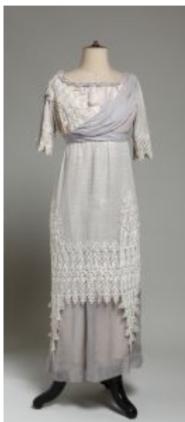
Prilog 9. Gjuro Matić, haljina , oko 1912. g., čipka, voile, muslin, Muzej za umjetnost i obrt, Zagreb ( https://repozitorij.muo.hr/?pr=i&id=35758 preuzeto 3. kolovoza 2022.)

modi Pariza. To je i jedan od uzroka njegove propasti. 75 Inače, Salomon Berger bio je Židov, po zanimanju trgovac. Ideju za proizvodnju tekstila s narodnim ornamentima dobio je prilikom rada u zagrebačkoj prodavaonici u kojoj su bili izlagani dijelovi narodnih nošnji. 76 Treba napomenuti da su gotovo manufakture i prodavaonice, kasnije i industrije odjeće u gradovima bile upravo u vlasništvu Židova. To ne čudi s obzirom da su se sve do kraja 19. stoljeća bavili isključivo trgovačkim i novčarskim poslovima koje su ljudi u to vrijeme smatrali omraženima. Od kraja 19. stoljeća se zahvaljujući većim slobodama sve više okreću manufakturnim djelatnostima, dok su neki uspješno izrasli i u velike industrije. 77 Na modu na prostoru Banske Hrvatske u to vrijeme veliki utjecaj imaju i politička događanja, prvenstveno austro-ugarska aneksija Bosne i Hercegovine 1908. godine. Ona je uzrokovala val bosanskih izbjeglica koje su odlazile u Beč preko Zagreba. Tako se zahvaljujući tom procesu u Zagrebu popularizira ukras na haljinama temeljen na bosanskom ornamentu. 78