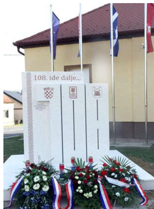
Fotografija 18: Spomenik pripadnicima 108. brigade u Podcrkavlju

U radu je već spomenuto da je 108. brigada osnovana krajem lipnja 1991. godine kao dragovoljačka postrojba ZNG. Njena 1. pješačka bojna tada je osnovana u selu Podcrkavlje, a 2. pješačka bojna u selu Sibinj. Na 31. godišnjicu njezina nastanka otkriven je spomenik poginulim i nestalim pripadnicima 108. brigade u Podcrkavlju. 95 Bijeli kameni spomenik sadrži grbove Republike Hrvatske, ZNG-a i 108. brigade, a na vrhu stoji poruka: 108. ide dalje... Osim grbova, na spomeniku se nalazi i simbol hrvatskog pletera koji se proteže cijelim