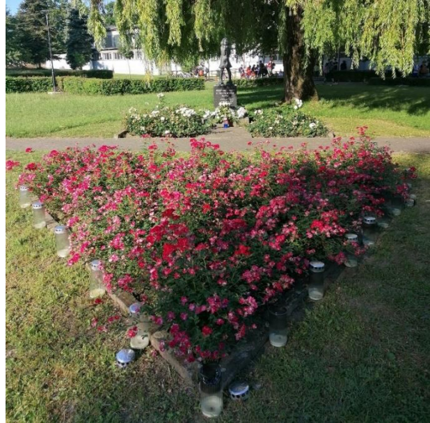
Fotografija 4: Spomenik i okruženje spomenika „Djevojčica“, Slavonki Brod

Posjet ovom spomeniku također dokazuje da je mjesto na kojem se nalazi prilično održavano i uređivano, okruženo cvjetnjakom (slika 4), a posebno mjesto sjećanja postaje za vrijeme obilježavanja teških stradanja djece u gradu.