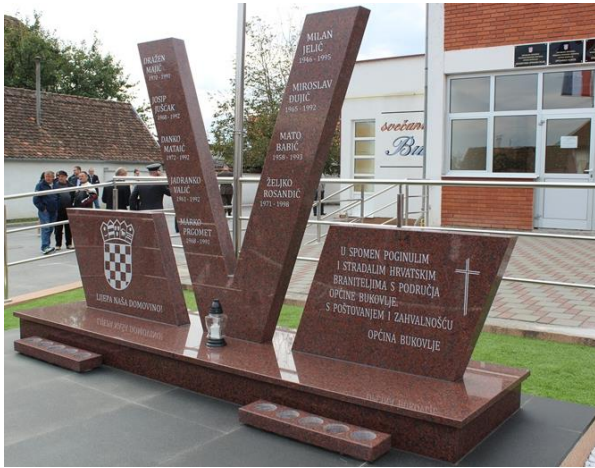
Fotografija 17: Spomenik poginulim i stradalim braniteljima s područja Općine Bukovlje

Općina Bukovlje podigla je 2016. godine spomen-obilježje stradalim braniteljima Bukovlja i okolice. 94 Spomen-obilježje nalazi se ispred same zgrade Općine Bukovlje, a sastoji se od tri mramorne spomen ploče koje stoje na istom postolju. S lijeve strane stoji spomen ploča s hrvatskim grbom ispod kojeg su ispisani stihovi hrvatske himne: LIJEPA NAŠA DOMOVINO! . Središnja ploča u obliku slova V sadrži imena i godine rođenja i smrti 9 branitelja iz Bukovlja, a ploča s desne strane sadrži posvetu braniteljima i križ. Ispod postolja nalaze se dva manja postolja namijenjena postavljanju lampiona.