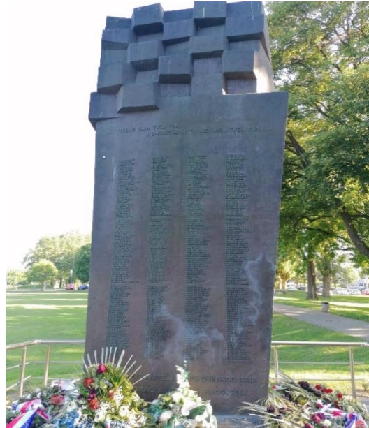
Fotografije 7 i 8: Spomen-obilježje i spomenik „Poginulim braniteljima Hrvatske“, Slavonki Brod