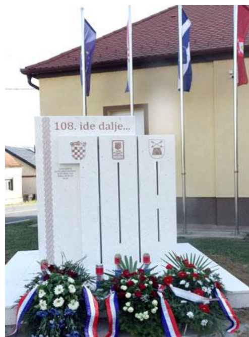
Fotografija 18: Spomenik pripadnicima 108. brigade u Podcrkavlju

U radu je već spomenuto da je 108. brigada osnovana krajem lipnja 1991. godine kao dragovoljačka postrojba ZNG. Njena 1. pješačka bojna tada je osnovana u selu Podcrkavlje, a 2. pješačka bojna u selu Sibinj. Na 31. godišnjicu njezina nastanka otkriven je spomenik poginulim i nestalim pripadnicima 108. brigade u Podcrkavlju. 95 Bijeli kameni spomenik sadrži grbove Republike Hrvatske, ZNG-a i 108. brigade, a na vrhu stoji poruka: 108. ide dalje... Osim grbova, na spomeniku se nalazi i simbol hrvatskog pletera koji se proteže cijelim