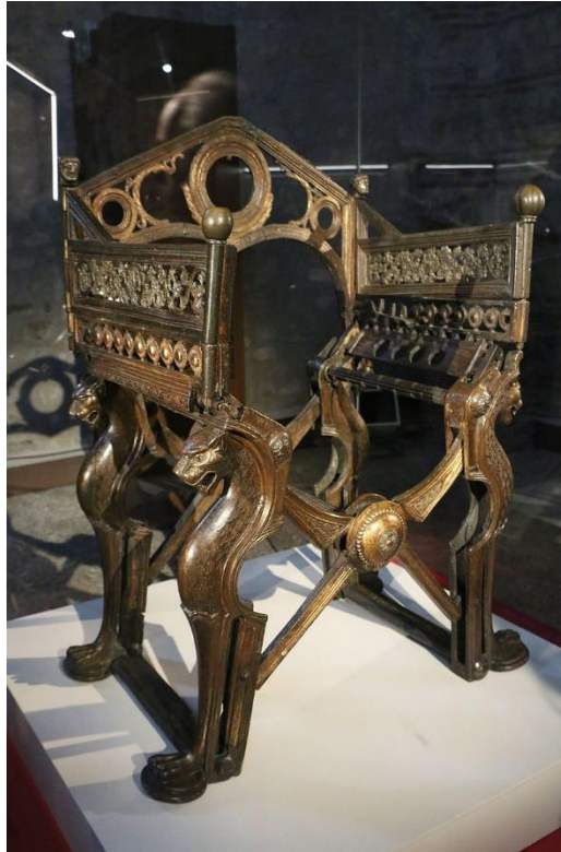
Slika 7. Pariz, Nacionalna knjižnica Francuske, Kabinet medalja Dagobertov tron, 7. stoljeće