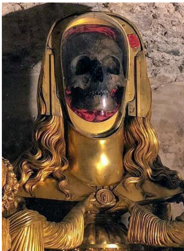
Slika 5. Saint-Maximin-la-Sainte-Baume, bazilika Saint-Maximin-la-Sainte-Baume, Lubanja Marije Magdalene, 1. stoljeće