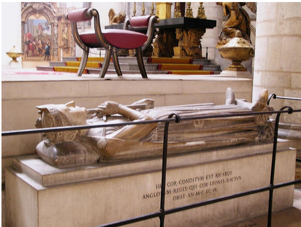
Slika 8. Rouen, Notre-Dame de l'Assomption, grobnica sa srcem kralja Rikarda, 13. stoljeće