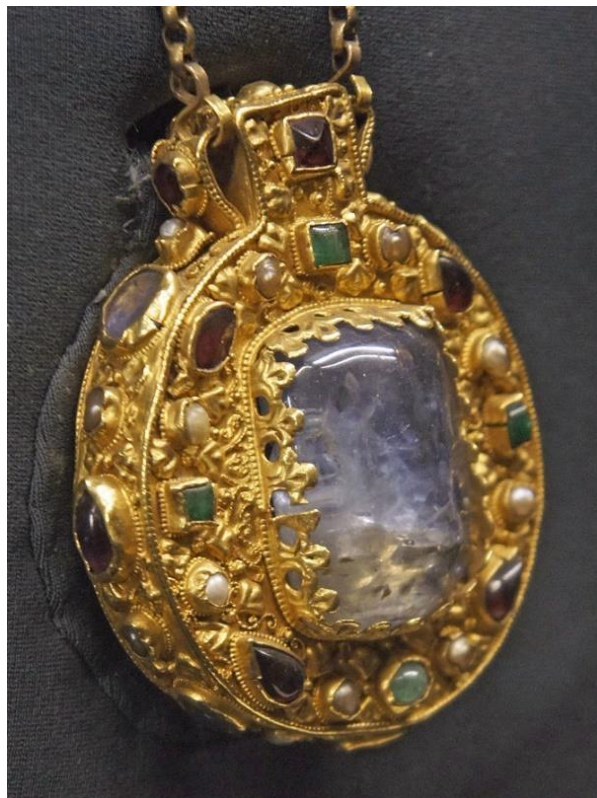
Slika 2. Amiens, katedrala Notre-Dame, krunski relikvijar Parakleta, 1230–1240.