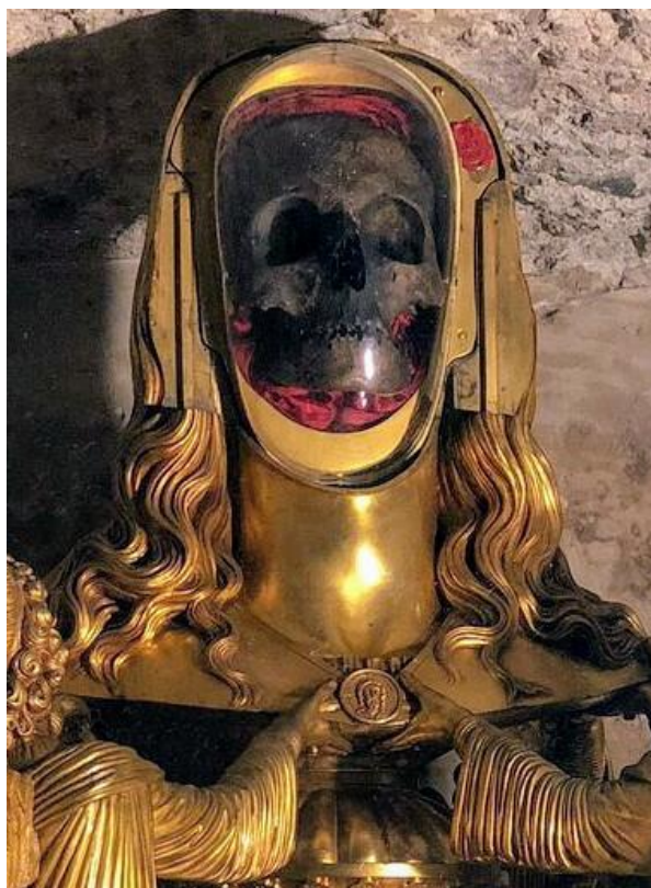
Slika 5. Saint-Maximin-la-Sainte-Baume, bazilika Saint-Maximin-la-Sainte-Baume, Lubanja Marije Magdalene, 1. stoljeće