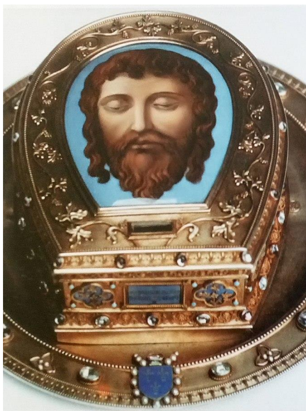
Slika 6. Amiens, katedrala Notre-Dame, Relikvijar glave svetog Ivana Krstitelja, 19. stoljeće