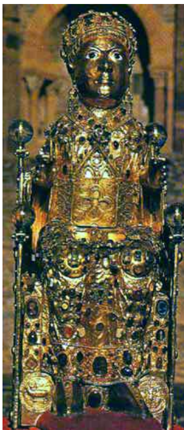
Slika 9. Conques, opatijska crkva Sainte-Foy, relikvijar Svete Foy, 5. stoljeće