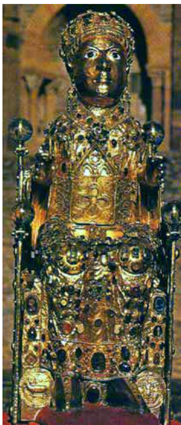
Slika 9. Conques, opatijska crkva Sainte-Foy, relikvijar Svete Foy, 5. stoljeće