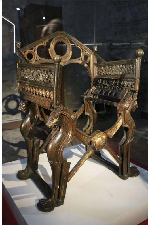
Slika 7. Pariz, Nacionalna knjižnica Francuske, Kabinet medalja Dagobertov tron, 7. stoljeće