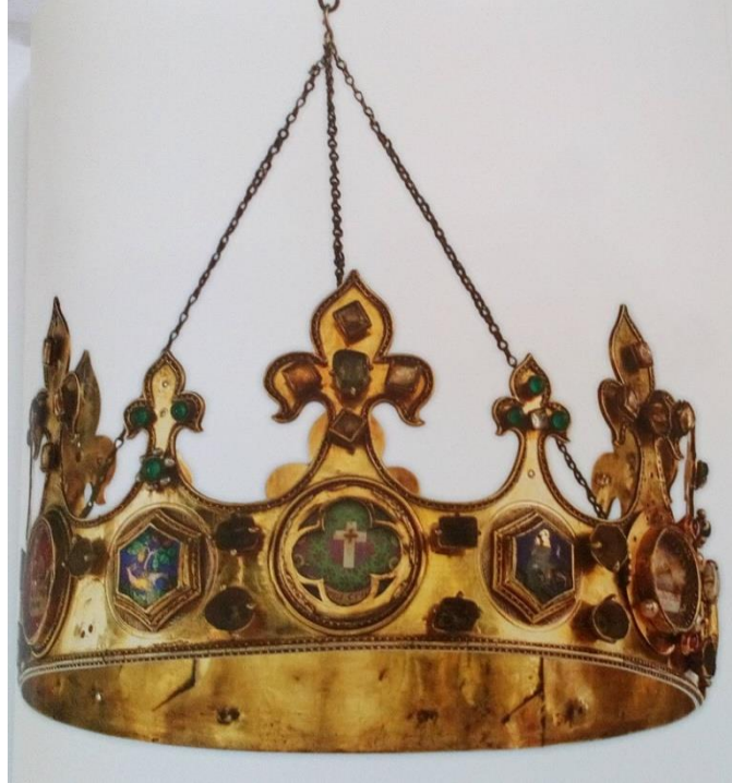
Slika 3. Reims, Palača Tau, Talisman Karla Velikog, 9. stoljeće