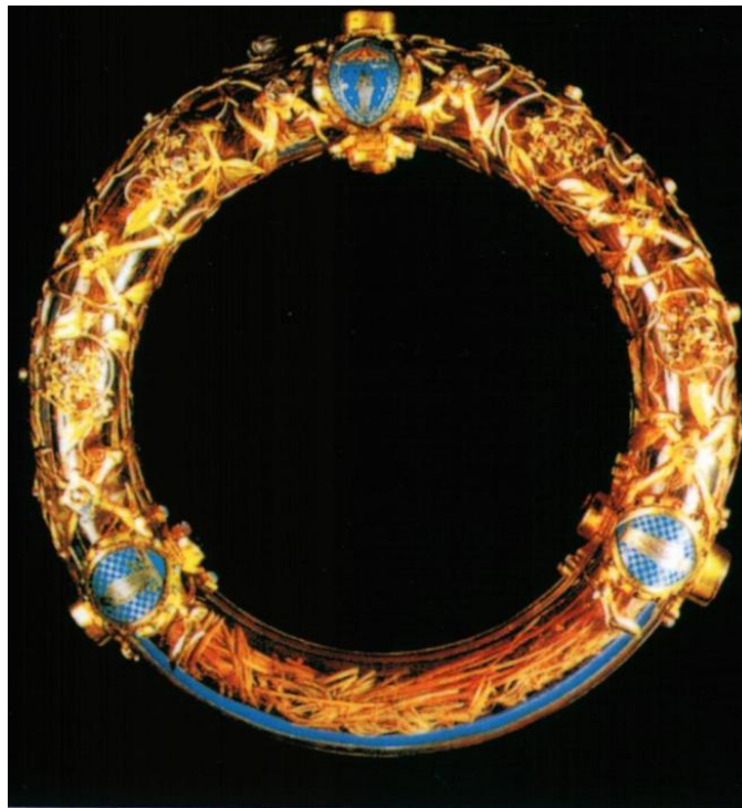
Slika 1. Pariz, katedrala Notre-Dame, kruna od trnja u kružnom relikvijaru, 1896.