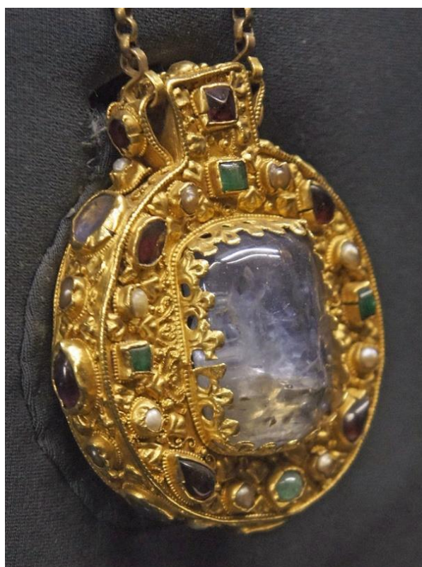
Slika 2. Amiens, katedrala Notre-Dame, krunski relikvijar Parakleta, 1230–1240.