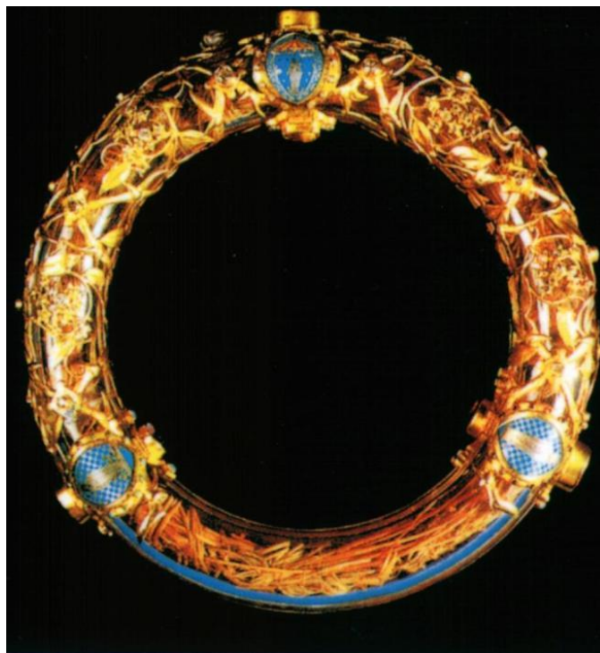
Slika 1. Pariz, katedrala Notre-Dame, kruna od trnja u kružnom relikvijaru, 1896.