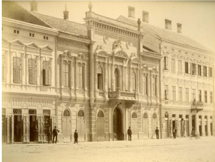
Palača Vranyczany u središtu niza, zgrada originalno zamišljenog projekta