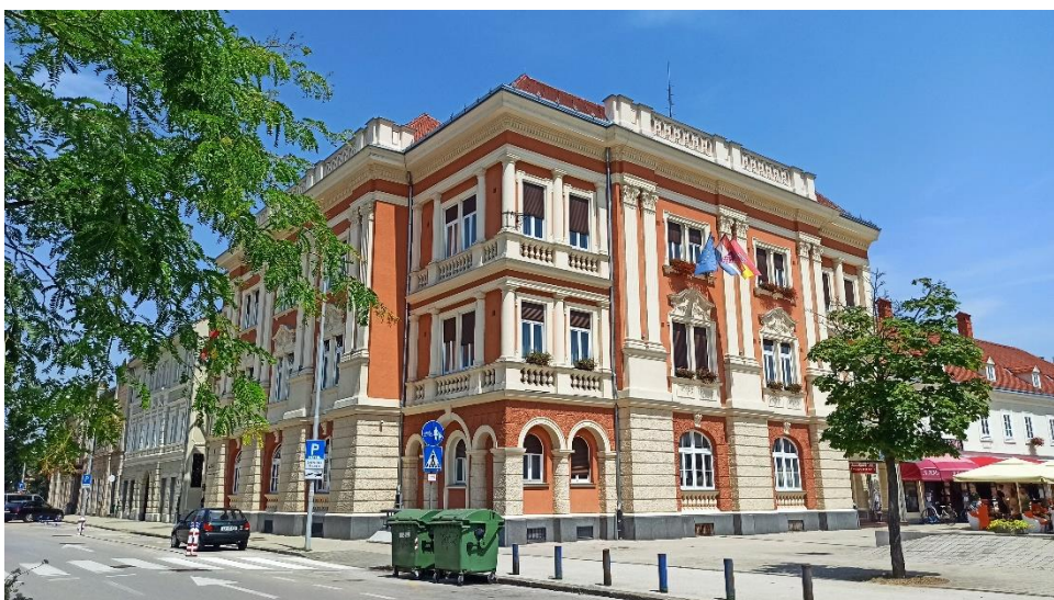
Palača Fröhlich , 1918., stanje danas (29. 6. 2022.)