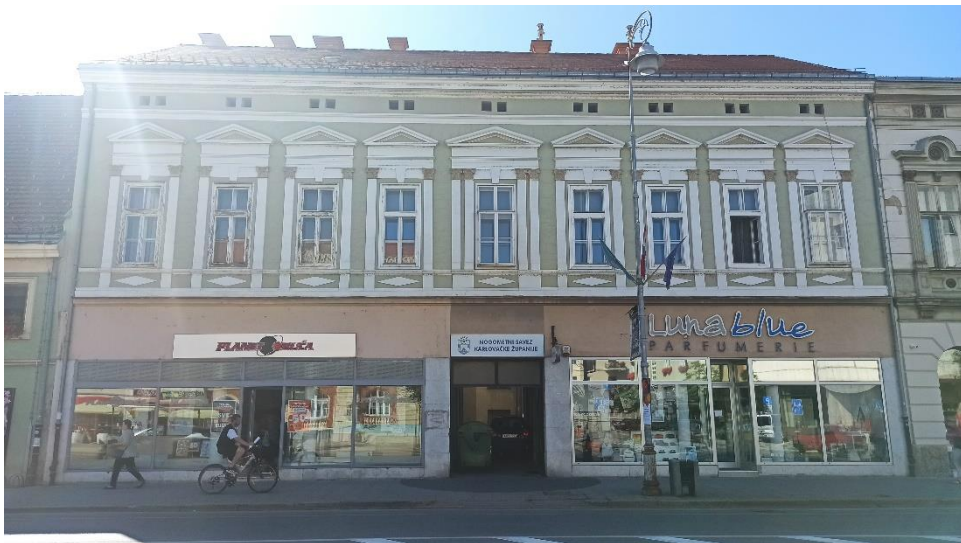
Kuća Banjanin na Zrinskom trgu 5, 1880ih (1. 7. 2022.)

izduženim rombovima u žbuci, a gornji je dio naznačen elementom koji podsjeća na ključni kamen. Pilastri imitiraju nosače koji nosi dvostruki grednjak na vrhu kojega je trokutni zabat. Iznad zabata slijedi profilirani vijenac. Ispod krovnoga se vijenca nalazi uska horizontalna traka u kojoj su otvorene male kvadratne bifore. Jednokatnice u nizu na brojevima 17 i 19 primjeri su klasicističke arhitekture prve polovine 19. st. građene za bogatiji karlovački sloj, od kojih ona na broju 17 ima nadogradnje iz 1860. godine, no skromnijeg repertoara historicističke razrade. Zgrada ima prostorije poslovne namjene u prizemlju, dok je na prvome katu jedan trosobni stan u privatnom vlasništvu. 182