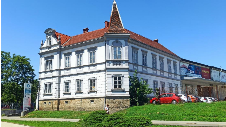
Upravna zgrada Tvornice Ignac Jellenc, 1908., stanje danas (1. 7. 2022.)