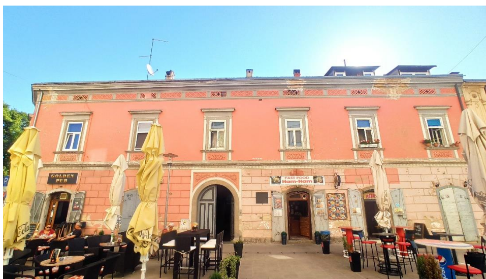
Uglovnica u Šebetićevoj ulici 4 (Kuća Bunette), 1880ih

Uglovnicu je sagradila nakon velikog požara 1866. godine obitelj Buneta na mjestu starije drvene kuće u kojoj je osnovana Narodna čitaonica „Ilirskog čitanja društvo“. Kuća ima očuvanu stariju konstrukciju, a pročelje bogatim detaljima profilacije ostvaruje klasifikaciju stila romantičnog historicizma. 186 Raščlamba pročelja u prizemnoj zoni ostvarena je pravokutnim žbukanim poljima glatke plohe. Polje iznad glavnoga polukružnoga ulaza dekorirano je simetričnim elementima vitica i medaljonima. Između prizemne zone i zone kata označeno je dvama vijencima, od kojih je niži dekoriran reljefnim četverolistima, a gornji je vijenac profiliran. Zona kata raščlanjena je pravokutnim prozorima koji su dodatno naznačeni reljefno dekoriranom pravokutnom plohom ispod prozorske klupe. Bočne su strane prozora omeđene uskim pilastrima koji imitiraju funkciju nosača širokog arhitrava čiste plohe iznad prozora, a ispod profiliranog nadstrešnika. Horizontalna traka ispod krovnoga vijenca dekorirana je pravokutnim reljefno razrađenim poljima koja slijede u paru, a između njih je postavljen uski pravokutni otvor s rešetkom koja imitira tranzenu. Zgrada ima prostorije poslovne namjene u prizemlju, dok se na katu nalaze stanovi. 187