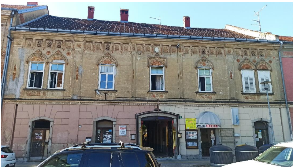
Jednokatnica u Preradovićevoj ulici 5, 1870.