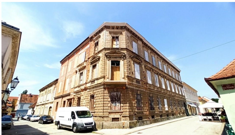
Zgrada Srpske pravoslavne općine u Radićevoj ulici 14, 1882. (29. 6. 2022.)