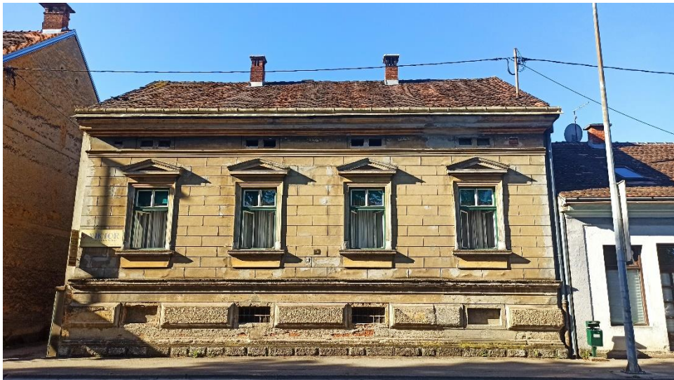
Neorenesansna prizemnica u Riječkoj/Mačekovoj ulici na br. 29 (1. 7. 2022.)

Prizemnice na brojevima 43 i 45 odlikuju se skromnijom dekoracijom pročelja i glatkom plohom zidnoga plašta. Izgrađene su na prijelazu stoljeća. Prizemnica na broju 43 u bazi je prekrivena grubo klesanim kamenom. Simetriju određuje središnji položaj ulaznih vrata prema ulici (vrata s lijeve strane vjerojatno su dodana naknadno), a sa svake strane su po tri prozora uokvirena kamenim okvirima iznad kojih se nalaze prozorske krune (njem. Fensterverdachung ). Ispod prozorskih otvora po cijeloj dužini kuće slijedi reljefni vijenac. U gornjoj je zoni uska horizontalna traka određena plitkim reljefnim vijencima, a raščlanjena uskim pravokutnim otvorima koji slijede otvore u donjoj zoni, od kojih je nekoliko u središnjoj zoni zazidano. Prizemnica na broju 45 sličnih je odlika kao i kuća na broju 43, osim izostalih prozorskih okvira, a krovni je vijenac s dentima. Obje su zgrade u privatnom vlasništvu. 91 Prizemnice slične tipologije nalazimo i u Ulici Dubovac na brojevima 6 i 18.