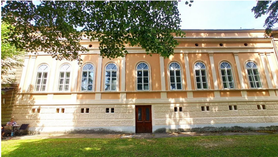
Visoka prizemnica na Šetalištu dr. Franje Tuđmana 3, 1880ih