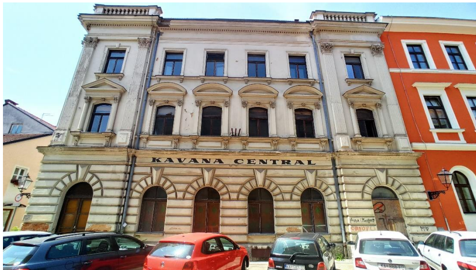
Hotel „Central“ na križanju Samostanske ulice i Ulice J. Haulika, 1894. (29. 6. 2022.)