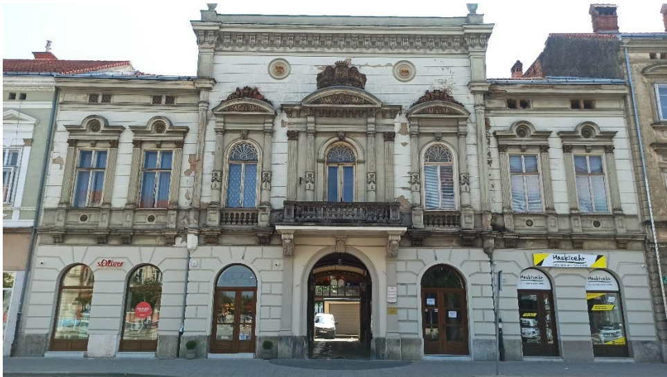
Palača Vranyczany danas, nakon preinaka iz 1935./1937. (1. 7. 2022.)