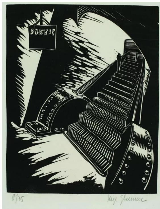
Slika 11. Izlazne stepenice metroa, grafička mapa „Le Metro“, Muzej suvremene umjetnosti, Zagreb, 1928. ( https://grazia.hr/retrospektiva-sergije-glumac-galerija-klovicevi-dvori/

linorezima prikazuje situacije u metrou poput čekanja vlaka, dolaska vlaka na stajalište te kontuktera koji stoji na vratima. Pojedini prikazi sadrže likove poput konduktera ili putnika no karakteristično za Glumca ni na jednoj grafici nije prikazana gužva već se radi o malom broju likova. Kod nekih linoreza iz mape „Le Metro“ likovi su izostavljeni u potpunosti i prikazane su scene poput praznih stuba (Slika 11). 76