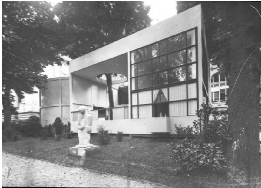
(Slika 6.) Le Corbusier, L'esprit Nouveau, 1920. ( https://www.archdaily.com/883336/le-corbusiers-pavillon-de-lesprit-nouveau-named-one-of-20-designs-that-defined-the-modern-world Preuzeto: 26.7.2022.)

preuzela vodeću ulogu u ostalim umjetničkim područjima art décoa, arhitektura je bila predvođena Američkim građevinama. Paviljoni i druge arhitektonske strukture, izrađene za Parišku izložbu 1925., stvorene su kao privremene strukture što je rezultiralo u tome da su ih kasniji arhitekti i dizajneri poznavali isključivo sa fotografija i crteža. 35 Jedan od bitnijih paviljona bio je Le Corbusierov L'esprit Nouveau (Slika 6.). Paviljon je popunio sa elementima masovne proizvodnje te oduzeo sve elemente koji su prije bili vidljivi u arhitekturi, a koje je on smatrao ne potrebnom dekoracijom. 36