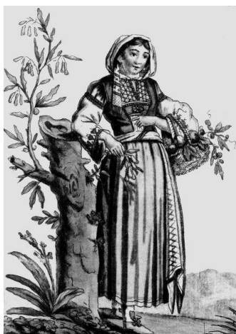
Prilog 3: Morlakinja iz okolice Zadra, gravura iz 18. st. ( https://www.enciklopedija.hr/Ilustracije/HE7_0996.jpg )