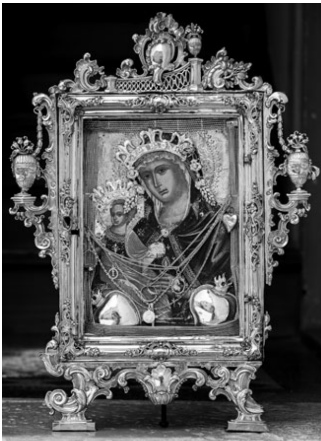
Sl. 6. Čudotvorna Gospa Rapska, crkva samostana sv. Andrije, Rab