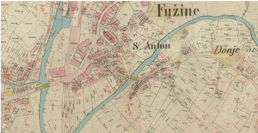
Slika 1. Prikaz današnje crkve sv. Antuna Padovanskog na katastarskoj izmjeri 1862. godine

Što se tiče smještaja u odnosu na dijelove naselja, analiza povijesnih zemljovida i povijesnog katastra, uz pregled postojećeg stanja, dovodi do zaključka da je prvotno naselje zbijenoga tipa bilo smješteno na padinama brijega, uokolo kojega je meandrirao potok Ličanka. S obzirom na okolnosti izgradnje nove fužinske župne crkve u prvoj polovini 19. stoljeća, za analizu prostornog razvoja Fužina nisu nam bile od koristi inače dragocjene austrijske vojne izmjere iz druge polovine 18. i prve polovine 19. stoljeća. Poznato je da je grafički izvrsna austrijska katastarska izmjera u ovim krajevima koji su već imali josefinski katastar provedena relativno kasno. To se dogodilo stoga što je Austriji zbog razreza poreza u prvoj polovini 19. stoljeća bilo primarno novim tehnikama snimanja i kartiranja obuhvatiti ona područja unutar svojih novih granica koja su nekad pripadala Mletačkoj Republici. Katastarska izmjera Fužina iz 1862. godine u zoni uokolo nove župne crkve, a i što se tiče same crkve, praktično je dokumentirala i danas postojeće stanje (slika 1). Ranije vojne izmjere izvanredno su važne za urbanističku analizu naselja, ali posve nepouzdanе za slučaj oblikovanja i smještaja na razini topografskog znaka shematski ucrtane prvotne crkve. 15