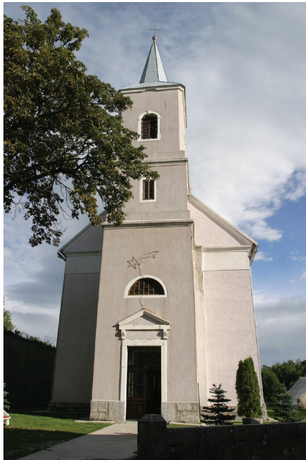
Slika 4. Fužine, zvonik župne crkve sv. Antuna Padovanskog istaknut u osi pročelja, foto: Damir Krizmanić