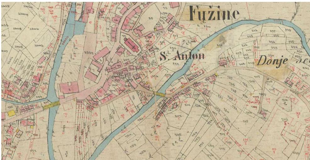
Slika 1. Prikaz današnje crkve sv. Antuna Padovanskog na katastarskoj izmjeri 1862. godine

Što se tiče smještaja u odnosu na dijelove naselja, analiza povijesnih zemljovida i povijesnog katastra, uz pregled postojećeg stanja, dovodi do zaključka da je prvotno naselje zbijenoga tipa bilo smješteno na padinama brijega, uokolo kojega je meandrirao potok Ličanka. S obzirom na okolnosti izgradnje nove fužinske župne crkve u prvoj polovini 19. stoljeća, za analizu prostornog razvoja Fužina nisu nam bile od koristi inače dragocjene austrijske vojne izmjere iz druge polovine 18. i prve polovine 19. stoljeća. Poznato je da je grafički izvrsna austrijska katastarska izmjera u ovim krajevima koji su već imali josefinski katastar provedena relativno kasno. To se dogodilo stoga što je Austriji zbog razreza poreza u prvoj polovini 19. stoljeća bilo primarno novim tehnikama snimanja i kartiranja obuhvatiti ona područja unutar svojih novih granica koja su nekad pripadala Mletačkoj Republici. Katastarska izmjera Fužina iz 1862. godine u zoni uokolo nove župne crkve, a i što se tiče same crkve, praktično je dokumentirala i danas postojeće stanje (slika 1). Ranije vojne izmjere izvanredno su važne za urbanističku analizu naselja, ali posve nepouzdana za slučaj oblikovanja i smještaja na razini topografskog znaka shematski ucrtane prvotne crkve. 15