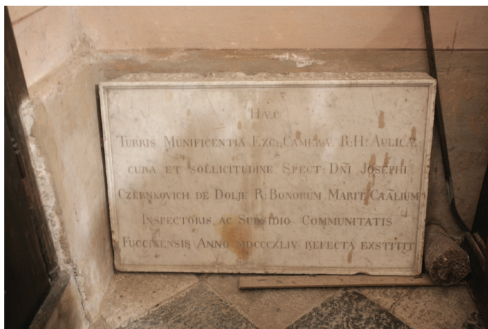
Slika 5. Fužine, dislocirani natpis o dovršenju obnove zvonika u doba Josipa Crnkovića, 1844. godine, foto: Damir Krizmanić