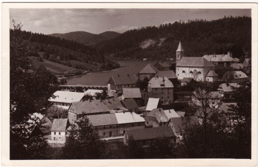
Slika 10. Klasicistička crkva sv. Antuna Padovanskog kao dominantna u kulturnom krajoliku naselja razvijenoga na Karolinskoj cesti, fotografija iz polovine 20. stoljeća

kojima su se mala naselja često znala naći pri pokretanju arhitektonskih zahvata čija je cijena premašivala njihove financijske mogućnosti (slika 10). Spomenuti arhivski podatci dobar su komparativni primjer i za poznavanje prilika oko uređenja, opremanja, održavanja i popravka crkvenih zdanja u Gorskom kotaru, osobito u vremenu druge polovine 19. i prvim desetljećima 20. stoljeća. Ovdje arhivski potvrđeni majstori poput altarista i zidnog slikara i šire su poznati po svojim realizacijama, osobito onima s riječkoga i vinodolskoga područja.