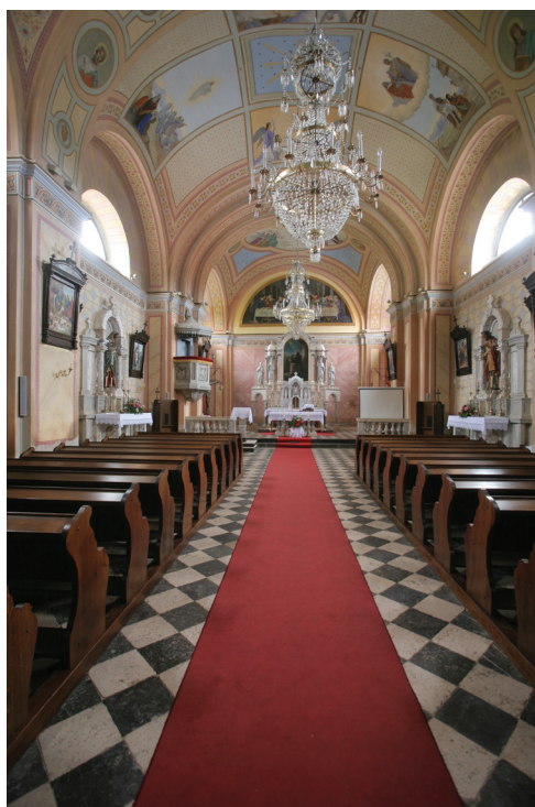
Slika 6. Pogled na crkveni brod prema glavnom oltaru

Važno je istaknuti da sastavni dio ambijenta predstavlja susjedna zgrada župnog stana kojem je posve sačuvana kasnobarokna konstrukcija svođenog podruma. Dijelom je sačuvan dvorišni ogradni zid s masivnim poklopnicama kao i masivno podziđe s velikim klesancima sлагanima u prevezu. Slikovito prevezano podziđe od velikih, precizno sлагanih kamenih blokova nekad je rubilo cjelokupnu parcelu crkve, a danas je sa sjeverne strane zamijenjeno betonskim zidom. Crkva je oblikovanjem i dobro odmjerenom impostacijom sračunato dominirala naseljem, što nije zasjenila nijedna kasnija gradnja.