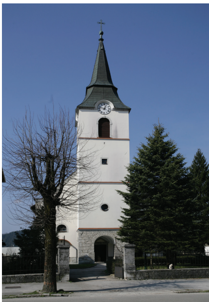
Slika 7. Delnice, pročelje župne crkve s istaknutim zvonikom, foto: Damir Krizmanić