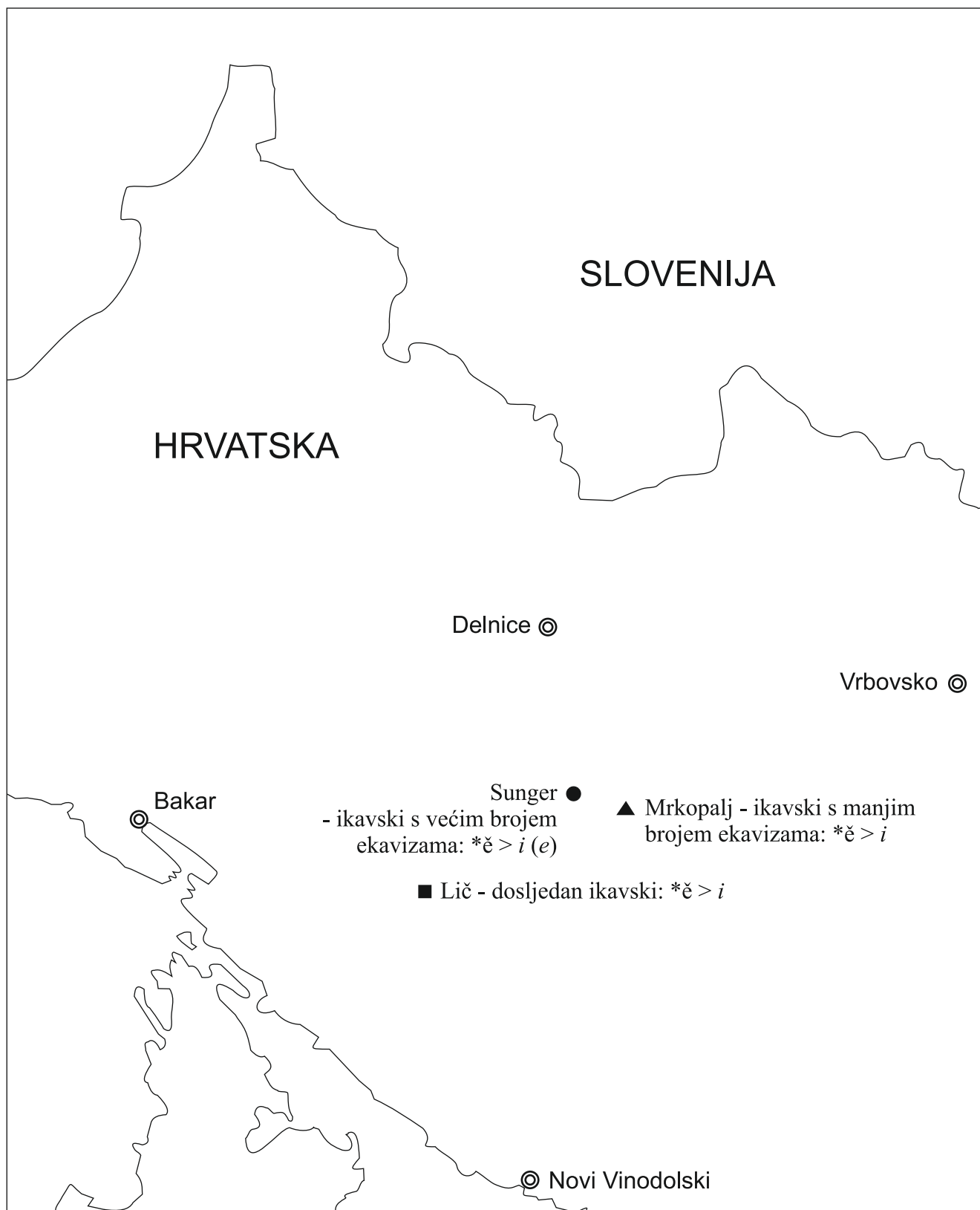
Odras jata u štokavskim ikavskim govorima Gorskoga kotara