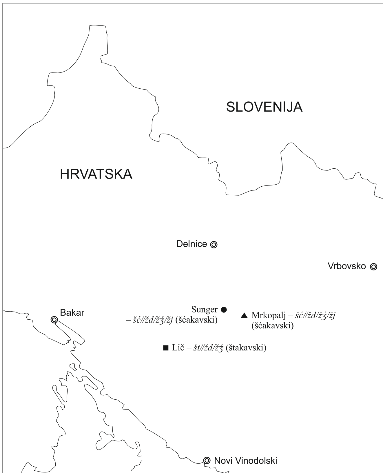
Štakavizam/ščakavizam u štokavskim ikavskim govorima Gorskoga kotara