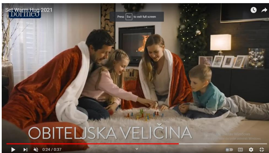
Slika 7. Isječak iz televizijske reklame za Set Warm Hug 2021

U ovoj je reklami proizvod povezan s idealnom obitelji, odnosno toplinom i uživanjem u obiteljskom domu. Izbor riječi kojima se opisuje proizvod može se povezati sa životom idealne obitelji, a mnogi su atributi semantički prazni, odnosno u navedenim sintagmama ne nose dodatno značenje kojim bi se proizvod jasnije opisao.