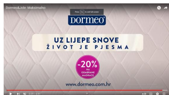
Slika 8. i 9. Isječci iz reklame za Dormeo.