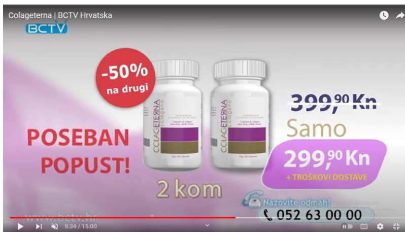
Slika 12. i 13. Isječci iz reklame za Colageternu

Reklame tvrtke BCTV Hrvatska sličnije su reklamama koje su bile na televiziji prije nekoliko godina. Danas su one u pravilu nešto kraće i sličnije reklamama kakve su navedene za tvrtku Dormeo . Prateći učestalost ovih reklama na televiziji, čini se da se emitiraju i rjeđe nego prethodnih godina, uglavnom u jutarnjem terminu i često iza jutarnjih vijesti. To je vrijeme kada je kod kuće pred televizorom ciljna publika, a to su primarno starije osobe, nerijetko u mirovini. Također, reklame su sada češće na internetu i društvenim mrežama nego na televiziji. Naime, suvremen način života, elektronički uređaji i njihova dostupnost doveli su do toga da prosječni konzumenti sve više prate društvene mreže. Dakako, osobe starije životne dobi zasigurno su više okrenute televiziji. Reklame poput posljednje tri analizirane traju dugo kako bi se zapamtile, kako bi uvjerile potencijalnog kupca i kako bi dalo vremena da se proizvod odmah i naruči.