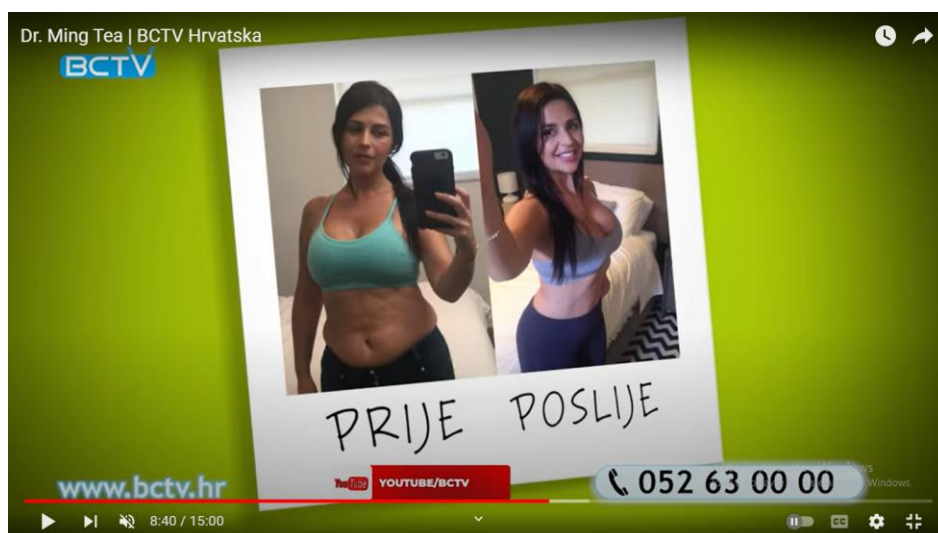
Slika 11. Isječak iz reklame za Dr. Ming Tea

znači da ćemo biti manje gladni te ćemo manje jesti, te će rezultati doći brzo i smršavjet ćemo bez puno truda. Dakle, nema vježbanja i dijeta, što nekome tko želi smršavjeti zvuči jako primamljivo. Tako jedna od sugovornica navodi da joj se nakon konzumacije čaja težina skoro kao da se počela topiti , što potvrđuje da sve ide vrlo brzo i jednostavno. Sugerira se da je potrebno samo popiti šalicu čaja, a to zaista nije teško u usporedbi s vježbanjem i napornim dijetama. Sve to potvrđuje nekoliko sugovornika uz njihove fotografije prije gdje se vidi da su sada vidno mršaviji, a to je sve dokaz koliko ima zadovoljnih korisnika. Također, navodi se da je riječ o prirodnom načinu mršavljenja, što je isto važno jer se naglašava da se ne radi o nečemu djelotvornom, ali dugoročno štetnom proizvodu, nego o nevjerojatnom potpuno prirodnom proizvodu.