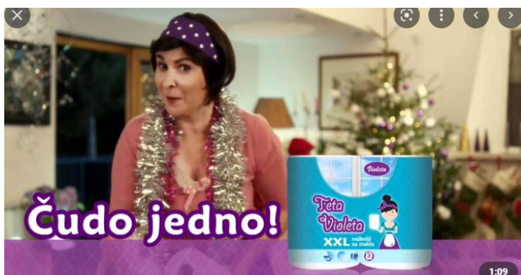
Slika 1. Primjer reklame sa strategijom svjedočanstva 4

proizvod na temelju vlastitog pozitivnog iskustva, odnosno njegova pozitivnog učinka. Preporuku često daje neka poznata osoba. Naravno, korisno svjedočanstvo može dati i netko koga publika uopće ne poznaje, ali mora imati obilježja ciljne skupine kojoj je proizvod namijenjen. Primjerice, domaćica može dati uvjerljivu potvrdu za neki kućanski aparat ili neki predmet u općoj upotrebi u domaćinstvu. Za reklamu sa svjedočenjem najbolje je da sadrži demonstraciju proizvoda u upotrebi (Agnew, O'Brien 1965: 221-223).