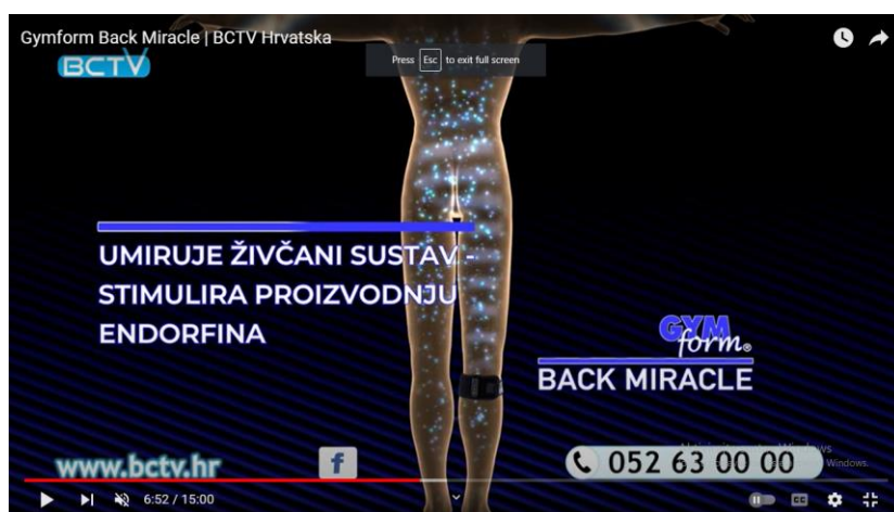
Slika 10. Isječak iz reklame za Gymform Back Miracle

U ovoj se reklami naglasak na pozitivnim, točnije čudesnim učincima proizvoda na zdravlje, što potvrđuju svjedočanstva osoba koje su proizvod upotrebljavale. Dokaz je njegove znanstvene potvrde jednostavan slikovni prikaz, u kojem se tek navodi krajnji učinak uporabe proizvoda, te svjedočanstvo stručnjaka koji jamči njegovu medicinsku dobrobit. Kvaziznantveni prikaz načina djelovanja navedenog proizvoda manipulacijska je strategija kojom se utječe na ciljnu publiku, osobe mahom starije životne dobi koje imaju bolove.