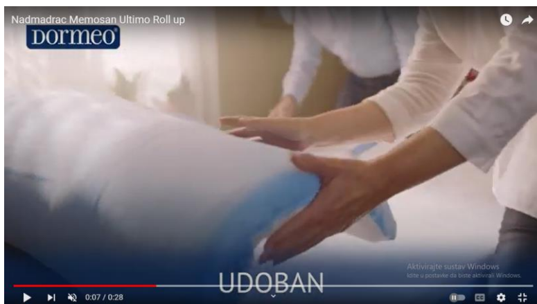
Slika 5. Isječak iz televizijske reklame za nadmadrac Memosan Ultimo Roll up

U reklami je u prvom planu praktičnost i funkcionalnost samoga proizvoda, koja se povezuje sa životnim stilom mladih ljudi.