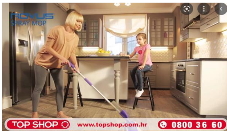
Slika 2. Primjer reklame sa strategijom demonstracije uporabe proizvoda 5

Dakle, od samih je početaka do naših dana došlo do promjena što se tiče pisanja i osmišljavanja televizijskih reklama. Kao što je već spomenuto, danas se u reklamama najčešće koriste svjedočanstvo i demonstracija jer je potencijalnom kupcu važno čuti nečije mišljenje i preporuku za određeni proizvod te je važno vidjeti kako se određenim proizvodom rukuje ili kako ga se upotrebljava. Zapravo obje strategije, i svjedočanstvo i demonstracija uporabe proizvoda, služe povezivanju proizvoda s ciljnom skupinom prema nekim vizualnim obilježjima, primjerice izgled, stil života i sl.