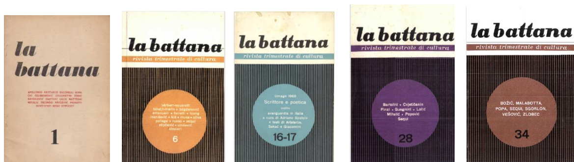
Fig. 1. Le soluzioni grafiche per le copertine de «La battana», n. 1, n. 6, nn. 16-17, n. 28, n. 34

In fondo a ogni indice della rivista vengono nominati gli artisti dei lavori utilizzati per la creazione delle copertine. Inoltre, alcuni numeri de «La battana», sono tematici e dedicati interamente agli artisti fiumani. Il numero 172 loda l'operato di Romolo Venucci, in quanto si tratta di una monografia del maggior rappresentante dell'arte della Comunità italiana a Fiume. Dell'artista viene elaborata sia una breve biografia sia una critica artistica relativa al suo operato. Viene rilevato che, oltre all'arte, si è dedicato alla didattica scolastica, insegnando agli alunni l'importanza del vivere la propria città natale, la cultura e la lingua parlata. Il numero speciale 6 è pure monografico e dedicato interamente al lavoro e alla vita di Erna Toncinich, pittrice, docente, critica e storica dell'arte, allieva di Romolo Venucci, nonché editrice grafica della rivista «La battana». Il numero 183 è pure monografico, dedicato all'operato di Sergio Molesì, grande storico dell'arte e critico, figura di spicco italiana nelle relazioni culturali tra le due sponde.