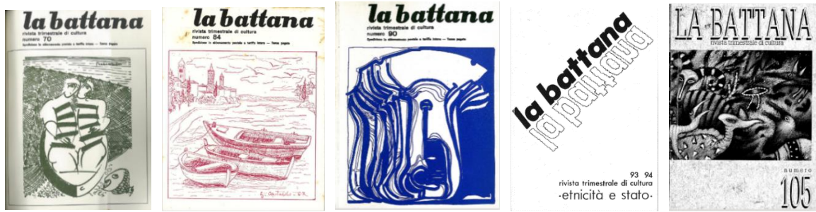
Fig. 3. Le soluzioni grafiche per le copertine de «La battana», n. 70, n. 84, n. 90, nn. 93-94, n. 105