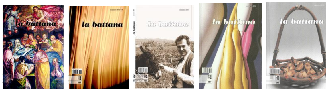
Fig. 5. Le soluzioni grafiche per le copertine de «La battana», n. 162, nn. 173-174, n. 183, n. 190, n. 199