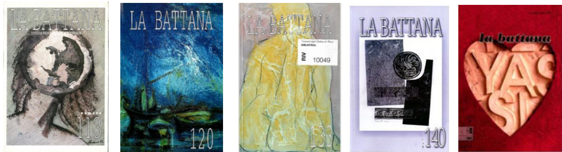
Fig. 4. Le soluzioni grafiche per le copertine de «La battana», n. 113, n. 120, n. 133, n. 140, n. 153