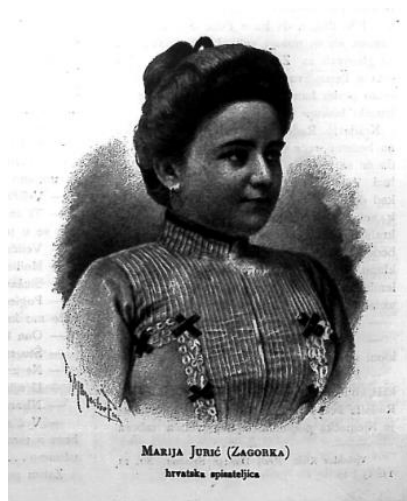
Slika 5: Marija Jurić- Zagorka, hrvatska spisateljica 109

Žena u novinarstvu nije bilo mnogo. To je zanat koji se ipak jače razvio tijekom i nakon Prvog svjetskog rata. Krajem 19.stoljeća, jedna žena se bavila novinarstvom, a to je bila Marija Jurić Zagorka. Započela je svoju karijeru 1896.g. Osim novinarstva, bavila se i književnim radom. Prvi roman „Roblje“ iz 1899.g. izlazio je u časopisu Obzor . Među najpoznatijim djelima koji nastaju prije početka rata svakako je ciklus romana „Grička vještica“ koji nastaju između 1912. i 1915.g. a objavljeni su po dijelovima u „Malim Novinama“. 107 Koliko je bila omiljena u društvu i koliki je napredak predstavljala u društvu dokazuje i članak u listu Dom i Sviet piše o njoj: „...Među najvrstnije hrvatske spisateljice sadašnjega vremena možemo ubrojiti mladu, darovitu i duhovitu gospodju Mariju Jurić..., ...baveć se novinarstvom- sada je stalna suradnica Obzora – napisala je svu silu članaka i podlistaka..., ...najveće joj je djelo roman „Roblje“ koji je preveden na poljski jezik, onda su veće stvari „U zagorskom zatišju“, „Zorka“, „Iz Darinkina dnevnika“, „Crtice iz ženskog života“, „Tajni spisi“, napisala je dvije vesele igre „Roman“ i „Što žena umije“...“. 108