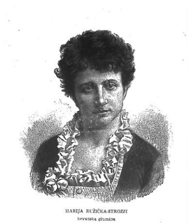
Slika 6: Marija Ružička- Strozzi, hrvatska glumica 139

Ljerka Šram, a početkom 90-ih godina Hermina Šumovska. 135 Kraj 19.stoljeća donio je korjenite promjene na području kazališta i glume. Zasluge pripadaju intendantu Stjepanu Miletiću, koji je 1894.g. uspio obnoviti operu, osnovao je glumačku školu, postavio je kvalitetan repertoar i prepoznao je talentirane scenske umjetnike. 136 Naglašavao je ulogu redatelja kao kreatora, te je u novoj zgradi HNK u Zagrebu otvorenu 1895.g., mogao lakše postaviti zahtjevnije produkcije. Glumci više nisu stajali na pozornici i recitali tekst, već su se kretali po sceni, a pažnja se posvećivala kostimima i scenografiji. Osim što je uspio dovesti kazalište na srednjoeuropsku razinu, pobrinuo se i za bolji položaj umjetnika i umjetnica u društvu. 137 U njegovoj eri prosperiraju Marija Ružička Strozzi, Ljerka Šram, Sofija Borštnik, Mila Dimitrijević, Milia Mihičić, te Nina Vavra. 138