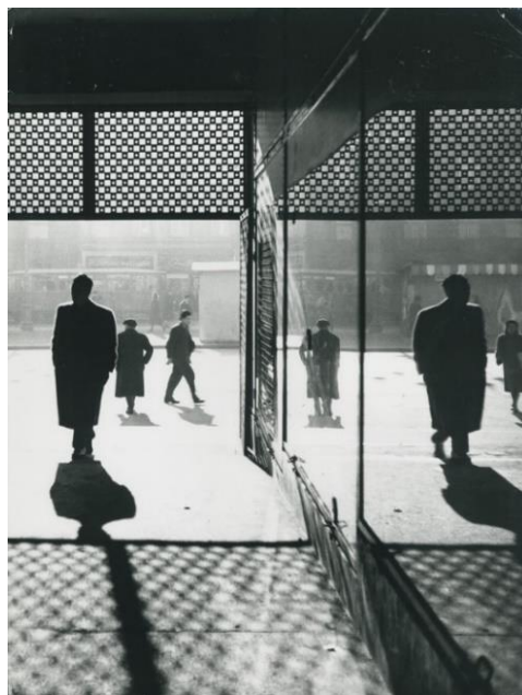
Fotografija 1. Slavka Pavić, U prolazu , 1955., fotografija, 29.9 cm x 39.3 cm, Fotoklub Zagreb (zbirka Hrvatske fotografije).

Ono što je minimalizam promicao bile su jednostavne geometrijske forme, redundancija motiva, uz cilj postizanja najveće moguće čistoće, naglasak na dijagonalama, razumijevanje dijela bez određenog iskustva i znanja te vođenje filozofijom manje je više. 22 Slavka Pavić pomno pratiti diskusije vođene u Fotoklubu te se u njenim radovima, poput Hijeroglifi (1956.), mogu prepoznati ključni momenti čistih jednostavnih formi fotografije.