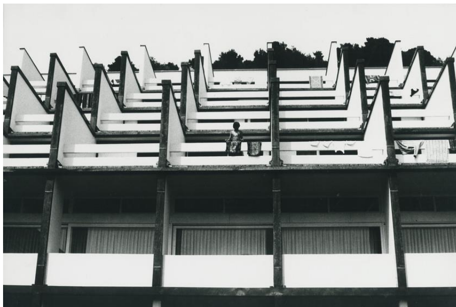
Fotografija 4. Slavka Pavić, Kuća s balkonima , 1977., fotografija, 39.8 cm x 26.5 cm, Fotoklub Zagreb (zbirka Hrvatske fotografije).

Fotografija je horizontalne kompozicije. Glavni motiv čini zid koji je vertikalno podijeljen na pet manjih dijelova koji daju ritmičnost kompoziciji fotografije. Ritmičnost je najviše naglašena blago dijagonalnim padom sjena. Na desnoj strani vidimo ljestve naslonjene na zid koje putem svoje sjene lome ritmičnost kompozicije. Ritmičnost postignutu sjenom dodatno naglašuje crno-bijela tehnika fotografiranja. Na drugim varijantama ove kompozicije ritmičnost putem sjene je i dalje prisutna, ali uz to je također prisutan i motiv čovjeka koji dodaje novi element fotografiji i pridonosi dinamičnosti kompozicije.