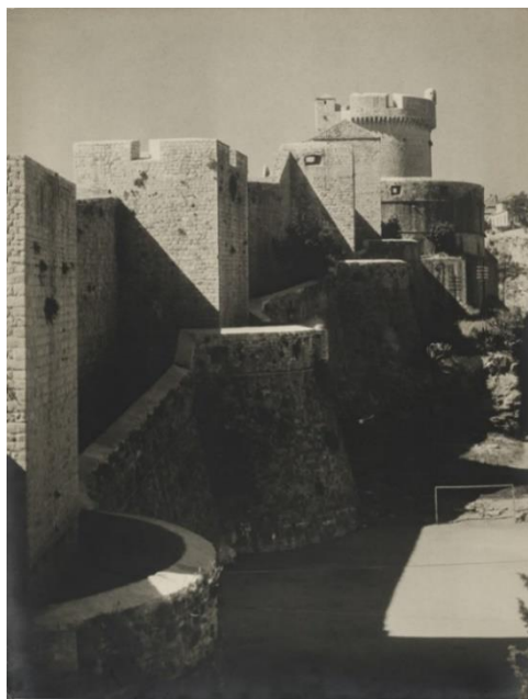
Fotografija 2. Tošo Dabac, Dubrovačke zidine , 1954., fotografija, 30 cm x 39 cm, Fotoklub Zagreb (zbirka Hrvatske fotografije).

Kada govorimo o urbanim motivima u hrvatskoj fotografiji 20. stoljeća važno je spomenuti fotografije Toše Dabca, najutjecajnijeg hrvatskog fotografa ovog perioda. 86 Dabac je jedan od aktivnijih članova Fotokluba Zagreb, kojem se pridružuje 1933. godine. 87 Tijekom 1930-ih godina sudjeluje na nekoliko međunarodnih izložbi poput Drugi međunarodni fotografski salon u Pragu i Deseti salon fotografije u Leicesteru koji su se održali 1933. godine. 88 Na spomenutim izložbama sudjeluje s istaknutim umjetnicima i fotografima poput Edwarda Westona, Mana Raya i Laszloa Móholy-Nágya, koji su svojim radom naročito dali doprinos u formiranju medija fotografije kao autonomnog umjetničkog medija. 89 Fotografski ciklus Toše Dabca od posebne je važnosti za razvitak suvremene hrvatske fotografije. Najvažnija izložba na kojoj Tošo Dabac izlaže 30-ih godina je bila Drugi philadelphijski salon fotografije održala 1933. godine u Pennsylvania Museum of Art na kojoj su sudjelovali svjetski poznati umjetnici i fotografi, poput ranije spomenutih Laszloa Móholy-Nágya i Henri Cartier-Bressona. 90